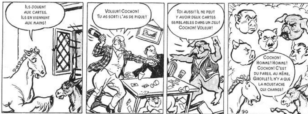
Image 5 : Norman Pett, dernières cases in George Orwell, La Ferme des animaux ( Republik zanimo ), Paris, L'Échappée, 2016, sans pagination