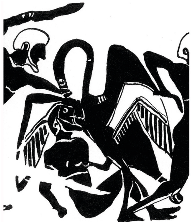
Fig. 10. La grue agrippe son adversaire : détail de l'hydrie du Louvre. (pygmée n° 6 de la fig. 3, dessin de l'auteure).

Plusieurs arguments permettent de positionner les grues en dehors de la civilisation. Grandies face à des corps minuscules, elles deviennent monstrueuses et s'approprient les caractéristiques de tout un bestiaire. Celui du lion d'abord : est-ce un hasard si l'une des grues agrippe sa proie en posant ostensiblement sa patte sur la poitrine de sa victime (personnage n° 6, fig. 10) ? Cette grue évoque ainsi le comportement du bestiaire cynégétique par excellence, le lion, dont l'agressivité est d'ordinaire exprimée de cette manière. Mais un autre bestiaire transparaît encore dans la scène : celui de l'oiseau charognard. Les peintures d'époque