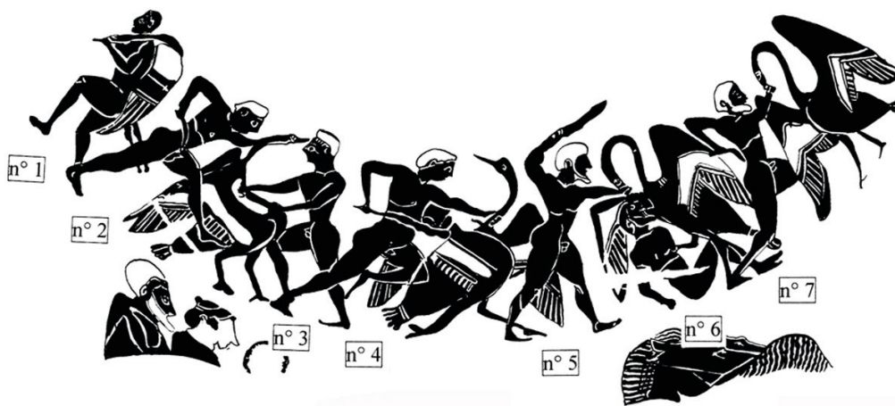
Fig. 3. Géranomachie, hydrie du Louvre, Inv. F 44 ; épaule du vase. Dessin de l'auteur.

Moins évident, cet usage du vase est pourtant attesté sur une hydrie du Peintre de Léningrad et sur une pyxis du Metropolitan Museum of Art [11]. Rien n'interdit donc de penser que le destinataire de l'hydrie du Louvre ait pu être un homme ou un jeune homme en âge de se marier. La géranomachie construit d'ailleurs une image complète de cet idéal masculin accompli : elle ne se contente pas de reprendre tous les canons physiques d'une beauté masculine mature – les pygmées ont les épaules larges, une taille fine, des fesses saillantes, de solides cuisses et mollets ; la présente géranomachie complète également cet idéal athlétique par un idéal moral qui nous ouvre grand les portes de l'héroïsme. Certes, il pourrait y avoir un paradoxe à envisager un héroïsme en rapport avec un peuple des confins : l'altérité géographique semble être prise en compte par l'image. Par ailleurs, le Vase François ne représente-t-il pas les pygmées à une extrémité du vase, sur le pied ? Et pourtant, ces pygmées, articulés à une idée d'altérité – mais laquelle ? – s'associent en même temps à une conception de la virilité et de la beauté lesquelles surgissent des combats particulièrement difficiles. Le ponos héroïque est là et celui des pygmées contre les grues est légendaire, dès Homère.