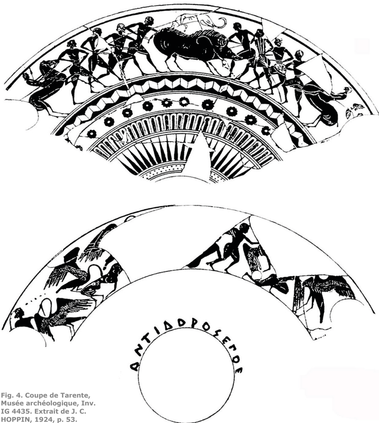
Fig. 4. Coupe de Tarente, Musée archéologique, Inv. IG 4435. Extrait de J. C. HOPPIN, 1924, p. 53.

d'un autre 'pedigree'. Et pourtant cette association est là : y a-t-il contrepoint entre les deux scènes ? Une dimension épique de la géranomachie que nous aurions perdu de vue en raison du faible nombre d'images archaïques qui nous sont parvenues ? Que ce soit sur un mode discursif direct – association explicite des pygmées à un exploit puis à sa récompense, sur l'hydrie du Louvre – ou que ce soit 'en creux' – la coupe de Tarente propose davantage