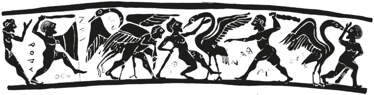
Fig. 7. Géranomachie, aryballe de Néarchos (New York, MMA, Inv. 2649). Dessin de l'auteur d'après G.M.A. RICHTER, 1932, pl. 11a.

les pygmées imberbes, qui prennent forcément sens par rapport aux plus âgés, ne participent-ils pas d'une stratégie iconographique destinée à insister sur la jeunesse d'une partie des personnages, et, partant, sur la jeunesse tout court ?