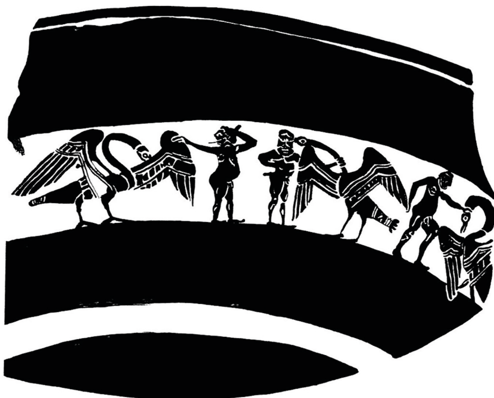
Fig. 11. Coupe fragmentaire de Berlin (Staatliches Museum, Inv. F 1785). Dessin de l’auteure d’après V. DASEN, 1993, pl. 60,1.

La question se pose alors de savoir si derrière ces reconstructions imaginaires ne se profile pas également un message éducatif relatif au comportement guerrier. Car le chaos se trouve bien être là, auprès de ces grues mutilantes et irrespectueuses du cadavre de leurs adversaires : l’image prendrait-elle aussi sens dans le regard citoyen du spectateur sensibilisé au respect éthique dû au cadavre sur le champ de bataille ? Si tel était le cas, les grues n’incarneraient que davantage un écart par rapport à une forme de civilisation, définie en termes de morale guerrière. Si ce sens de lecture s’avérait valide, le type d’altérité mobilisé ici ne serait plus tant d’ordre ethnologique ou exotique que d’ordre politique. Les grues qui mutilent s’attaquent d’ailleurs souvent à la tête de leurs adversaires [37], une partie du corps ennemi qui, dans la culture