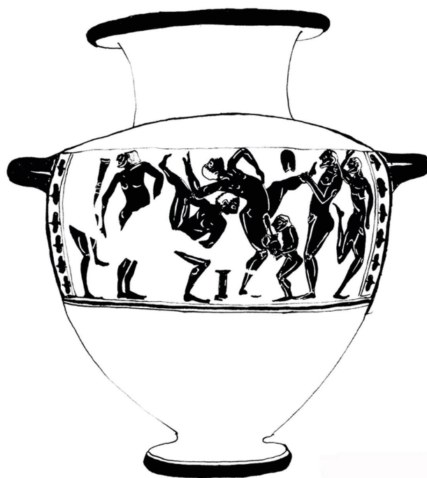
Fig. 6. Cômpos de l'hydrie de la Villa Giulia, Inv. 50425. Dessin de l'auteur d'après P. MINGAZZINI, 1930, n° 438.

soit l'homme en devenir. Cette lecture ne saurait toutefois concerner la totalité des pygmées représentés sur l'épaule de l'hydrie du Louvre : elle ciblerait davantage les pygmées les plus jeunes, imberbes, et peut-être spécifiquement montrés sous ce jour. Or, cette hypothèse relative au devenir, conception abstraite qui interpelle une temporalité ouverte, un état indéterminé, investit toute éducation. L'hydrie du Louvre n'aurait-elle pas choisi de figurer les jeunes pygmées en train d'accomplir une action dans son essence même – cette action qui est « en cours » ?