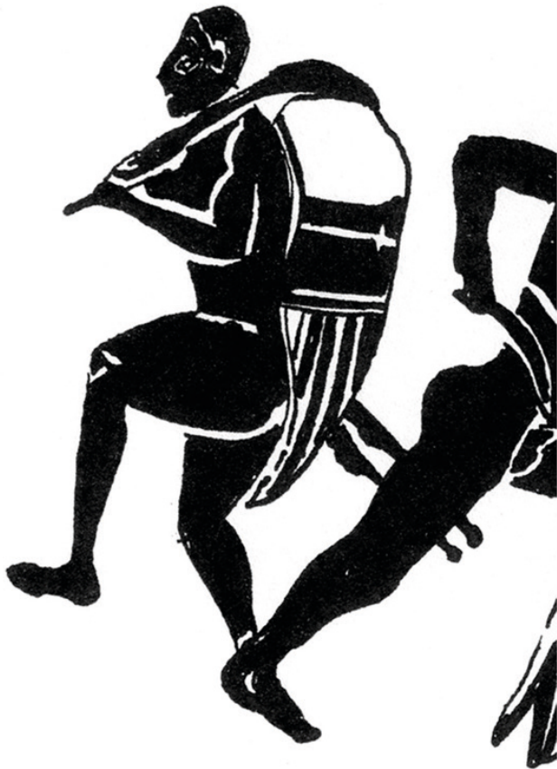
Fig. 9. Le « géranophore » : détail de l'hydrie du Louvre. (pygmée n° 1 de la fig. 3, dessin de l'auteure).

Or, il y a une cohérence à développer les hypothèses défendues jusqu'ici si elles sont rapprochées d'un autre constat : la présence continue dans les géranomachies archaïques d'un écart par rapport à une norme.