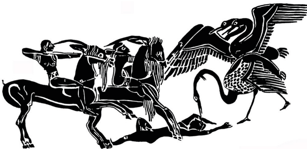
Fig. 8. Géranomachie, vase François (Florence, Musée archéologique, Inv. 4209). Détail du pied du vase. Dessin de l'auteur d'après LIMC, VII, 2, n° 1a, p. 466.

L'image offre alors à notre regard une grande liberté par rapport aux récits narratifs : ainsi, chez Homère, l'issue du combat débouche sur la défaite des pygmées ; il n'y est jamais question de victoire. L'hydrie du Louvre quant à elle, en introduisant un contraste entre deux classes d'âge, semble d'abord souligner la bravoure et, à terme, la victoire des plus jeunes [29]. L'expérience des plus âgés ne suffit apparemment pas