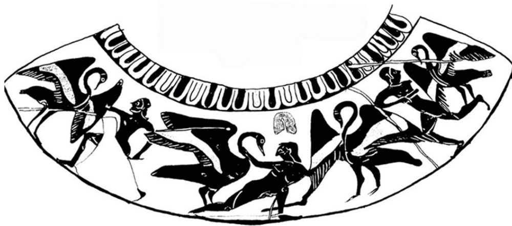
Fig. 5. Géranomachie, hydrie de la Villa Giulia, Inv. 50425. Dessin de l'auteur d'après V. DASEN, 1993, pl. 61, 1.

(ou autrement ?) un commentaire (déjà parodique ?) de la géranomachie – les pygmées combattant les grues pourraient se comprendre comme des figures paradigmatiques d'une éducation : celle relative aux jeunes gens sollicités pour donner les preuves cynégétiques de leur virilité, un type d'épreuve que la communauté civique grecque archaïque attend de ses futurs membres. D'autant que l'association de la géranomachie à la chasse de Calydon pourrait, en fait, faire sens avec le thème nuptial [17]. Ainsi, à travers nos pygmées, ce sont vraisemblablement les jeunes gens qui pourraient être mis en valeur ce que relève par ailleurs l'exploit physique suggéré par la scène et la représentation idéalisée des corps.