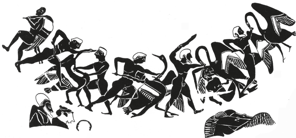
Fig. 1. Géranomachie, hydrie du Louvre, Inv. F 44 : épaule du vase. Dessin de l'auteur d'après LIMC VII, 2, pl. 3.