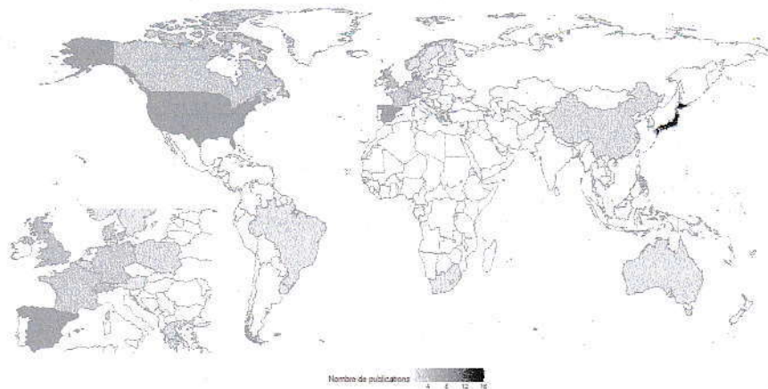
Figure 1. Carte des lieux de mesures de SDHI dans l'eau.

La quantification des SDHI rapportée dans la littérature académique ont permis de décrire les gammes de concentration en SDHI dans les eaux de surface (Figure 2) et dans les matrices alimentaires. A l'échelle mondiale ces vingt dernières années, 5 SDHI ont été quantifiés dans les eaux de surface à des teneurs allant du \text{pg.mL}^{-1} d'eau (ou ppt) au \mu\text{g.mL}^{-1} d'eau (ou ppm). D'autre part, d'un point de vue sanitaire, plus de la moitié de ces eaux de surface seraient impropres à la consommation d'après la législation française, avec des concentrations en SDHI supérieure à la limite de référence de qualités des eaux destinées à la consommation humaine de 0,1 \mu\text{g.L}^{-1} pour chaque pesticide.