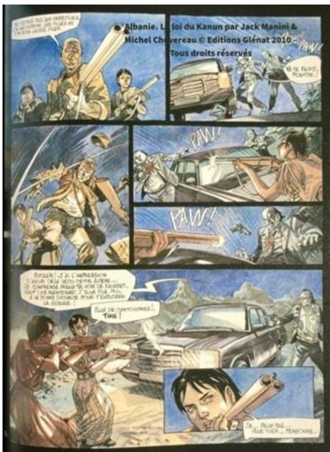
Fig. 6. Une embuscade