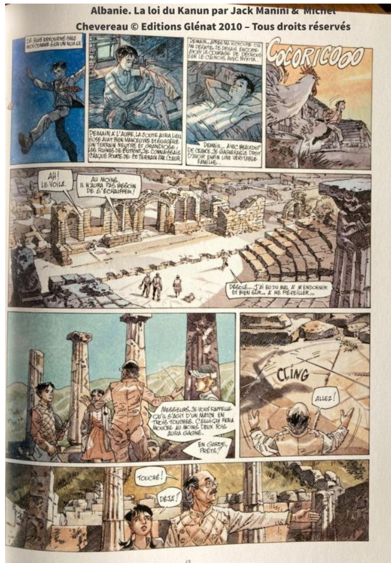
Fig. 1. Butrint

entre autres dans l' Énéide de Virgile, est l'un des éléments qui ont toujours attiré les voyageurs en Albanie. Ci-dessous, l'un des tableaux montrant les ruines de la ville 15 .