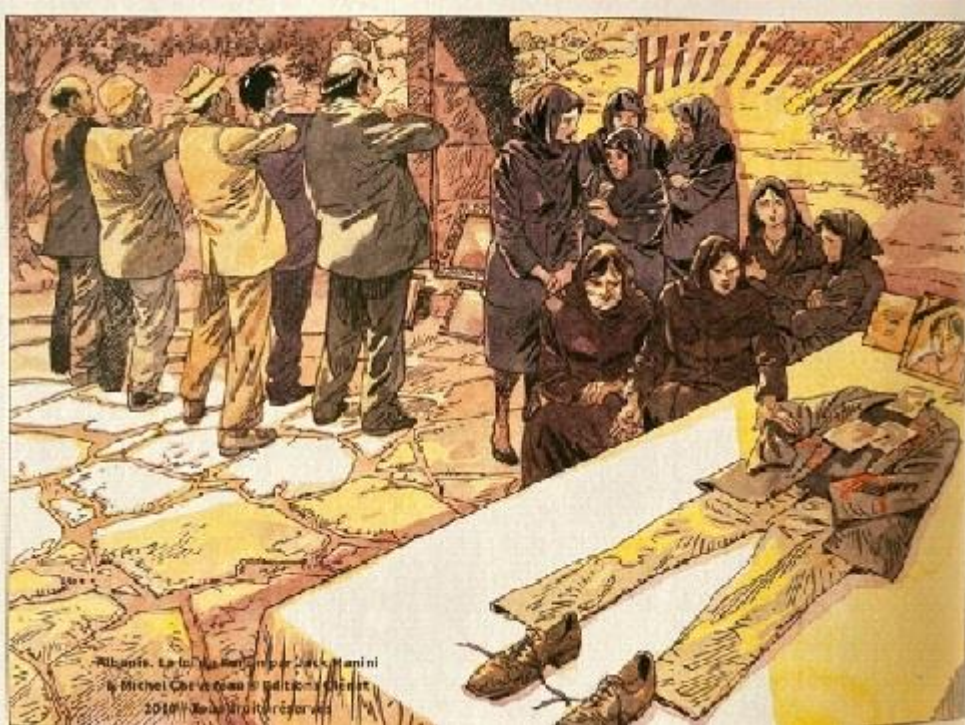
Fig. 4. Scène de deuil funéraire

L'image suivante montre une chemise ensanglantée, accrochée aux fenêtres d'une maison touchée par le gjakmarrja : comme le veut la tradition, lorsque les taches commenceront à jaunir, il sera temps que le sang du défunt (qui portait cette chemise lorsqu'il fut tué) soit racheté par le sang du tueur 18 .