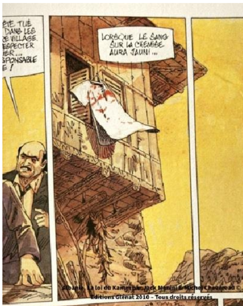
Fig. 5. Chemise ensanglantée

Parmi les stéréotypes qui marquent l'image de l'Albanie figure celui du crime organisé : présent comme leitmotiv de la structure narrative, il est évoqué dans des images à fort impact visuel, comme dans le tableau suivant 19 .