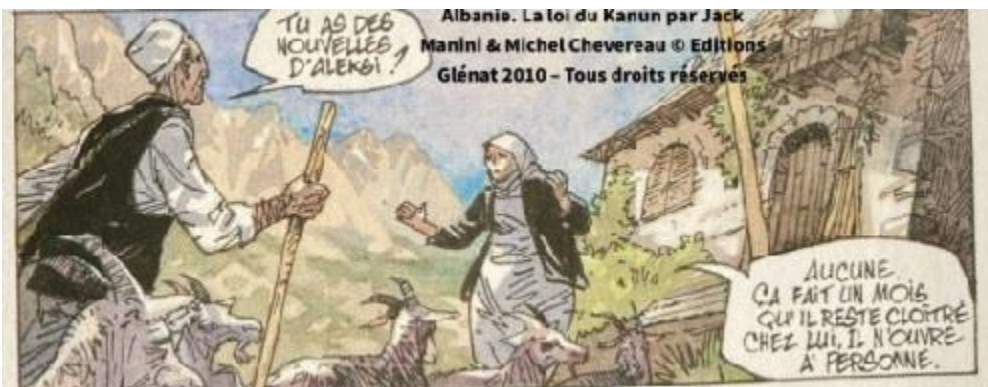
Fig. 3. Homme portant la qeleshe

En ce qui concerne les marqueurs ethno-anthropologiques, voyons ces illustrations représentant, respectivement, la qeleshe (la calotte typique portée par les Albanais les plus traditionalistes), ainsi qu'une scène de deuil funéraire, où des femmes accomplissent le rituel des pleureuses entonnant des lamentations autour du défunt 17 .