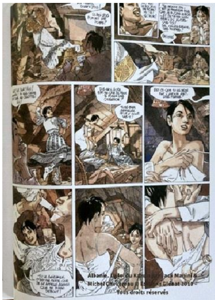
Fig. 8. Scène d'amour saphique

noter que les études ethno-anthropologiques sur la « masculinisation » de la vierge jurée albanaise n'ont généralement pas détecté de caractéristiques homosexuelles.