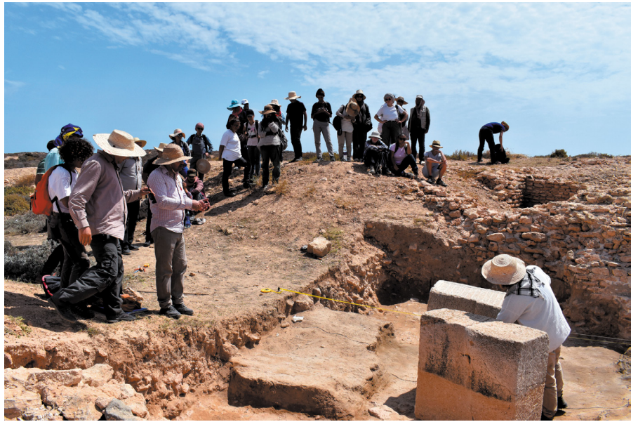
Fig. 3 : Thaenae . Présentation des résultats par les étudiants.