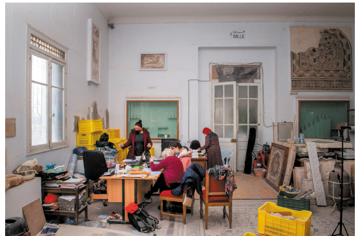
Fig. 4 : Musée de Sfax. Étude des verres.

Ce dossier a pour but de livrer les premiers résultats obtenus dans le cadre de ce chantier-école. Les trois contributions qui suivent montrent que l'équipe est restée fidèle au triple objectif de formation-recherche-valorisation qu'elle s'était fixé au démarrage du projet.