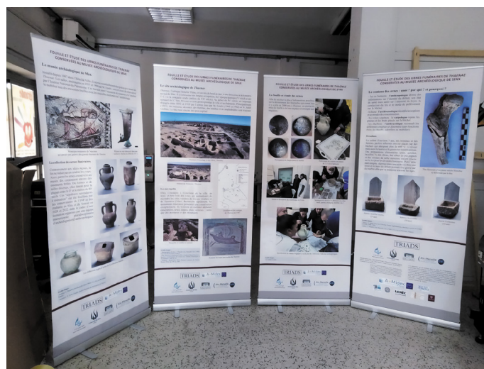
Fig. 7 : Valorisation des recherches menées sur le mobilier funéraire conservé au musée archéologique de Sfax sous forme de posters.

tunisiens et français, qui ont eu en effet l'opportunité d'apprendre les méthodes de documentation de terrain au contact d'un monument emblématique de Thaenae (fig. 5). Enfin, le nettoyage dont il a fait l'objet en 2022 sur plus de 50 m est un prélude à la mise en valeur de l'ensemble du secteur en cours de fouille.