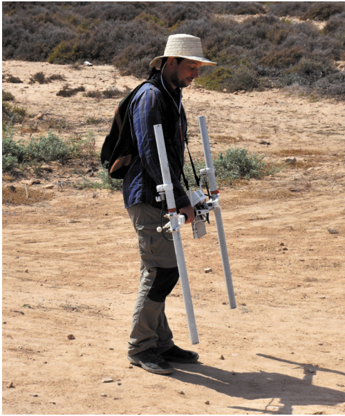
Fig. 2 : Thaenae . Prospection géophysique des ateliers d'amphores.