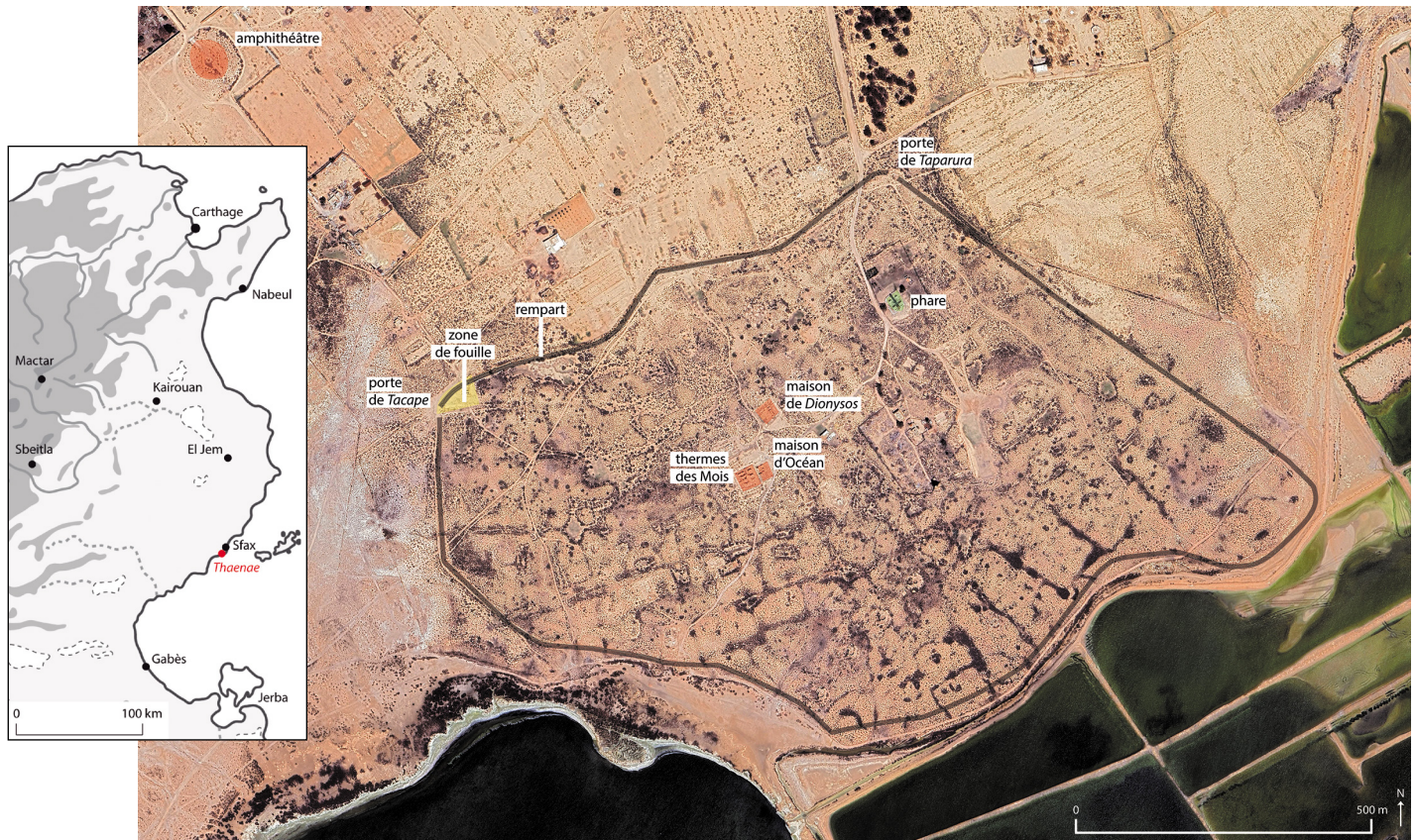
Fig. 1 : Situation et vue générale de la ville antique de Thaenae (carte Google Earth et M. Bonifay).

du musée de Sfax (monnaies, urnes, céramique, verre) : le musée conserve en effet une grande partie du matériel issu des fouilles réalisées sur le site de Thyna depuis la fin du XIX e siècle.