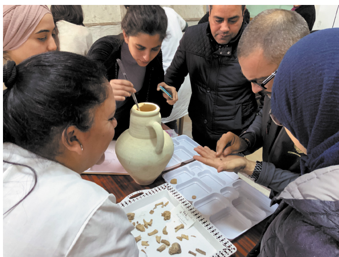
Fig. 6 : Musée de Sfax. Fouille des urnes du « mausolée Fendri ».