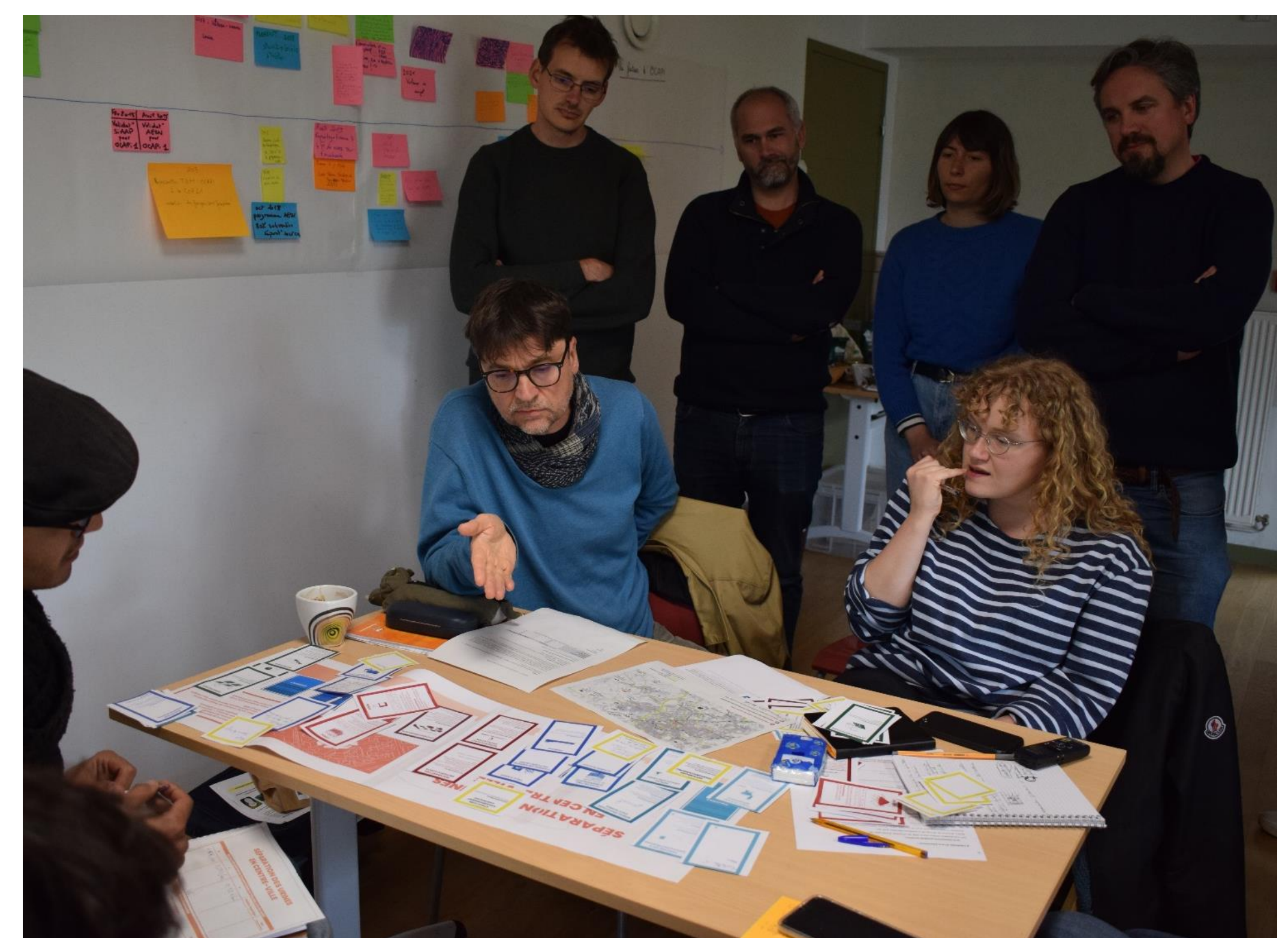
Figure 3 : Atelier « Des toilettes aux champs »