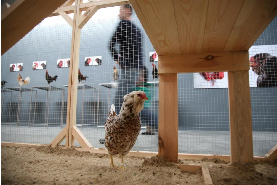
III. 8- Koen Vanmechelen, “ The Cosmopolitan Chicken Project ” "Mechelse Orloff, 13th generation" "Against Exclusions", The 3rd moscow Biennale of Contemporary Art, Moscow (RUS), 2009 courtesy; Deweer Gallery Foto; Koen Vanmechelen ©