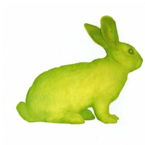
III. 2 - Eduardo Kac, GPP Bunny Lapine transgénique fabriquée dans les laboratoires de l'INRA à Jouy en Josas pour le festival Avignonnumérique, 2000.