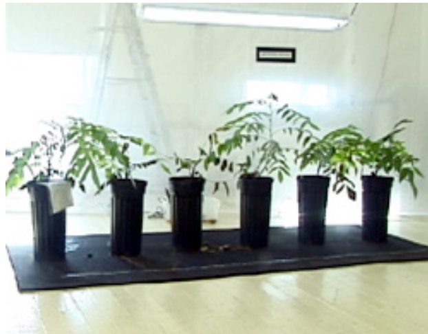
III. 4 - Natalie Jeremijenko, Clones de Paradox en milieu stérile, nov. 1998-janv. 1999. Yerba Buena Center for Art San Francisco, USA. Clones de Paradox , Galerie Exit Art , sept.-oct. 2000. New York, USA.