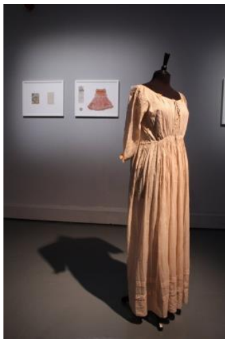
Ill. 3 Anna Dumitriu, The Romantic Disease Dress , 2014 Watermans Art Center , Londres

Aux côtés de ces petits objets fragiles, « devenus des reliques de l'expérience de la contamination » 20 est exposée une robe, The Romantic Disease Dress (Ill. 3) Cette robe est teintée naturellement avec des écorces de noix. L'écorce de noix était autrefois considérée comme un antibactérien et utilisée pour soigner la tuberculose. Le vêtement est décoré de fleurs et de rubans en soie imprégnés d'ADN du bacille tuberculeux. Le vêtement féminin infecté fait référence au sort que l'on réservait aux femmes enceintes tuberculeuses. Par peur d'accentuer l'épidémie, elles devaient se faire avorter car la tuberculose était considérée comme une maladie héréditaire.