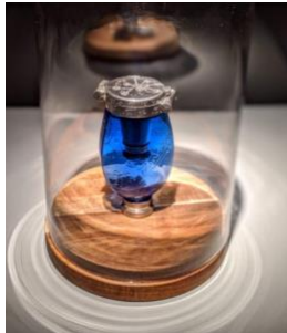
Ill. 4 Blue Henry , Crachoir antique, gravure financée par le Welcome Trust

Avant que ne soit découvert l'antibiotique qui allait éradiquer la tuberculose 23 , l'appareil permettait à l'aide d'une sonde d'apporter de l'oxygène dans la cavité pleurale du poumon infecté par la tuberculose afin de pallier à son affaissement causé par l'infection. 24 Aujourd'hui les appareils médicaux de ventilation assistée, les précieux respirateurs artificiels destinés aux malades de la Covid présentant une détresse respiratoire sont tout aussi emblématiques que cette antique machine qui permit de sauver des vies.