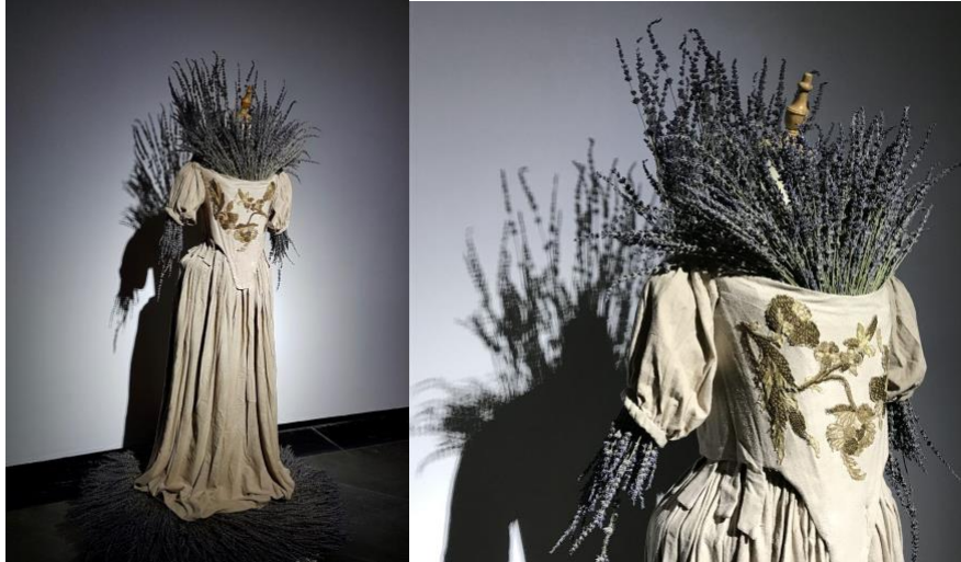
Ill.1 Anna Dumitriu, "Plague Dress" vues de l'installation à la 6ème triennale de Guangzhou. Musée d'Art de Guangdong (Chine) du 21 décembre 2018 au 10 mars 2019

La partie la moins visible et la plus technoscientifique de la robe de la peste se trouve sur les broderies qui ont été imprégnées d'ADN extrait de la bactérie Yersinia pestis (Peste). La souche de la bactérie « tueuse » neutralisée avant l'exposition a été génétiquement modifiée par l'artiste à partir de la méthode CRISPR. Cette souche pathogène provient du laboratoire de la collection de ressources microbiennes ( National Collection of Type Cultures ) de la Santé publique anglaise. 15