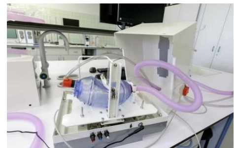
Un ventilateur contemporain

La matière de la boîte contenant l'appareil évoque la texture alvéolaire du tissu pulmonaire. La gravure sur le métal du piston représente un frottis d'expectoration positif réalisé à l'aide une méthode de coloration permettant l'identification des mycobactéries au microscope. 25 « Ce test de diagnostic rapide peut être utilisé pour diagnostiquer les patients atteints de tuberculose pulmonaire active. La bactérie se colore en rouge sur un fond de bleu de méthylène et peut donner l'apparence de rubans rouges dispersés » explique Anna Dumitriu. 26