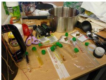
Ill. 8 Atelier textile-matériel de laboratoire

L'engagement politique de l'artiste au service d'une science ouverte à tous rejoint les propos de Léo Coutellec, éthicien des sciences contemporaines : « La science doit s'ouvrir à la société, aux questionnements de la société mais pas comme celle qui va donner une réponse univoque mais comme celle qui est en recherche dans la complexité du réel, dans la voie la plus fiable. » 36