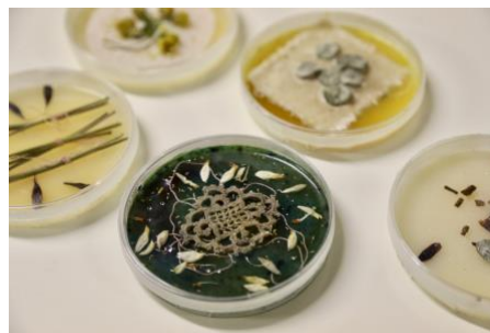
Petits carrés de coton brodés par les participants, Boîtes de Pétri, gélose chromogène