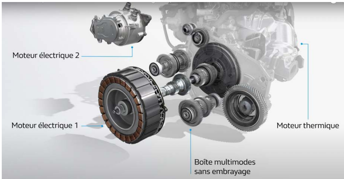
Figure 1 : Éclaté de la partie Motorisation et transmission de l'e-Tech hybride de Renault – Source : Renault.

Pour les moteurs diesel, les améliorations ont été fulgurantes : une réduction de 33 % de la consommation entre une Renault Megane de 1998 à moteur diesel turbo et à injection indirecte mécanique et la Megane 3 de 2009, à injection directe, et en dépit d'un poids plus important (plus lourde de 140 kg). Des gains plus conséquents ont encore été constatés si l'on compare la Golf 2 GTD de 1984, avec son moteur diesel de 1,6 l turbo à injection mécanique qui développait 51 kW et 130 N.m et consommait 5,7 l/100 km en mode combiné, avec une Polo V 1,2 TDI de 2010, qui pesait, malgré tout, 210 kg de plus, mais affichait une consommation inférieure de 40 % grâce à son moteur turbo diesel à injection électronique et à une rampe d'alimentation à très haute pression ( common rail ) 1 .