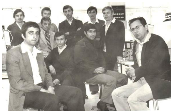
ICPE filiala Iași, ani de debut în corpul clădirii Energetică

În anul 1970 a organizat Filiala Institutului de documentare tehnică din România (IDT), desființată după Revoluția din 1990.