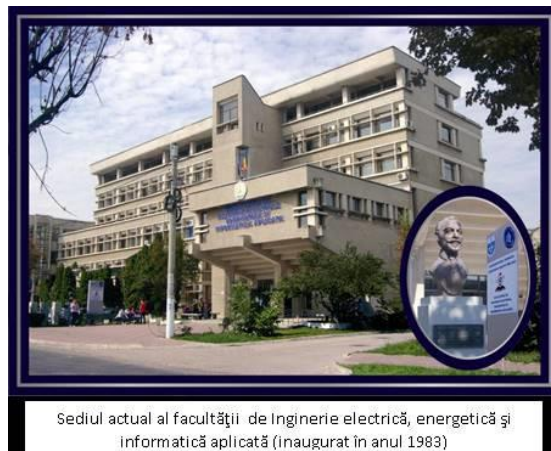
Sediul actual al facultății de Inginerie electrică, energetică și Informatică aplicată (inaugurat în anul 1983)

Secțiile de specializare menționate mai sus au funcționat până în anul 1951 când activitatea lor a fost transferată în alte centre universitare: Centrale, transport