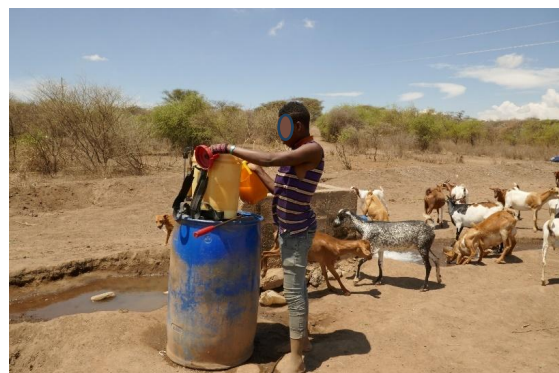
Image 2 : Ouvrier agricole de Karatu préparant la mixture destinée à l'épandage. Adrien Morvan, 2021, Karatu

Ce travail a été réalisé dans le cadre du projet PREHEAT (Pesticides Related Health Effects with a focus on Tanzania) financé par l'agence française du développement (AFD). Ce projet pluridisciplinaire ayant pour but d'interroger l'utilisation et la communication autour des pesticides en Tanzanie et au Burkina Faso. Le travail de terrain présenté s'est étendu sur 6 mois entre septembre 2021 et février 2022. Ce travail, fondé sur une méthodologie d'enquête ethnographique, mobilise près de 70 entretiens et de nombreuses heures d'observation participantes. En outre, l'apport de la photographie a été non négligeable. En effet, elle nous a permis de saisir les acteurs dans leurs socioécosystèmes, illustrant par là leurs pratiques des corps, leurs équipements, leurs postures, mais aussi leurs interactions (image 2).