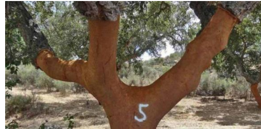
Fig. 1 : chêne-liège portant le marquage « 5 » - le dernier décapage a été effectué en 2015.

Le liège provient du chêne-liège, plus précisément de son écorce. Le rythme de production du liège est régulier et bien connu : 25 ans avant la première récolte, et la récolte (par décapage) ne peut avoir lieu que tous les 9 ans. Ensuite, chaque chêne-liège est marqué d'un numéro correspondant à l'année où il a été écorcé (ex. : Fig. 1).