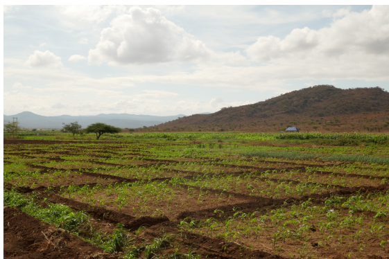
Image 3 : Champ d'oignons de Karatu, on y voit la disposition en carré avec les rangs qui permettent le passage des ouvriers et des agriculteurs. Adrien Morvan, Karatu, 2021

À l'écart de leur manager, les ouvriers se sont confiés sur leur précarité et leurs difficiles conditions de travail. Dans un contexte de fortes tensions sociales et économiques, les équipements n'étaient ni fournis par l'employeur ni accessibles par les ouvriers.