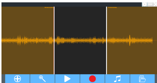
FIGURE 1 – L'écran d'accueil de TètKole après chargement du fichier son à interpréter

Cette approche centrée sur l'interaction visuelle et l'ergonomie vise à simplifier le processus d'interprétation, offrant aux linguistes un moyen intuitif et efficace pour traiter les enregistrements et produire des interprétations orales. La combinaison de la sélection visuelle et de la création rapide de fichiers son facilite le flux de travail des linguistes, favorisant ainsi une utilisation efficace de l'outil TètKole dans le cadre du projet CREAM.