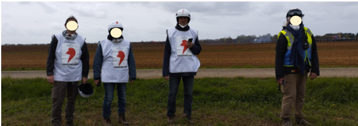
Quatre des cinq membres de l'équipe mixte Poitou-Charentes / Toulouse prêts pour l'observation.