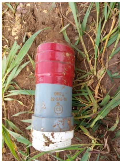
Une grenade GM2L non explosée au sol avec son adhésif rouge