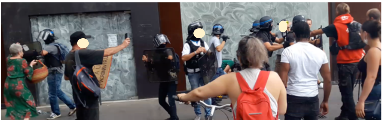
Les policier-es sous les protestations des manifestant-es. A gauche, une passante se prend un coup de bouclier

Sauf que cela ne se passe pas tout seul car les personnes présentes protestent vivement contre cette arrestation. Et ses collègues de la BST et des CDI arrivent à la rescousse. Les BST et les CDI refluent sous la pression et quelques projectiles sont lancés.