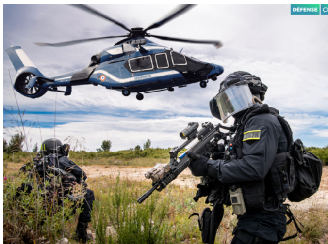
Les hélicoptères destinés au maintien de l'ordre

L'image de gauche est celle des nouveaux blindés de la gendarmerie, appelés Centaure, dont celle-ci est progressivement dotée. Les caractéristiques d'armement de ces blindés sont bien décrites dans cette infographie publiée par le média en ligne « Contre attaque ». Leur présentation à la presse ce 19 octobre 2023 57 est suffisamment parlante pour que nous ne détaillons pas plus avant ce matériel de guerre (sociale ?).