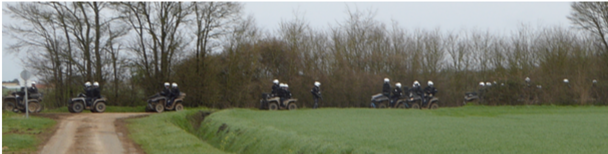
Les quads de retour vers le dispositif bassines après premiers grenadages

« 12h40 - Les observateur-es photographient les quads (sans doute ceux déjà photographiés quelques minutes auparavant), une vingtaine, au fond du chemin sur lequel ils cheminent. Les quads reviennent du lieu où, à distance, les observateur-es ont constaté, à 12h36, un nuage de gaz lacrymogène