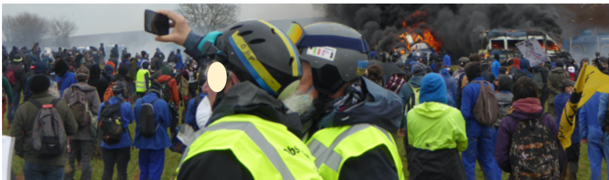
Les deux observateurs toulousains de l'équipe d'observateurs mixte « toloso-picto-charentaise » en train de faire un panoramique avec les véhicules en feu derrière