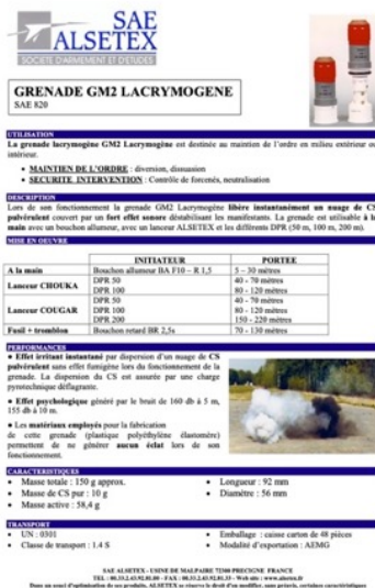
La fiche technique GM2L du fabricant SAE-Alsetex.