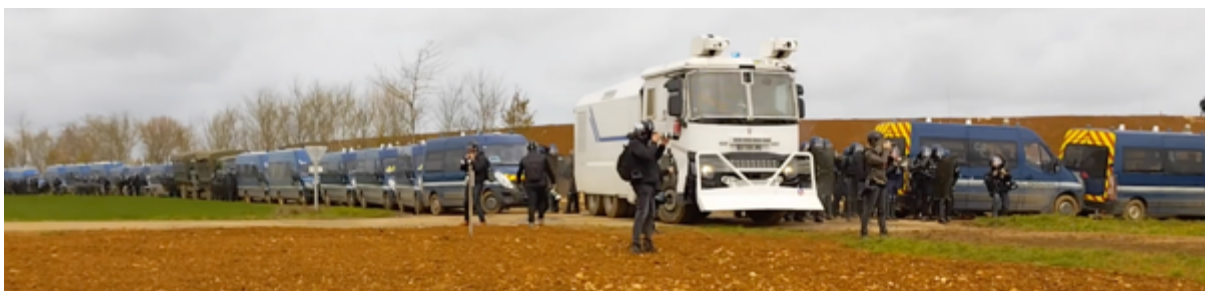
Les véhicules militaires, à touche-touche, avec en leur centre un camion à eau des CRS

Plus les observateur-es, totalement isolé-es du cortège, progressaient vers la bassine, plus iels prenaient conscience de la présence massive des militaires dont les fourgons et camions, ainsi qu'un canon à eau, étaient littéralement collés à la bassine, les uns à côté des autres avec un petit espace entre eux dans lequel on pouvait apercevoir des gendarmes mobiles équipés de « pied en cap » (casques, boucliers, masques à gaz, lanceurs Cougar et LBD). Et derrière eux et elles, la bassine avec ses monticules de plusieurs mètres de haut.