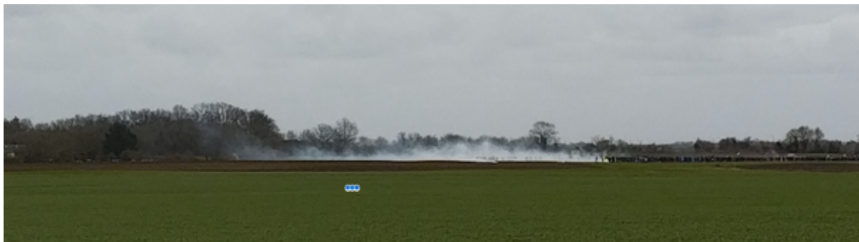
12h36 - Premiers tirs de grenades – A gauche de l'image, on devine les quads de la gendarmerie

« 12h36 - On aperçoit les premiers nuages de gaz lacrymogène mais au niveau de ce qui semble être la queue du cortège et d'où semble partir un second cortège