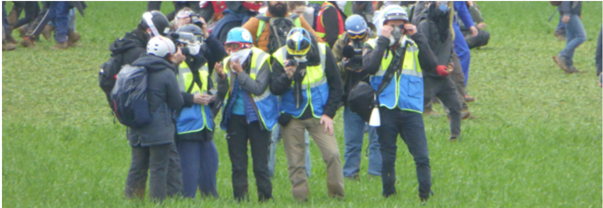
Les observateur-es toulousain-es du groupe OPP 2 échantent avec les journalistes de « Complément d'enquête » qui les ont suivi-es toute la journée