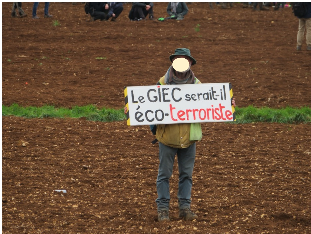
Un manifestant, le 25 mars 2023, à Sainte-Soline

On peut tout aussi bien écrire que ce samedi 25 mars 2023 montre une nouvelle étape de franchise dans la répression, dans le sang et via l'utilisation de tous les moyens militaires disponibles (à l'exception des armes de service et des fusils mitrailleurs), pour empêcher des milliers de citoyen-nés de mener une action symbolique (envahir un trou sans vie et sans âme) dans un contexte, plus général, d'urgence climatique. Le temps presse nous disent les scientifiques du GIEC. Sont-ils eux-aussi des extrémistes ?