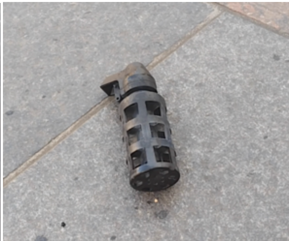
Les restes de la grenade au sol sans ses plots

Voyons maintenant, sur la base de la même vidéo, le contexte de l'utilisation de cette arme de guerre (en fait, une grenade à fragmentation).