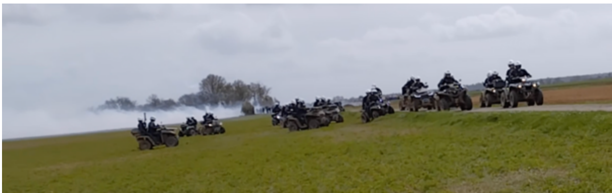
Les quads reviennent après avoir copieusement grenadé le cortège en provenance du hameau d'Asnières »

12h55 - Les quads reviennent vers la bassine et se remettent en position sur la petite route. Ils remontent vers la bassine à toute allure. Certains équipages ne sont pas complets, un seul gendarme dessus. Plusieurs aller-retours (4 ?) des quads qui se rapprochent à chaque fois des manifestant-es qui avancent dans le champ avec des tirs de grenades lacrymo. A chaque retour, les observateur-es constatent que les « quadistes » sont très joyeux, paraissent s'amuser de ces charges à grande vitesse.