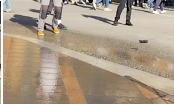
Ce qui reste de la grenade poursuit sa « course folle »