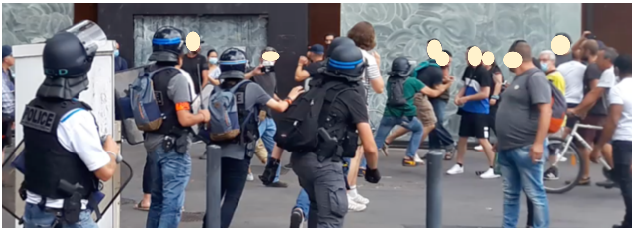
Un policier des BST interpelle une personne sur le trottoir

« Et, là, à 18h04 les policier-es, avec quelques gendarmes en renfort, utilisent la manière forte. Les BST, qui étaient en embuscade, interviennent, interpellent une personne et commencent à se replier. Malgré la réaction de leurs collègues qui leur demandent de se replier (« oh, les gars, faut se replier là » entend-on sur la bande son de la vidéo de l'OPP), un policier suivi par certains de ses collègues de la BST décide d'aller plus avant et traverse les personnes rassemblées pour procéder à une nouvelle interpellation au milieu des manifestant-es.