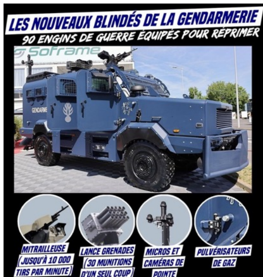
Les nouveaux blindés de la gendarmerie

Les deux images ci-dessous illustrent la fuite en avant dans la militarisation du maintien de l'ordre en France.