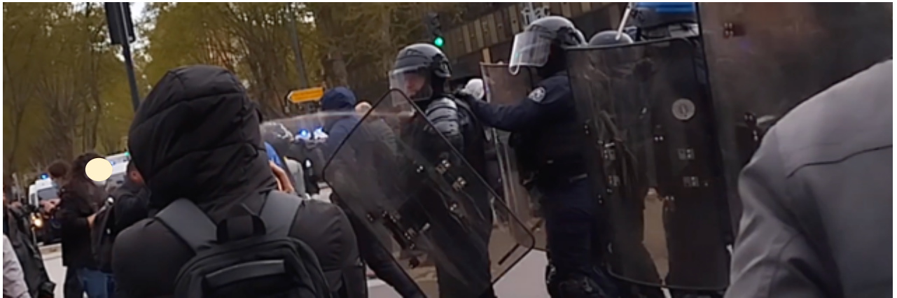
Au centre de l'image, on voit clairement le jet d'une gazeuse à main (la trace blanche au centre de l'image)