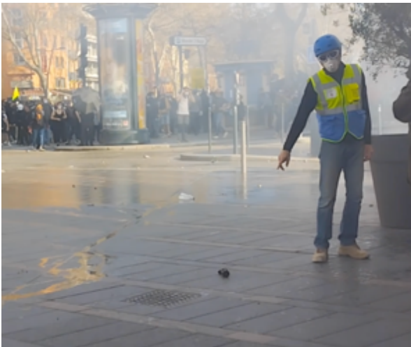
Un observateur montre ce qui reste de la grenade au sol. Les restes de la grenade au sol sans ses plots