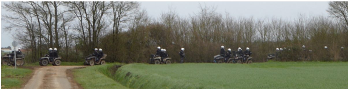
Les quads de retour vers le dispositif bassines après premiers grenadages

« 12h40 - Les observateur-es photographient les quads (sans doute ceux déjà photographiés quelques minutes auparavant), une vingtaine, au fond du chemin sur lequel ils cheminent. Les quads reviennent du lieu où, à distance, les observateur-es ont constaté, à 12h36, un nuage de gaz lacrymogène