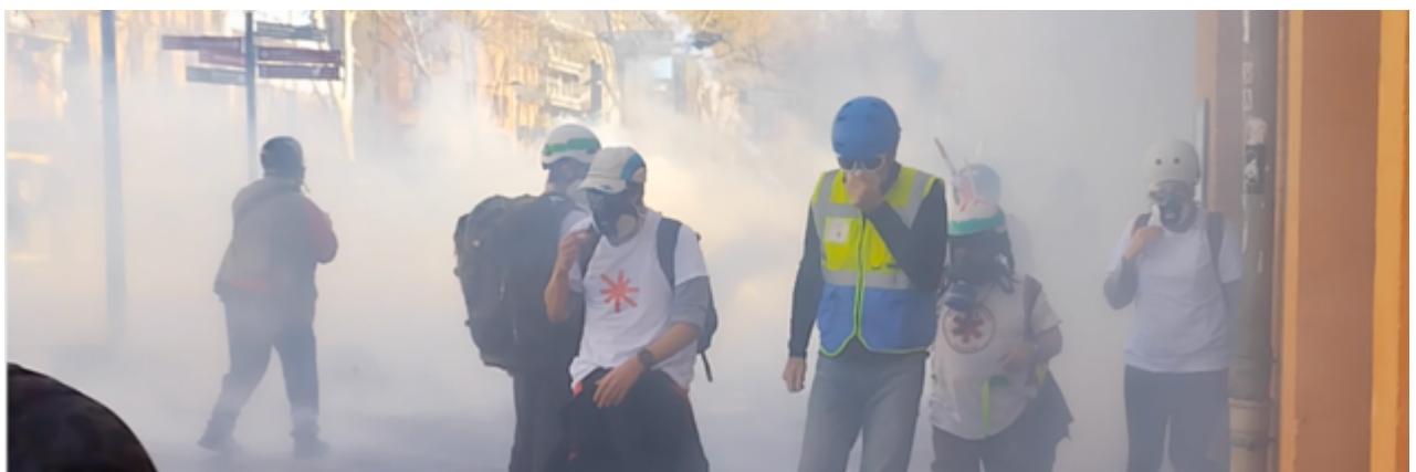
Face à la forte concentration de gaz lacrymogène, les observateurs et secouristes volontaires se replient

A 17h30 , le canon à eau entre en action. Puis les gendarmes procèdent au tir de nombreuses grenades lacrymogènes.