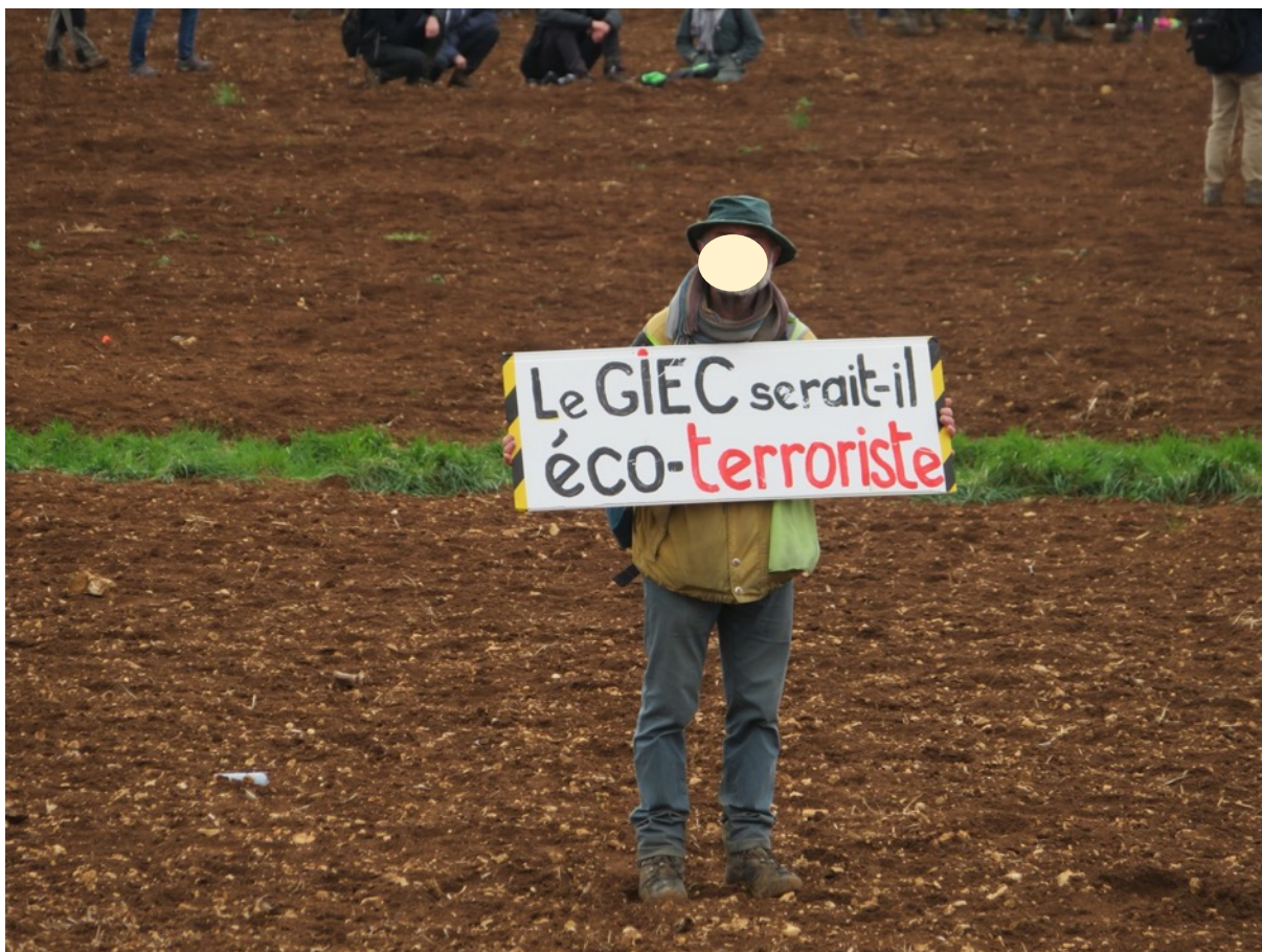
Un manifestant, le 25 mars 2023, à Sainte-Soline

On peut tout aussi bien écrire que ce samedi 25 mars 2023 montre une nouvelle étape de franchise dans la répression, dans le sang et via l'utilisation de tous les moyens militaires disponibles (à l'exception des armes de service et des fusils mitrailleurs), pour empêcher des milliers de citoyen-nés de mener une action symbolique (envahir un trou sans vie et sans âme) dans un contexte, plus général, d'urgence climatique. Le temps presse nous disent les scientifiques du GIEC. Sont-ils eux-aussi des extrémistes ?