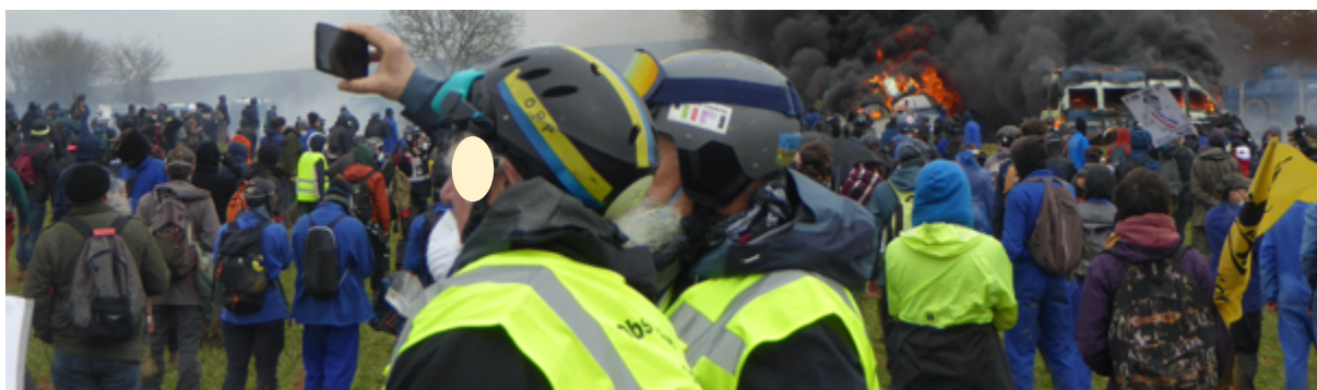
Les deux observateurs toulousains de l'équipe d'observateurs mixte « toloso-picto-charentaise » en train de faire un panoramique avec les véhicules en feu derrière