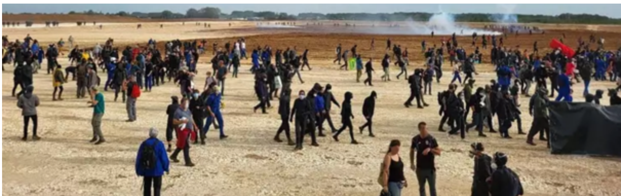
Les militants dans la bassine de Sainte-Soline en octobre 2022

Donc, le 29 octobre 2022, des milliers de personnes, très diverses dans leurs pratiques militantes mais rassemblées autour d'un objectif commun (l'arrêt de la mise en œuvre des projets de mégabassines), avaient mené une action très déterminée qui leur avait permis, malgré la présence massive des gendarmes, d'atteindre le site de construction de la bassine de Sainte-Soline et d'en prendre symboliquement possession durant quelques minutes avant de refluer « en bon ordre ».