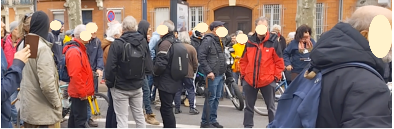
Des manifestant-es « saoulé-es » par des sommations réitérées...