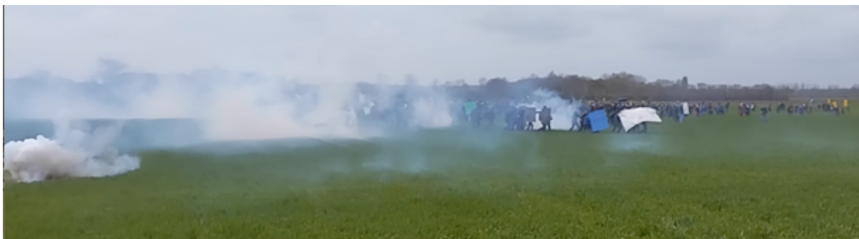
Premières grenades explosives lancées sur les manifestant-es ; on devine les nuages des explosions au milieu des manifestant-es ; à gauche de l'image, on voit clairement une grenade exploser à une vingtaine de mètres des observateur-es

A 13h12 , la bande son d'une vidéo des observateur-es permet d'entendre 21 explosions de grenades GM2L (un bruit sourd et puissant, largement reconnaissable) en 48 secondes, soit une grenade explosive toutes les 2,3 secondes... Si on ajoute le bruit des grenades lacrymogène (un bruit sec, lui aussi très reconnaissable), c'est une grenade à la seconde qui est lancée à ce moment-là. »