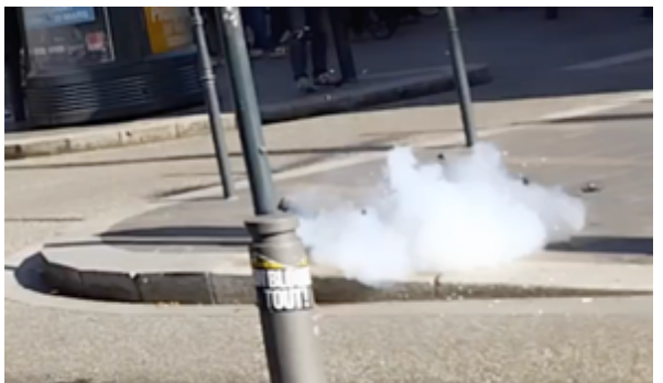
La grenade explose en projetant ses plots