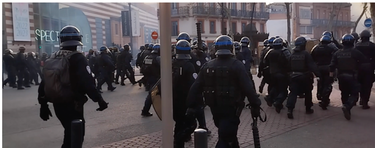
Les policier-es des CDI, non spécialisés dans le maintien de l'ordre, déployés en nombre lors de la manifestation du 28 mars 2023