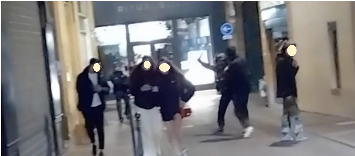
21h43 – Rue du Rem Villeneuve – Un policier des CDI, « hors de contrôle », matraque une personne – Extrait Vidéo OPP

Les observateurs ont pu, de nouveau, constater le manque de professionnalisme des policiers des CDI qui ont la matraque facile et l’insulte à la bouche en permanence comme le montre la vidéo jointe prise à 21h43. « Petit sac à merde » dit un policier « hors de contrôle » à une personne après l’avoir matraquée « sans raison ».