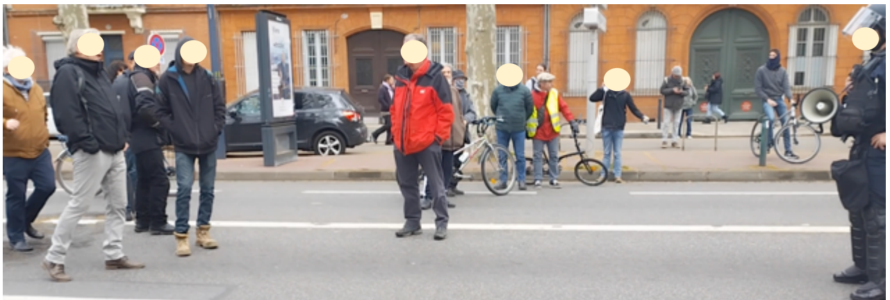
11h18 - Face à face entre les « blacks vioques » et l'OPJ avec son mégaphone...

La manifestation progresse sur le boulevard au rythme des sommations de l'OPJ... »