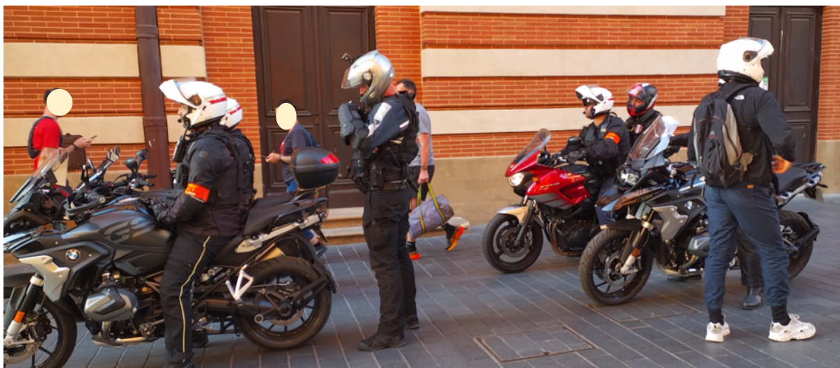
Des policiers motorisés à Toulouse le 30 juin 2023

Il semble que la possibilité de déploiement, à Toulouse, d'une unité de ce type soit de nouveau d'actualité 25 . En effet, le 30 juin 2023, les observateurs ont pu constater la présence de plusieurs équipages de ce type aux abords du rassemblement de protestation contre la mort de Nahel, tué par des policiers lors d'un contrôle routier en région parisienne.