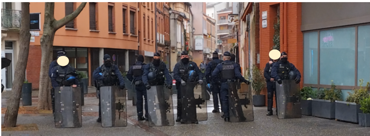
Le groupe de CSI positionné à Arnaud Bernard, le 11 mars à 10h29 – On remarquera au passage que la moitié d'entre eux sont cagoulés ou bien portent un passe montagne relevé... Anonymisation, toujours.

* Le terme outrage n'a pas été compris sur le moment par les observateur-es. C'est lors d'une rencontre fortuite, quelques jours après, qu'une connaissance de l'observateur lui a indiqué qu'il était présent sur place et qu'il avait clairement vu la scène et entendu l'interpellation verbale des policier-es. »