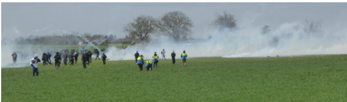
Au centre, les observateur-es toulousain-es en collecte sur fond de grenadages...