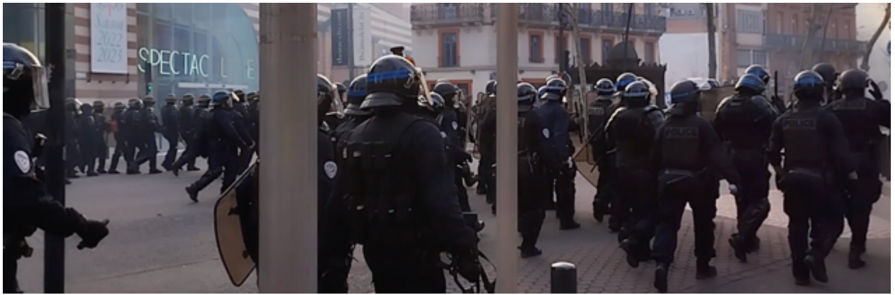
Un nombre impressionnant de policiers (CDI et CRS) à la manœuvre sur le bd Carnot au niveau du théâtre de la Cité