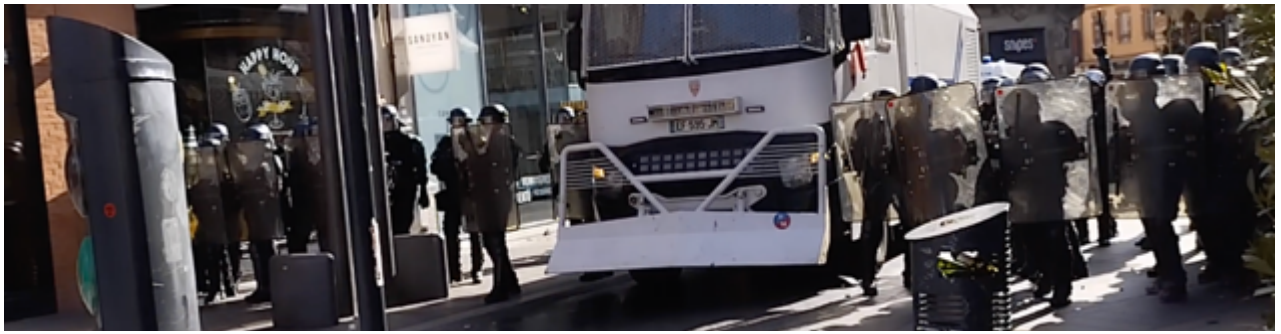
Les gendarmes mobiles au moment où ils reçoivent le projectile. Ils sont casqués et protégés par leurs boucliers