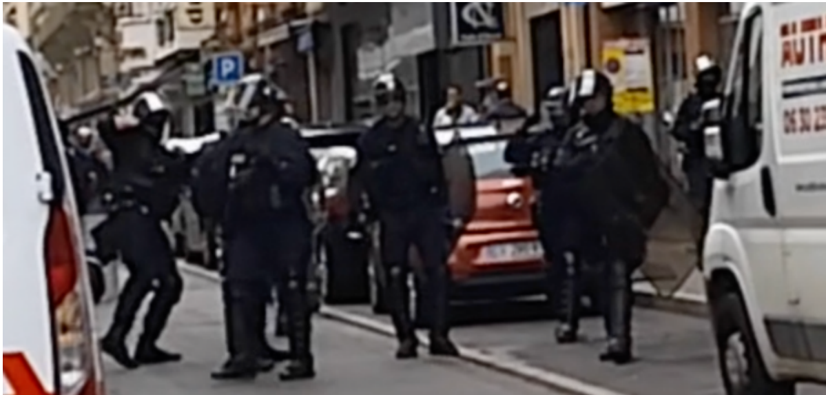
6 juin 2023 – 12h21 – Rue du Rempart Matabiau – A gauche, un policier des CDI effectuant un « pas de danse » lors d'une prise de vue de l'OPP (image extraite d'une vidéo)