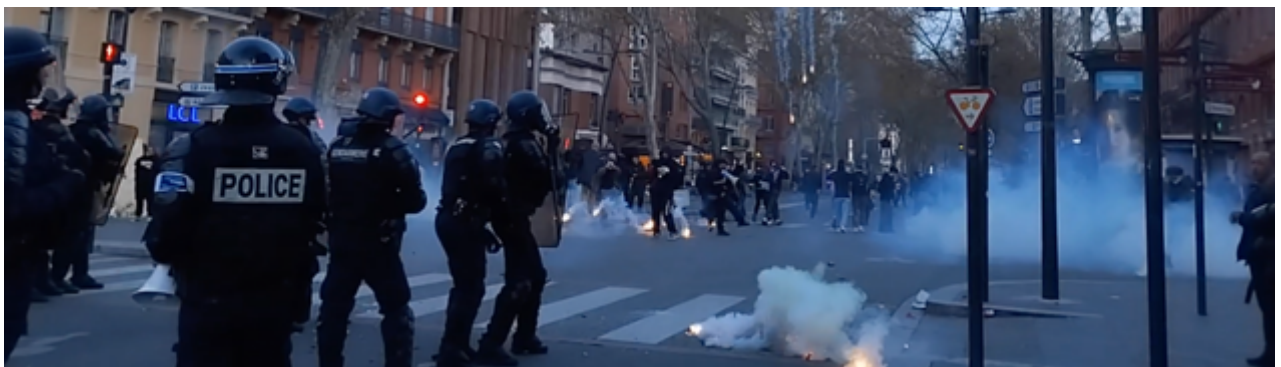
Lancers de grenades à la main et au Cougar

Après un temps de latence, les policiers procèdent à des lancers manuels de grenades lacrymogène en les roulant au sol pendant que d'autres grenades arrivent au-dessus par derrière et lancées, elles, au Cougar