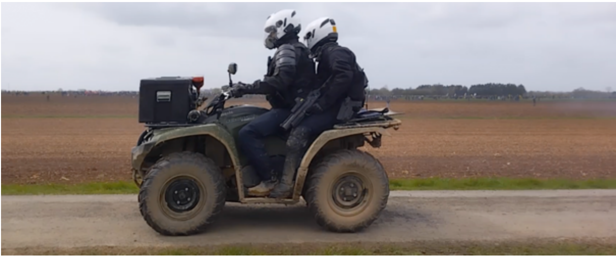
Les gendarmes en binôme sur les quads – Le passager est équipé d'un LBD

Plus les observateur-es, totalement isolé-es du cortège, progressaient vers la bassine, plus iels prenaient conscience de la présence massive des militaires dont les fourgons et camions, ainsi qu'un canon à eau, étaient littéralement collés à la bassine, les uns à côté des autres avec un petit espace entre eux dans lequel on pouvait apercevoir des gendarmes mobiles équipés de « pied en cap » (casques, boucliers, masques à gaz, lanceurs Cougar et LBD). Et derrière eux et elles, la bassine avec ses monticules de plusieurs mètres de haut.