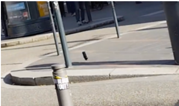
Puis, revient en arrière en tournoyant sur elle-même