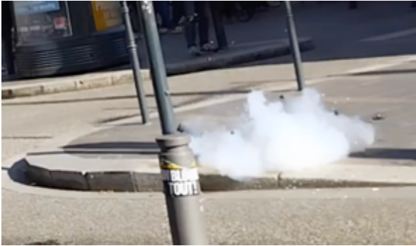
La grenade explose en projetant ses plots