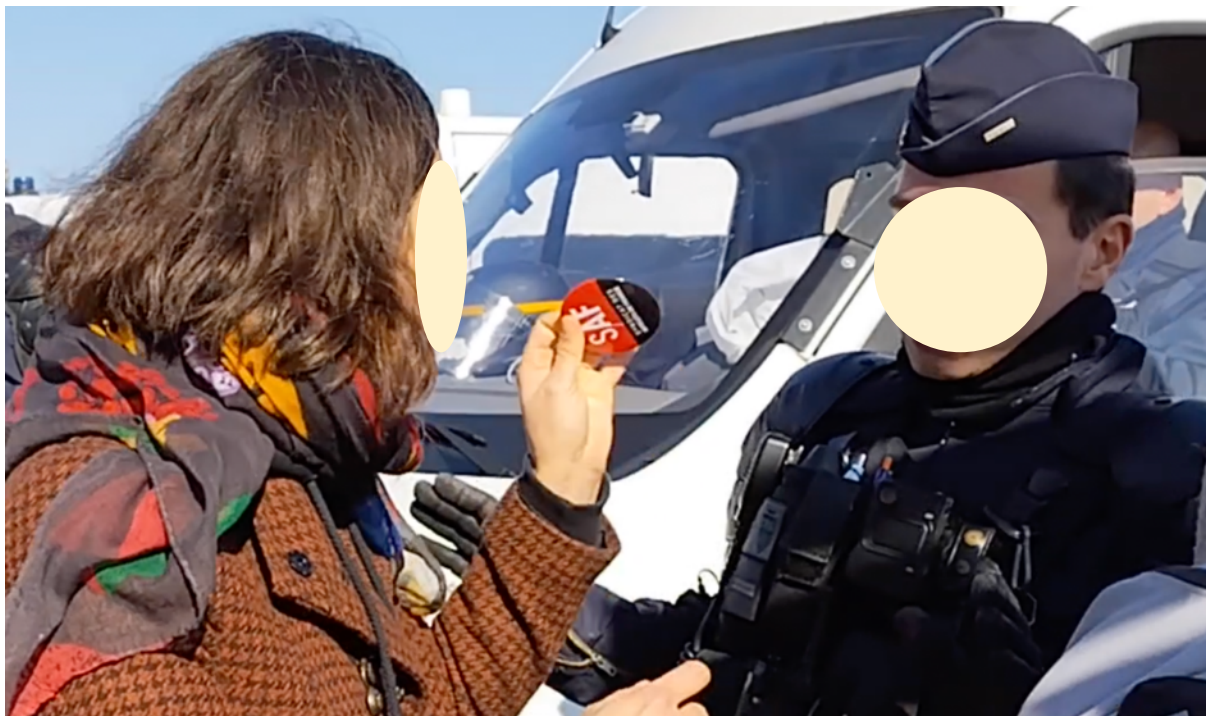
Une manifestante obligée d'enlever un badge syndical...