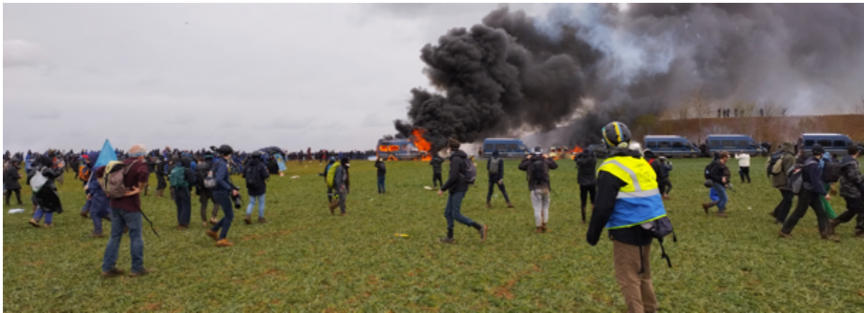
Un observateur toulousain en position