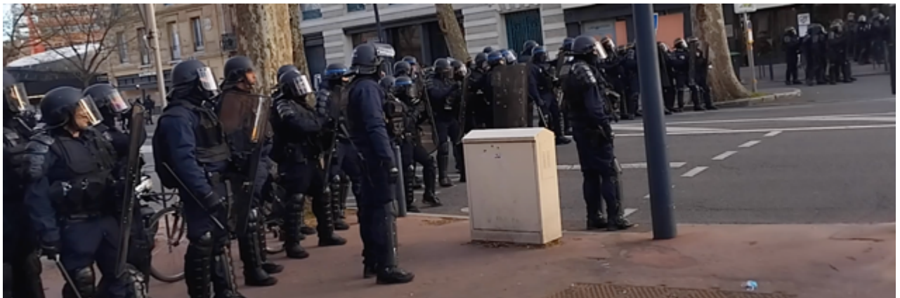
Un imposant dispositif policier entre Saint-Georges et Jean Jaurès. Et derrière les policiers arrivent encore par dizaines en courant

A 19h29 , les observateurs sont positionnés sur le boulevard Carnot où un important dispositif de CRS et de CDI (au moins une soixantaine) est en place.