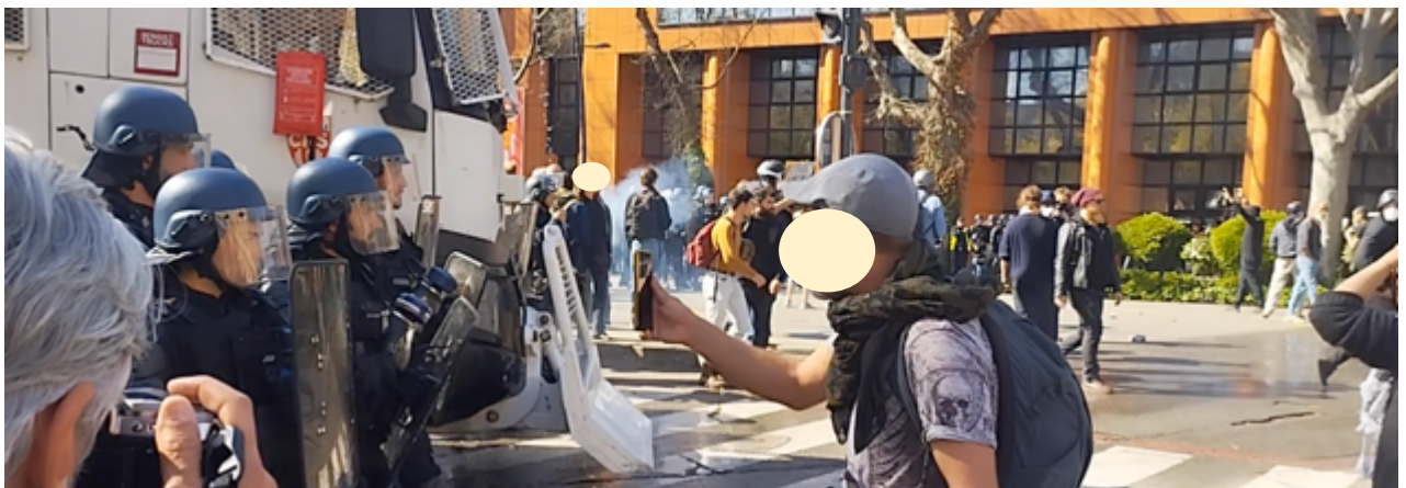
Les gendarmes prennent position. Derrière le camion, on voit ce qui semble être les premières traces de gaz lacrymogène (ou bien un fumigène ?)