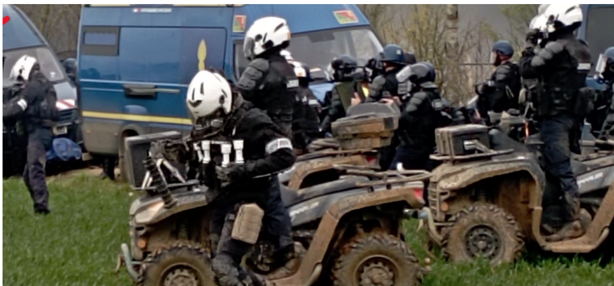
Les gendarmes du PM21 en train de préparer des grenades avec un dispositif de propulsion à retard - DPR de 200 m