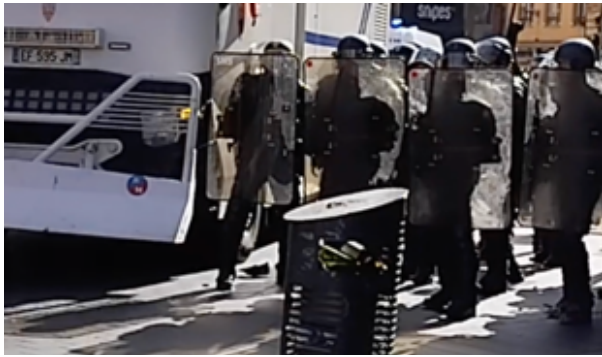
Entre les pieds de l'EGM de gauche, le projectile