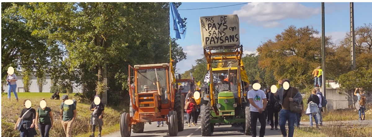
La tête du cortège le 21 octobre 2023 à Saïx

Il y a eu, ce jour-là, une forte présence policière et largement visible y compris au contact des manifestant-es. 12 observateur-es de l'OPP étaient présent-es et réparti-es en 3 équipes : deux équipes sur le terrain au niveau de la manifestation ouverte par les tracteurs de la Confédération paysanne (une équipe de 4 observateur-es précèdent le cortège et une équipe de 5 derrière celui-ci) et une équipe de deux observateurs affectés au « back office ».