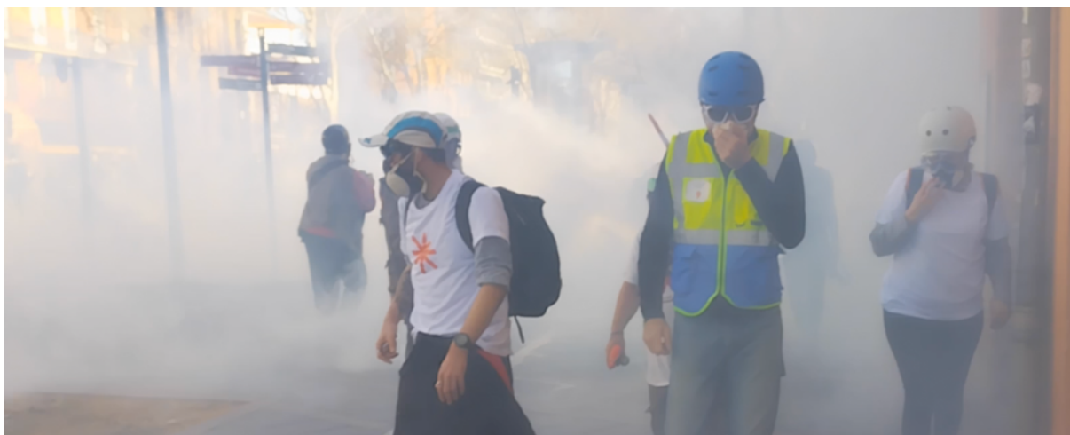
28 mars 2023 – Observateur et secouristes volontaires pris dans un nuage de gaz lacrymogène à Jeanne d’Arc

ces gaz dans certaines petites rues de Toulouse lors de manifestations, on peut considérer que leur utilisation massive constitue un danger pour les personnes prises dans les nuages très denses de gaz 26 .