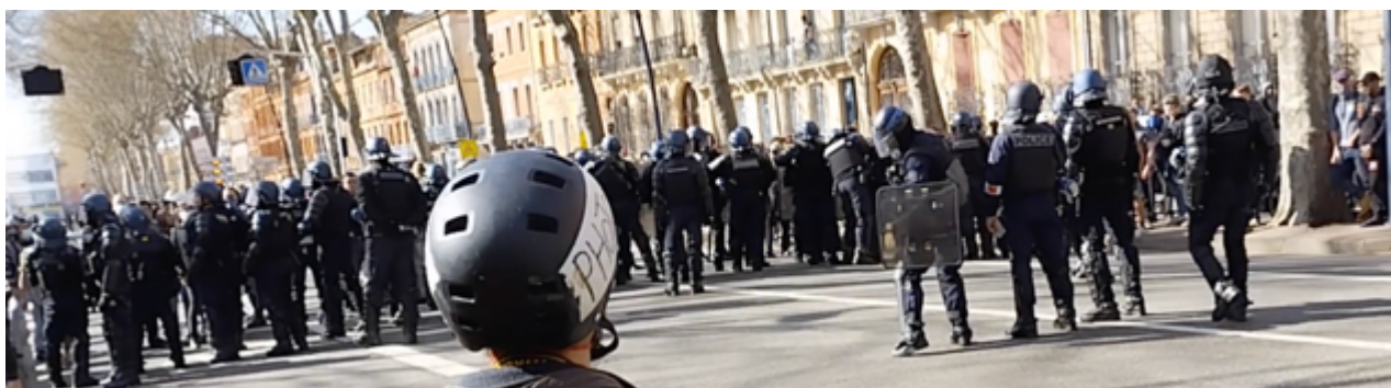
Le dispositif des EGM à l'arrêt avec en retrait l'OPI des CDI avec son mégaphone

16h55 – Les CDI sont, comme d'habitude, positionnés dans la rue qui mène au lycée Saint-Sernin mais en nombre plus important (25 contre une douzaine d'habitude) et nettement plus près du boulevard.