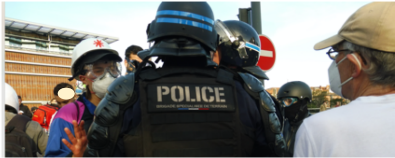
Echanges tendus entre secouristes et policiers à l'entrée du pont Marengo. Image de gauche : la personne au sol en PLS

Les observateurs partent en direction de l'avenue de la Gloire où des manifestants semblent s'être rassemblés.