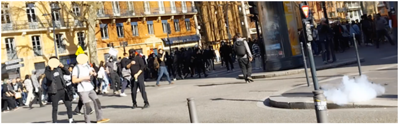
Les manifestant-es au moment où la grenade explose. Ils sont à une quinzaine de mètres pour le plus proche d'entre eux et le cortège est à environ 25 m (mesures sur Google Earth)

Donc, la question est la suivante : les EGM étaient-ils encerclés, sous la pression de personnes menaçant leur intégrité physique qui justifierait l'utilisation de cette grenade dite de désencerclement ? Sur la base de la vidéo de l'OPP, la réponse est clairement non. Il s'agit-là, comme nous l'avons souvent constaté dans les rues de Toulouse depuis novembre 2018, d'une utilisation offensive d'une arme dite de défense.