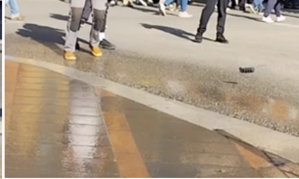
Ce qui reste de la grenade poursuit sa « course folle »