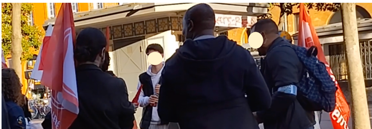
Les militant-es de Révolution Permanente en négociation avec les ELI le 15 mars 2023

Et, dans le paragraphe « Synthèse et commentaires » du rapport, il était précisé : « Les observateur-es ont pu constater, pour une fois, que les ELI jouaient un certain rôle lors de la séquence des négociations avec le groupe de jeunes de Révolution Permanente ».