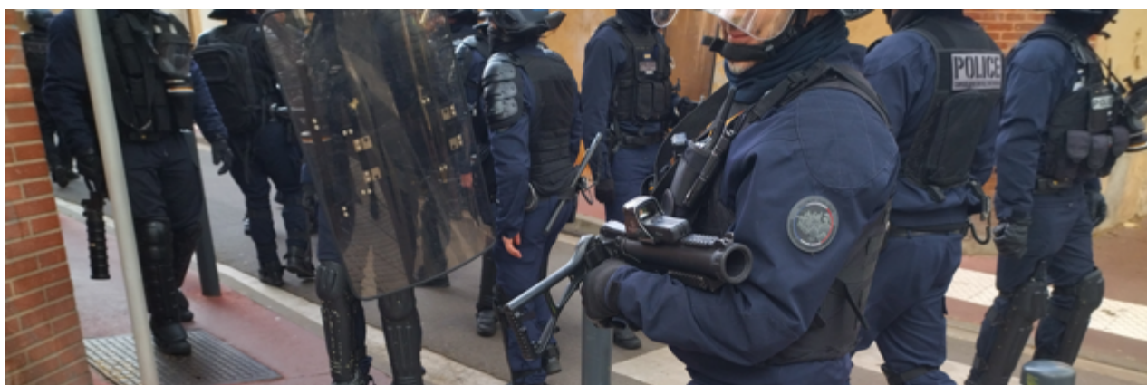
Un exemple de l'armement des CDI : tout à gauche, un lanceur Cougar ; au milieu et devant, un LBD ; à droite, un CDI a dans la main droite, une grenade de désencerclement. Sur le boulevard progresse une « tête de cortège » dont la moyenne d'âge doit être largement supérieure à 50 ans...

11h12 – Une petite cinquantaine de CDI avec quelques bacqueux positionnés au fond de la place Arnaud Bernard. Ils sont plus nombreux que d'habitude à cet endroit-là. Les fourgons de CDI précèdent la manifestation sur le boulevard d'Arcole avec une grosse trentaine de CDI. D'autres CDI progressent en parallèle le long de la rue Escoussières Arnaud Bernard.