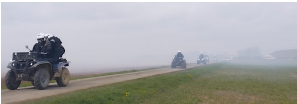
Surgis du nuage de gaz lacrymogène, les quads partent au contact

12h49 - Tout droit surgis du brouillard lacrymogène, nous voyons passer 20 quads des gendarmes qui partent en direction du cortège, qui arrive par le sud/sud-est (en provenance d'Asnières) et qu'ils ont déjà grenadé