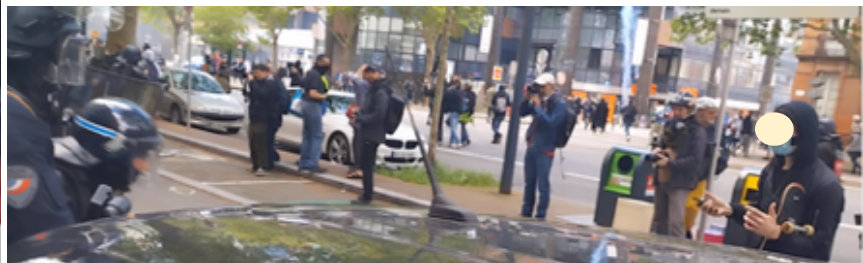
Image de gauche : la flexion du policier qui procède au lancer fictif ; dans sa main gantée, rien... Image de droite : à gauche sur l'image, la tête casquée du CDI ; à droite sur l'image, les bras écartés, le « photographe au skate » (personnage aperçu face aux policier-es tout au long de la manifestation avec son skate tout contre les boucliers...) fait part de son incompréhension tout en réalisant, sans doute, que le CDI ne lance rien...