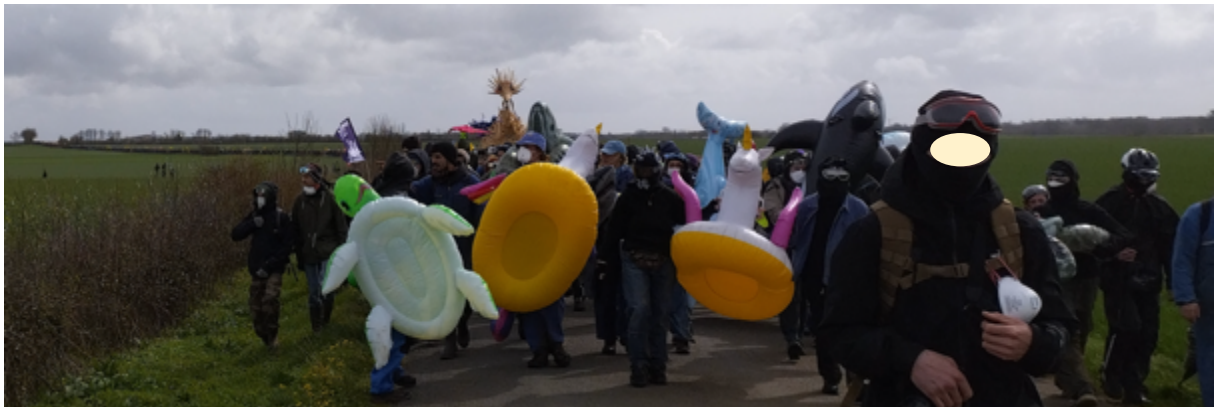
Les manifestant-es exprimant de manière ironique leur objectif d'atteindre la bassine et de s'y baigner

Les observateur-es toulousain-es, expérimenté-es dans l'observation des dispositifs dits de maintien de l'ordre et positionné-es devant le cortège « rose », dit de l'Outarde (le cortège « familles et élu-es »), étaient resté-es, tout le long de la déambulation champêtre dans la campagne picto-charentaise, en veille active pour observer à quel moment le cortège allait être bloqué par les militaires. Mais, hormis le survol de celui-ci par un hélicoptère, tout était calme et l'ambiance du cortège, qui s'étirait à perte de vue le long d'une départementale, était concentrée mais festive (le cortège était précédé de personnes portant des bouées gonflables en forme d'animaux symbolisant la future baignade espérée dans la bassine...).