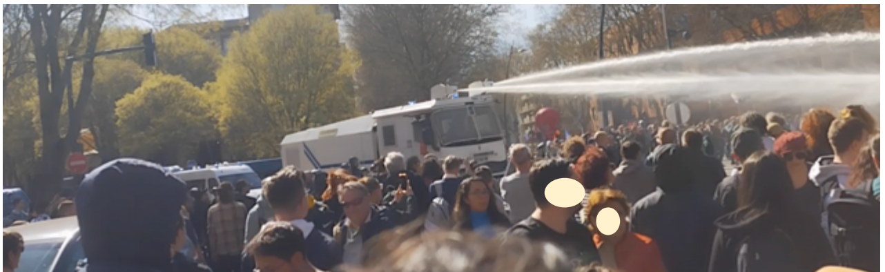
Le camion à eau en action. Sous les jets, on aperçoit, au fond, le ballon de la CGT qui indique la position du cortège syndical.

Et puis, vers 16h09 , au niveau du boulevard Leclerc, les gendarmes font intrusion dans la manifestation et prennent position devant le cortège syndical ; puis le camion à eau s'avance et entre en action. Y a-t-il eu des sommations ? Nous n'en savons rien.