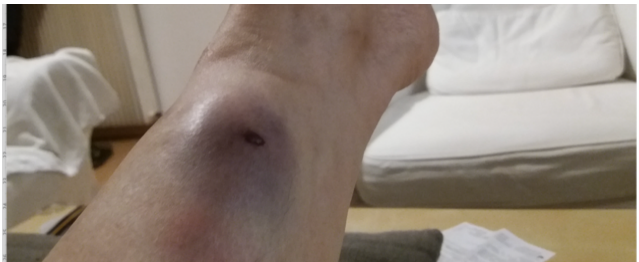
La photo du bas de la jambe de l’observateur blessé prise le soir même de la manifestation

Les constats faits, à chaud, par certains observateurs les conduisent à penser que ce jet de grenade visait explicitement les observateur-es. Cependant, l’examen détaillé des vidéos ne permet pas d’en être totalement certain. »