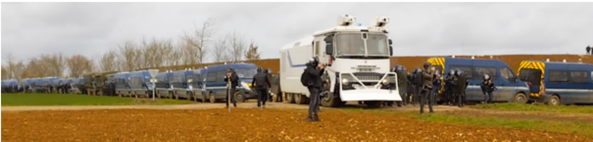
Les véhicules militaires, à touche-touche, avec en leur centre un camion à eau des CRS

Plus les observateur-es, totalement isolé-es du cortège, progressaient vers la bassine, plus iels prenaient conscience de la présence massive des militaires dont les fourgons et camions, ainsi qu'un canon à eau, étaient littéralement collés à la bassine, les uns à côté des autres avec un petit espace entre eux dans lequel on pouvait apercevoir des gendarmes mobiles équipés de « pied en cap » (casques, boucliers, masques à gaz, lanceurs Cougar et LBD). Et derrière eux et elles, la bassine avec ses monticules de plusieurs mètres de haut.