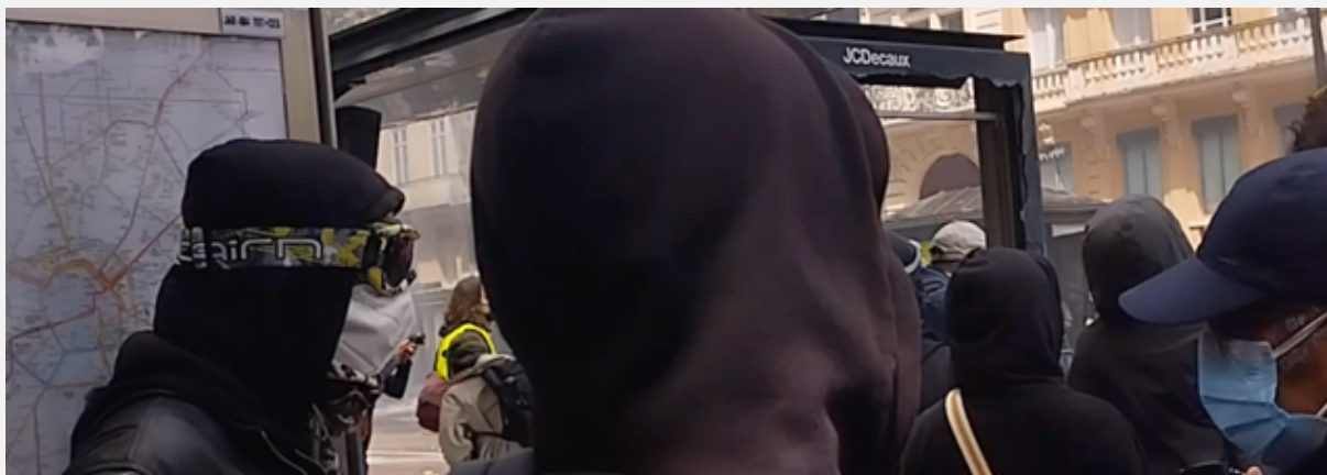
Le dress code du printemps 2023. Ces manifestant-es (?) ne sont pas au contact alors que ça pète derrière. C'est la pause « clope » ?

Ce côté dérisoire ressenti pendant et après les observations de ce mois d'avril 2023 à Toulouse en rédigeant les comptes rendus d'observation, ne peut qu'entrer en résonance avec ce qui s'est passé à Sainte-Soline ; et qui doit ne pas nous faire oublier que, si un jour les manifestant-es de Toulouse basculaient vers de nouvelles cibles et avec d'autres moyens, les policiers et gendarmes seront alors là, « armés jusqu'aux dents ». Et que seul le nombre pourrait éventuellement faire basculer les choses... Nous en sommes bien loin.