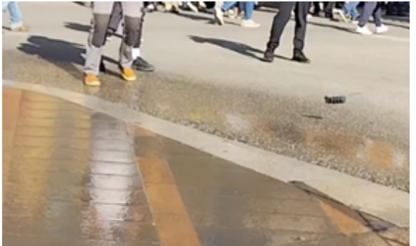
Ce qui reste de la grenade poursuit sa « course folle »