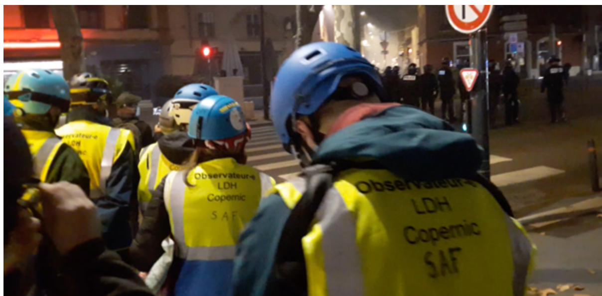
Les observateur-es en position après avoir subi un jet de grenade ciblé – Boulevard Carnot à Toulouse – 17 novembre 2020

Le fait de déclarer leur présence n’a pas empêché le fait que les observateur-es aient été, et continuent à être, les cibles directes des policier-es à de multiples reprises, en particulier par les CDI, la BAC mais aussi les CRS.