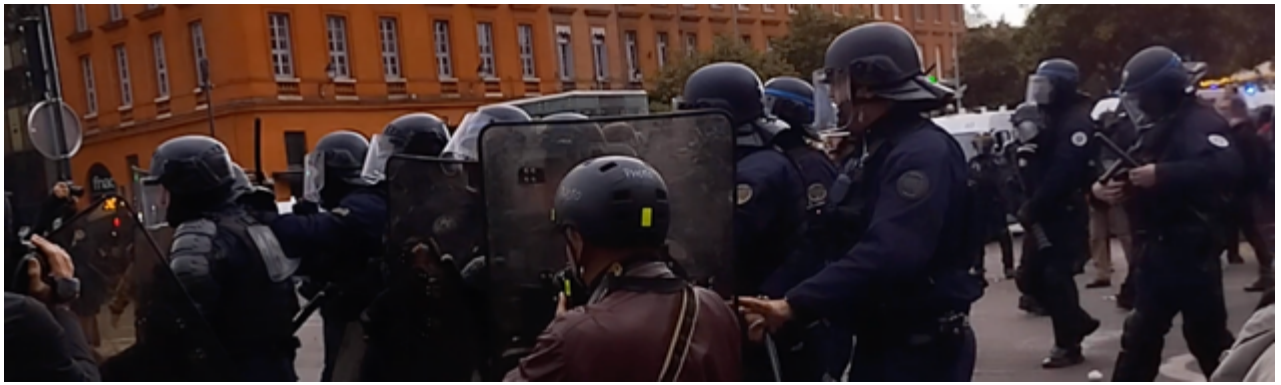
Matraque levée, les CDI dégagent sans ménagement les manifestant-es qui stationnaient encore sur la chaussée