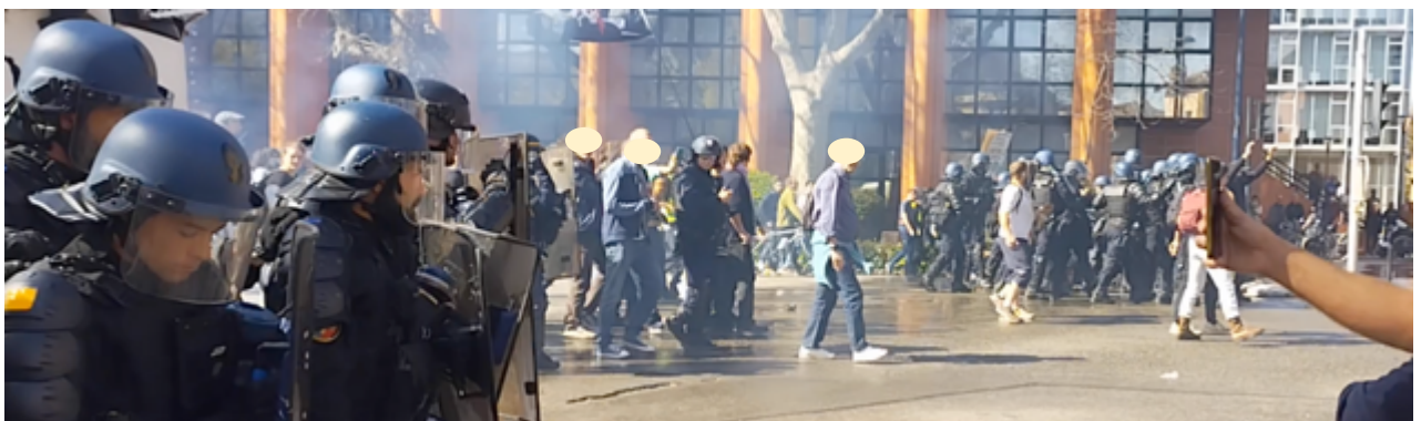
Les gendarmes s'insèrent dans le cortège et occupent tout le boulevard, y compris les contre-allées.