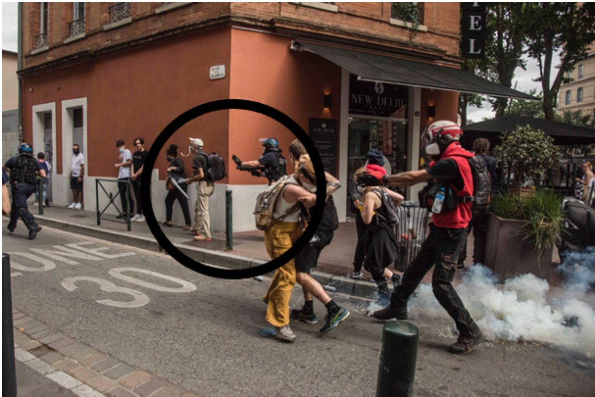
Le geste du policier est sans ambiguïté. Il reste volontairement sur le trottoir et se prépare à pousser violemment dans le dos une personne qui ne le voit pas venir