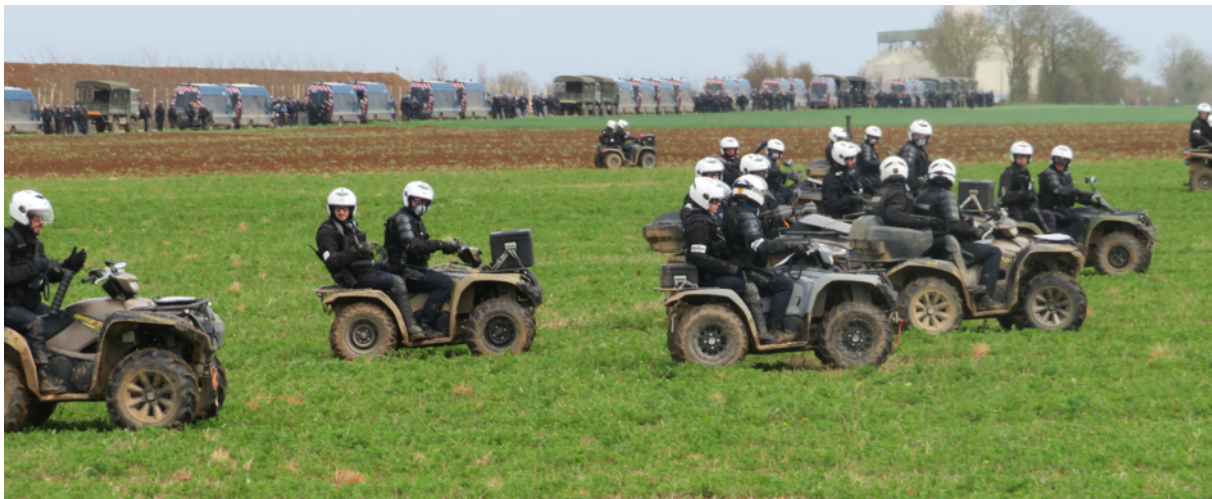
Les quads se regroupent avant une charge