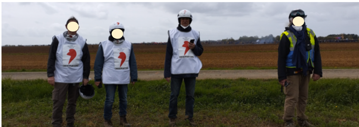
Quatre des cinq membres de l'équipe mixte Poitou-Charentes / Toulouse prêts pour l'observation.