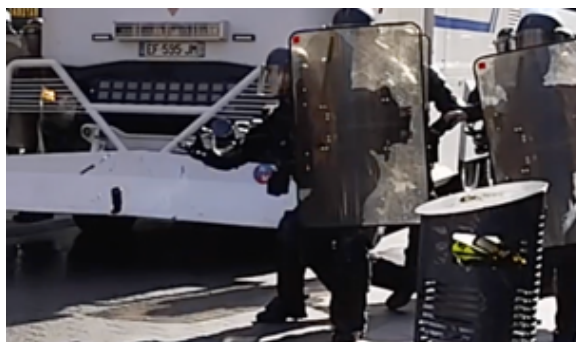
L’EGM lance la GMD (elle se dessine sur le pare-chocs du camion)