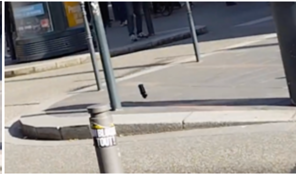
Puis, revient en arrière en tournoyant sur elle-même