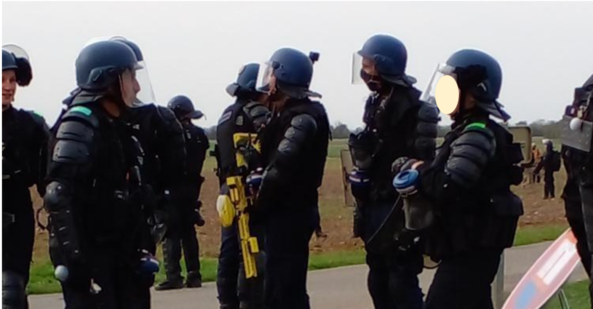
Sainte-Soline – Octobre 2022 - Au centre de la photo, un gendarme mobile équipé d'un fusil marqueur

Les observateur-es parisien-nes ont noté et photographié, lors de la manifestation du 25 mars à Sainte-Soline, la présence de gendarmes équipés de fusils « marqueurs ».