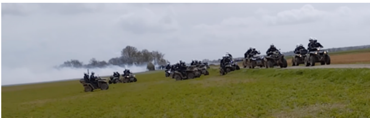
Les quads reviennent après avoir copieusement grenadé le cortège en provenance du hameau d'Asnières »

12h55 - Les quads reviennent vers la bassine et se remettent en position sur la petite route. Ils remontent vers la bassine à toute allure. Certains équipages ne sont pas complets, un seul gendarme dessus. Plusieurs aller-retours (4 ?) des quads qui se rapprochent à chaque fois des manifestant-es qui avancent dans le champ avec des tirs de grenades lacrymo. A chaque retour, les observateur-es constatent que les « quadistes » sont très joyeux, paraissent s'amuser de ces charges à grande vitesse.