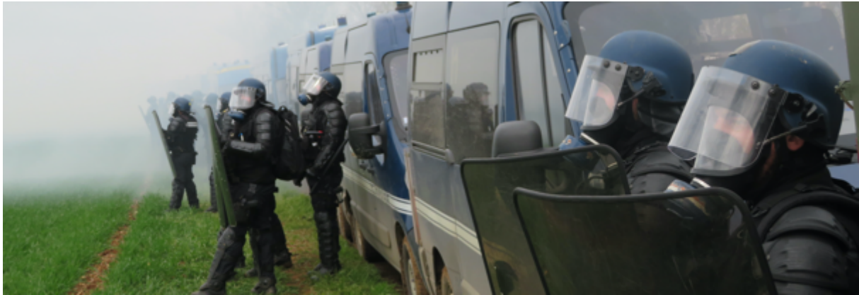
Les observateur-es au plus près des gendarmes

« 13h05 – On entend les premières explosions, sourdes, de grenades explosives (vraisemblablement des GM2L vu la distance des tirs). Au loin, le cortège « Outarde » (mais cela ne veut plus vraiment dire grand-chose) commence à se rassembler au plus près des FDO. Une partie du cortège en provenance d'Asnières se dirige vers les FDO par l'ouest après avoir été repoussé au sud-ouest, côté camion à eau. Face au danger de recevoir une grenade explosive et au fait que le vent ramène le gaz lacrymogène vers eux, les observateur-es vont se mettre le long des camions de la gendarmerie, devant deux camions type militaire. Un policier en civil casqué filme avec une console les différents cortèges de manifestant-es. Une grenade explosive tombe pas très loin des observateur-es.