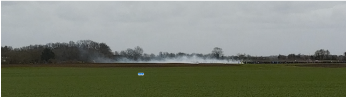
12h36 - Premiers tirs de grenades – A gauche de l'image, on devine les quads de la gendarmerie

« 12h36 - On aperçoit les premiers nuages de gaz lacrymogène mais au niveau de ce qui semble être la queue du cortège et d'où semble partir un second cortège