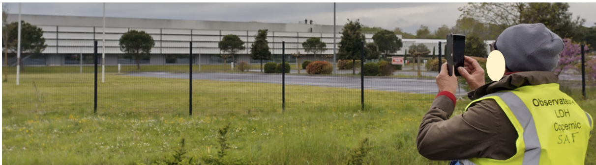
Au centre de l'image, sur le toit de l'usine Fabre, deux silhouettes de policier-es (ou gendarmes)

« Une présence très discrète des forces de l'ordre particulièrement étonnante au regard de l'évènement et des annonces faites au préalable dans les médias par le ministre Darmanin... Mais la conclusion est indéniable : sans présence accrue et sans pression des policier-es, pas d'incidents... ».