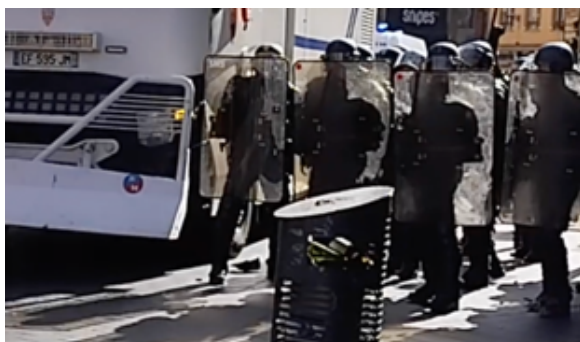
Entre les pieds de l’EGM de gauche, le projectile

Cette séquence mérite que nous nous y arrêtons un peu.