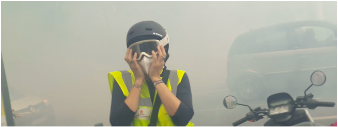
Une observatrice dans le nuage de gaz lacrymogène – Un clin d’œil à un célèbre tableau...

Les constats faits, à chaud, par certains observateurs les conduisent à penser que ce jet de grenade visait explicitement les observateur-es. Cependant, l’examen détaillé des vidéos ne permet pas d’en être totalement certain. »