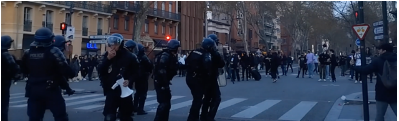
En face, un manifestant, visible à droite des CDI, répond avec son mégaphone en citant la cour de cassation. L'OPJ rebrousse chemin et semble dépité...

Cette scène mérite de figurer dans le top 5 des vidéos de l'OPP.