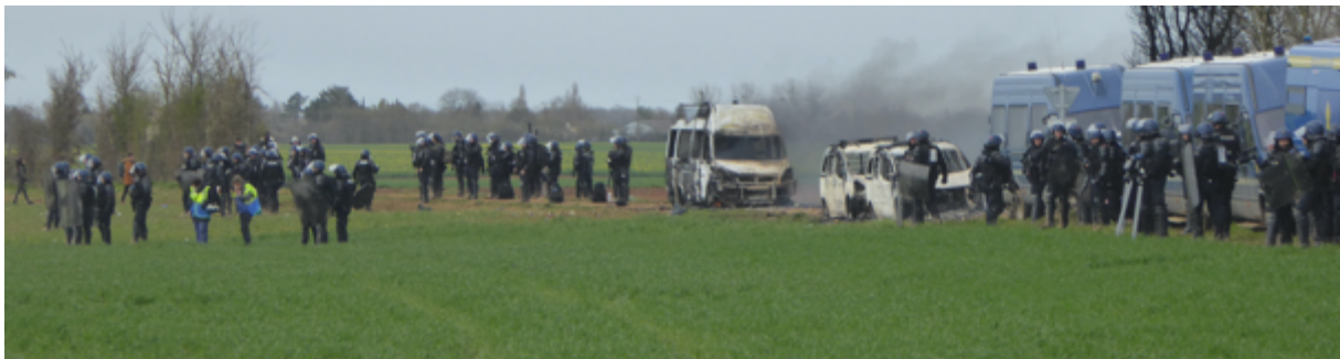
A gauche, deux observatrices toulousaines en collecte de traces et de restes de matériels au milieu des gendarmes...