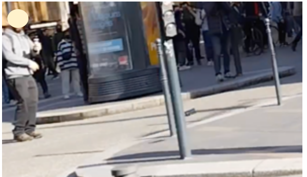
La GMD heurte un poteau