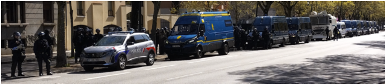
Le dispositif des FDO boulevard Leclerc. A gauche, l'OPJ avec son mégaphone

En direction d'Arnaud Bernard, des piétons « lambda » et/ou des manifestants épars sont sur la chaussée et les trottoirs. En fond, on aperçoit des fourgons blancs en travers du boulevard (CRS ou CSI).