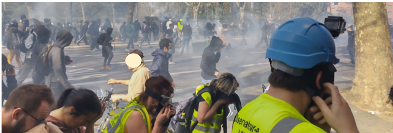
Tirs de grenades lacrymogènes – ça court dans tous les sens ; à droite, un observateur

A partir de ce moment-là, il n'y aura plus de calme dans les rues de Toulouse jusqu'à 21h ! Les gendarmes progressent en direction d'Arnaud Bernard. Le nuage de gaz lacrymogène est très dense.