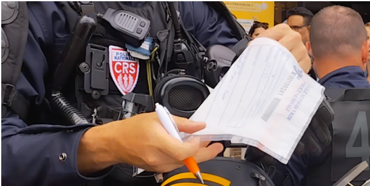
Un policier remplissant un formulaire de saisine le 6 juin 2023, allées F. Roosevelt, à Toulouse

Deux commentaires sur cette photo (image extraite d'une vidéo de l'OPP) :