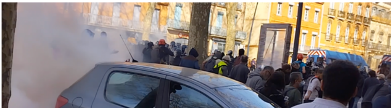
Boulevard d'Arcole. Les EGM progressent à reculons tout en grenadant ; du moins au début

A 16h46 , le cortège progresse en direction de Jean Jaurès. Les EGM progressent, tournés vers les manifestants, en reculant tout en effectuant, durant les premiers deux cent mètres, de nombreux tirs de grenades lacrymogènes. Ensuite, les manifestants suivront de très près les EGM et aucune nouvelle grenade ne sera tirée jusqu'à Jeanne d'Arc.