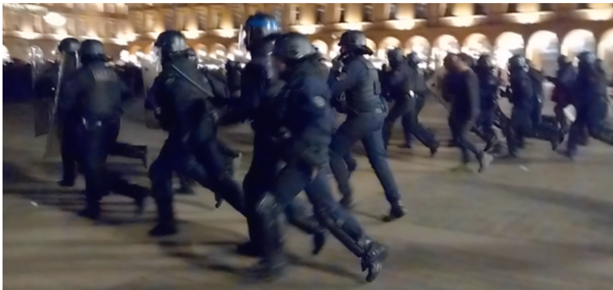
A 21h19, charge sans sommations des CDI place du capitole

Sans aucune sommation préalable, un groupe d'une trentaine de policier-es des CDI, dirigé par un OPJ muni d'un mégaphone et d'un brassard bleu-blanc-rouge sur l'avant-bras, charge les manifestant-es après que ce même OPJ ait dit aux policier-es « Allez, on y va ». Tout cela pour, in fine, mettre la main sur une banderole... »