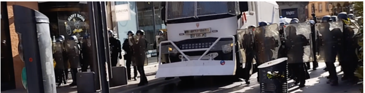
Les gendarmes mobiles au moment où ils reçoivent le projectile. Ils sont casqués et protégés par leurs boucliers

Voyons maintenant, sur la base de la même vidéo, le contexte de l'utilisation de cette arme de guerre (en fait, une grenade à fragmentation).