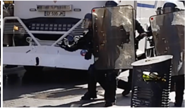
L'EGM lance la GMD (elle se dessine sur le parechoc du camion)