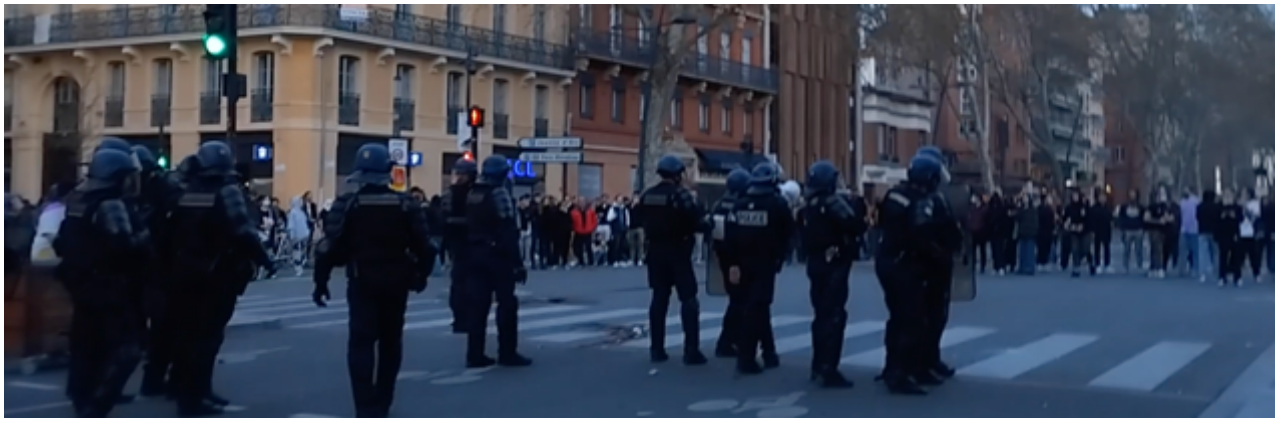
L'OPJ procède aux sommations avec son mégaphone blanc