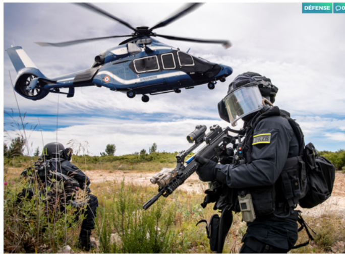
Les hélicoptères destinés au maintien de l'ordre

L'image de gauche est celle des nouveaux blindés de la gendarmerie, appelés Centaure, dont celle-ci est progressivement dotée. Les caractéristiques d'armement de ces blindés sont bien décrites dans cette infographie publiée par le média en ligne « Contre attaque ». Leur présentation à la presse ce 19 octobre 2023 57 est suffisamment parlante pour que nous ne détaillons pas plus avant ce matériel de guerre (sociale ?).