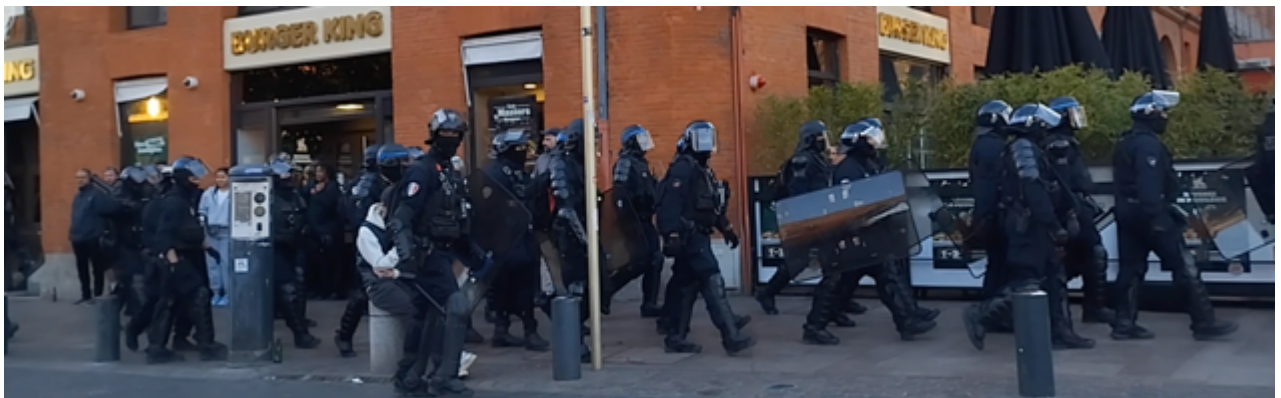
Des « regards qui tuent » chez certains CDI...

19h43 – Une trentaine de CDI arrive depuis Wilson, dirigés par un OPJ « bien connu de nos services »