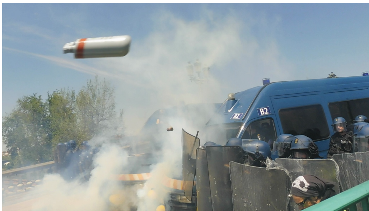
Grenades dans le ciel toulousain – Vue depuis le pont Neuf