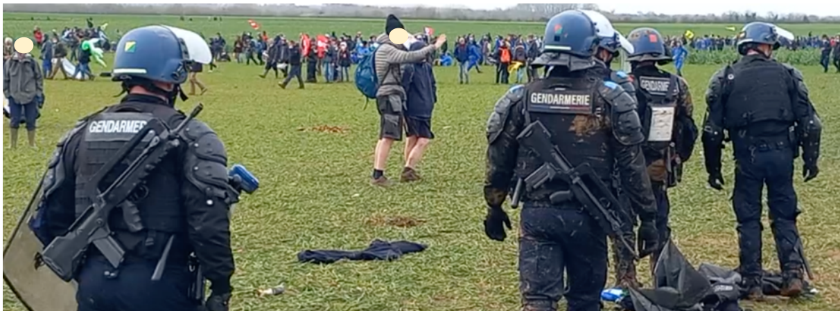
Sainte-Soline – 25 mars 2023 – Des gendarmes équipés de fusils mitrailleurs FAMAS. Pourquoi ?