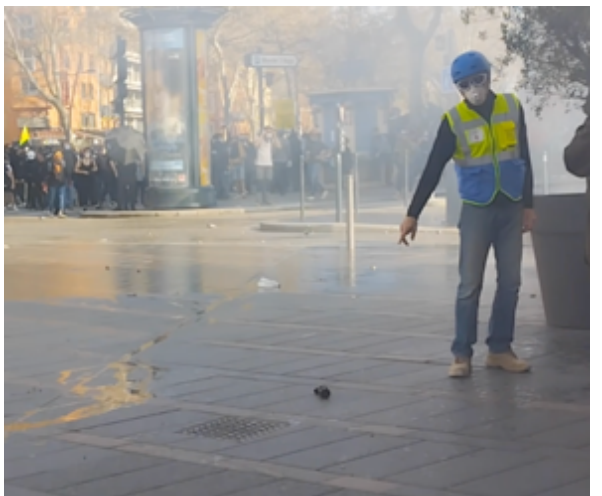
Un observateur montre ce qui reste de la grenade au sol.