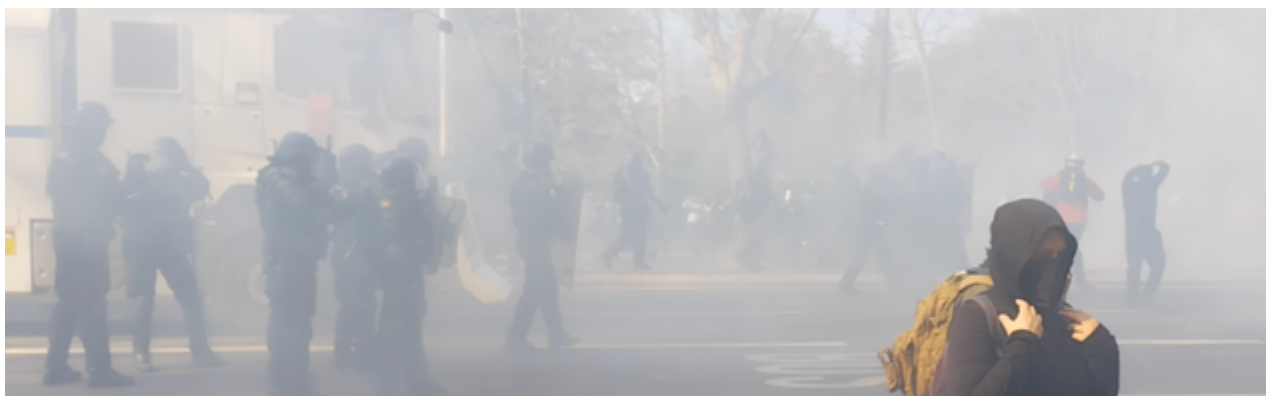
« Gorilles dans la brume... »

A partir de ce moment-là, il n'y aura plus de calme dans les rues de Toulouse jusqu'à 21h ! Les gendarmes progressent en direction d'Arnaud Bernard. Le nuage de gaz lacrymogène est très dense.