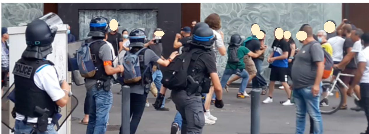
Un policier des BST interpelle une personne sur le trottoir

« Et, là, à 18h04 les policier-es, avec quelques gendarmes en renfort, utilisent la manière forte. Les BST, qui étaient en embuscade, interviennent, interpellent une personne et commencent à se replier. Malgré la réaction de leurs collègues qui leur demandent de se replier (« oh, les gars, faut se replier là » entend-on sur la bande son de la vidéo de l'OPP), un policier suivi par certains de ses collègues de la BST décide d'aller plus avant et traverse les personnes rassemblées pour procéder à une nouvelle interpellation au milieu des manifestant-es.