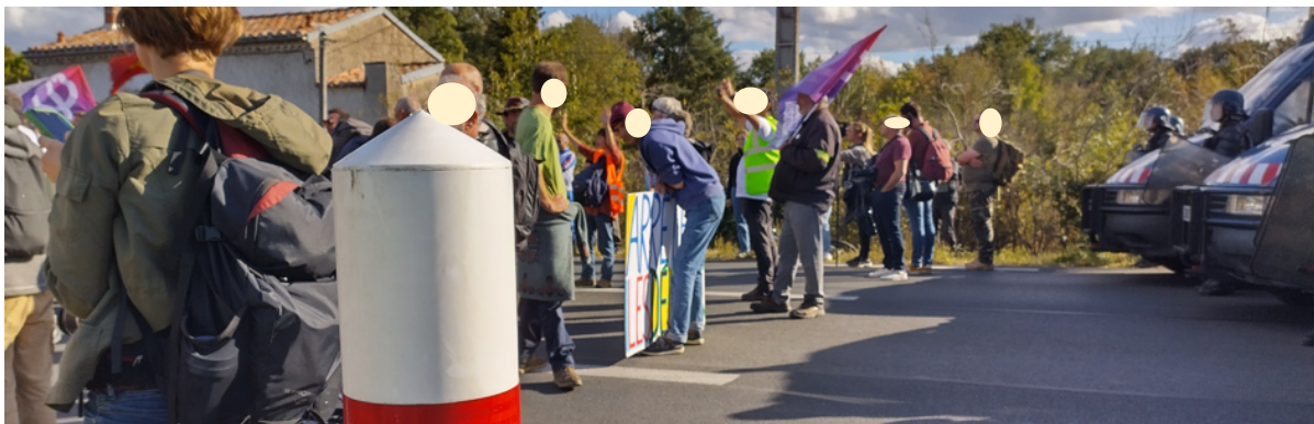
Les gendarmes mobiles au contact des manifestant-es sur la N126

Les deux équipes d'observateur-es ont noté la présence visible des FDO comme, par exemple, des CRS en nombre avec deux canons à eau et des grilles anti-émeutes sur la nationale 126 en direction de Castres au niveau du pont sur l'Agoût ou bien les gendarmes mobiles « au contact » à l'embranchement du chemin du Mercadel Bas sur cette même N126.