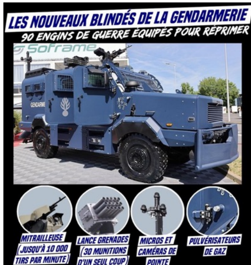
Les nouveaux blindés de la gendarmerie

Les deux images ci-dessous illustrent la fuite en avant dans la militarisation du maintien de l'ordre en France.