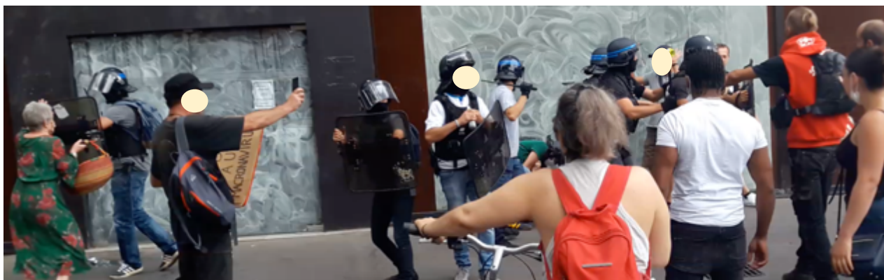
Les policier-es sous les protestations des manifestant-es. A gauche, une passante se prend un coup de bouclier

Sauf que cela ne se passe pas tout seul car les personnes présentes protestent vivement contre cette arrestation. Et ses collègues de la BST et des CDI arrivent à la rescousse. Les BST et les CDI refluent sous la pression et quelques projectiles sont lancés.