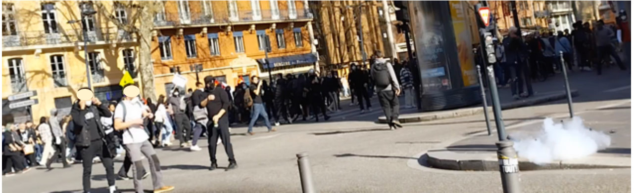
Les manifestants au moment où la grenade explose. Ils sont à une quinzaine de mètres pour le plus proche d'entre eux et le cortège est à environ 25 m (mesures sur Google Earth)

Donc, la question est la suivante : les EGM étaient-ils encerclés, sous la pression de personnes menaçant leur intégrité physique qui justifierait l'utilisation de cette grenade dite de désencerclement. Sur la base de la vidéo de l'OPP, la réponse est clairement non. Il s'agit-là , comme nous l'avons souvent constaté dans les rues de Toulouse depuis novembre 2018, d'une utilisation offensive d'une arme dite de défense.