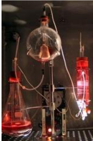
TC&A, Victimless Leather

Culture de cellules de porc, de souris et d'humain, sérum bovin, pompes péristaltiques, incubateurs.