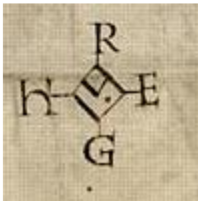
FIG. 2 : monogramme d'Hugues Capet, charte de 989, Arch. nat., AE-II 84.

Quant au sceau, si le type de majesté est attesté par ailleurs, sa légende n'est pas celle qui est gravée sur les sceaux conservés du premier roi capétien 13 . Enfin, il est décrit comme pendant à la charte ; or, cette pratique diplomatique n'existe pas encore aux environs de l'an Mil (en 989, le sceau est plaqué).