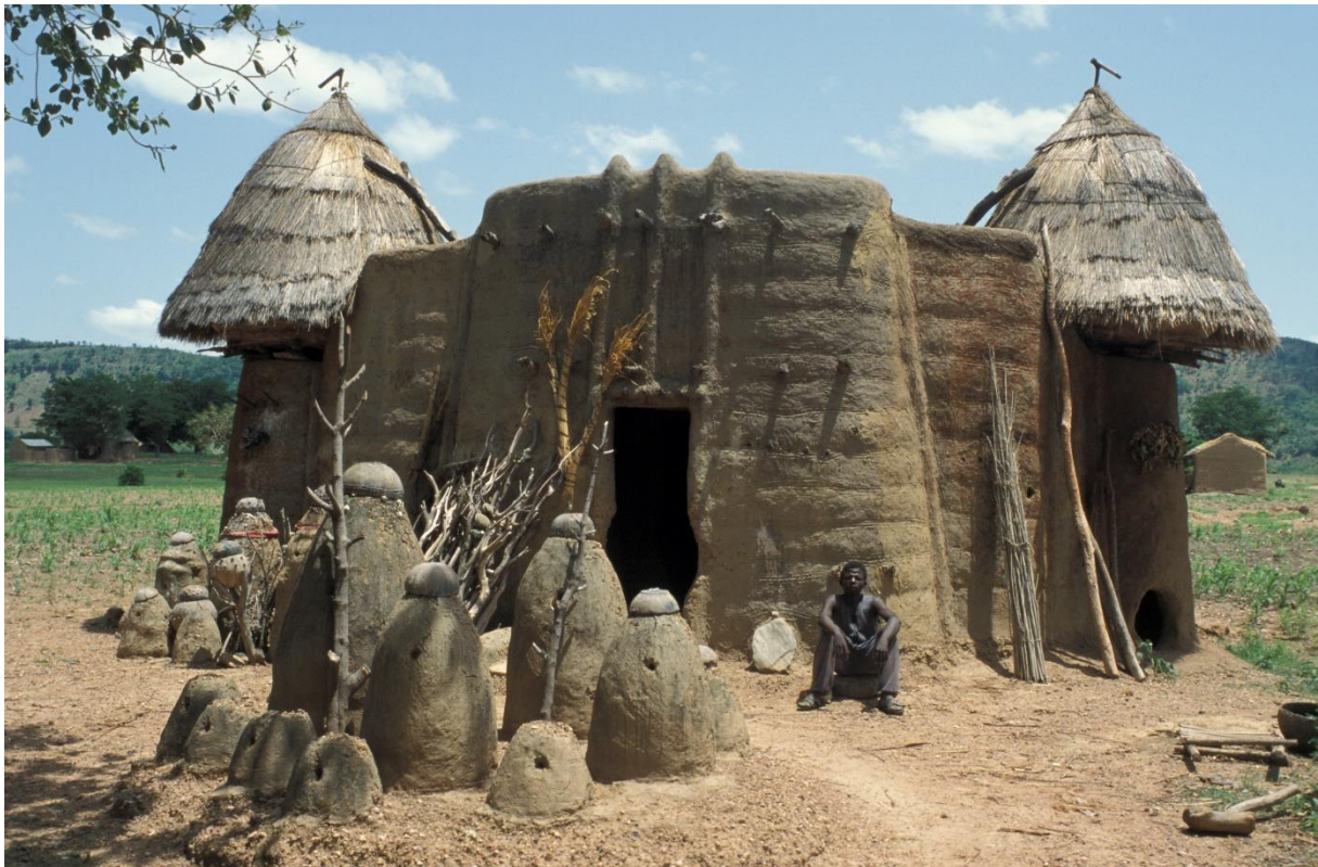
Fig. 3, Le Koutammakou, un paysage culturel unique au Togo, Photo : T. Joffroy

La structure, les méthodes pédagogiques et les contenus de ce cours furent par la suite repris dans le cadre de l'initiative continentale devant prendre le relais d' Africa 2009 , le Fonds pour le Patrimoine Mondial Africain (AWHF), lancé en 2006. Ainsi, outre quelques Assistances préparatoires individuelles qui sont attribuées aux états parties africains de la convention de 1972, depuis 2008 AWHF organise des cours entièrement dédiés à la question de l'élaboration de dossiers de nomination, à l'instar du programme Africa 2009 , alternativement en français et en anglais.