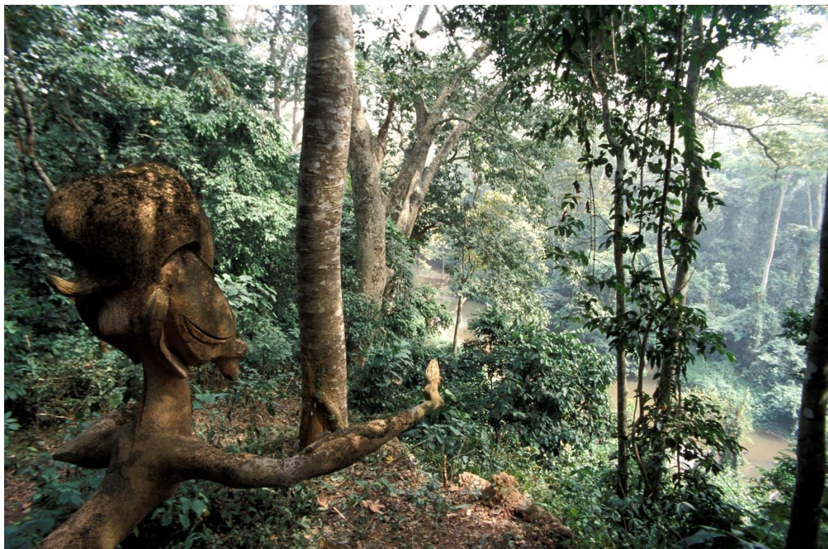
Fig. 2, La forêt sacrée d'Osun Osogbo, Nigéria.

Au-delà du succès de ces projets situés , suivant le principe adopté par le programme Africa 2009 d'allers-retours entre les projets situés et le projet cadre , toutes ces nouvelles expériences continuèrent d'alimenter et d'enrichir les contenus des programmes de formation. Outre une large part du cours annuel (3 mois) portant sur l'élaboration d'un plan de gestion pour un site support – dont certains furent utilisés par la suite pour des propositions d'inscription 12 –, un cours technique fut organisé au Rwanda du 2 au 27 juillet 2007, portant spécifiquement sur l'élaboration des propositions d'inscription de biens culturels sur la Liste du patrimoine mondial.