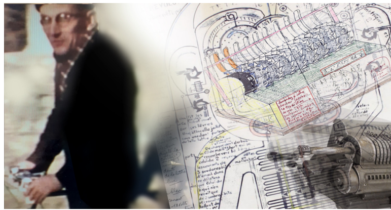
Montage, J.G.B., Fonds Bernard Autrand-Perdrizet, avec nos remerciements.