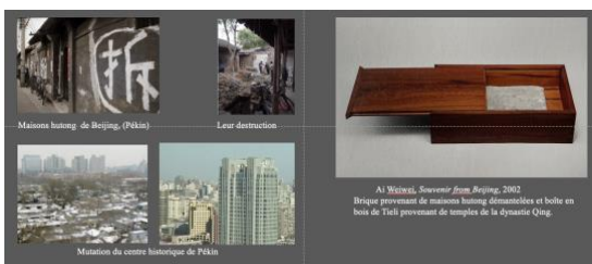
Ai Weiwei, Souvenir from Beijing , 2002

Il conserve une brique provenant de maisons hutong démolies, souvenir symbolique d'un passé révolu au même titre que la boîte dont le bois de Tielu (bois de fer) est aussi la matérialisation