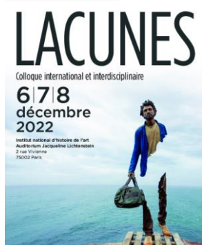
Table ronde. Dilemmes du comblement de la lacune en conservation-restauration :