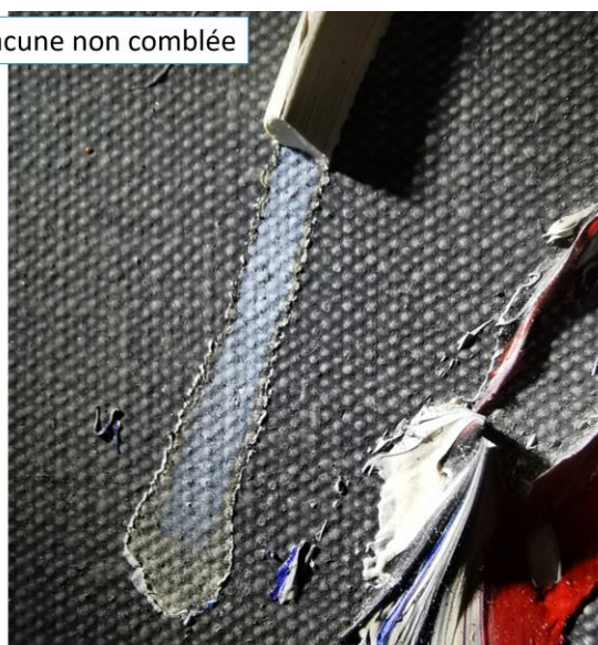
Georges Mathieu, Bataille de Hasting (23 juin 1956) ©Pauline de La Grandière 2021