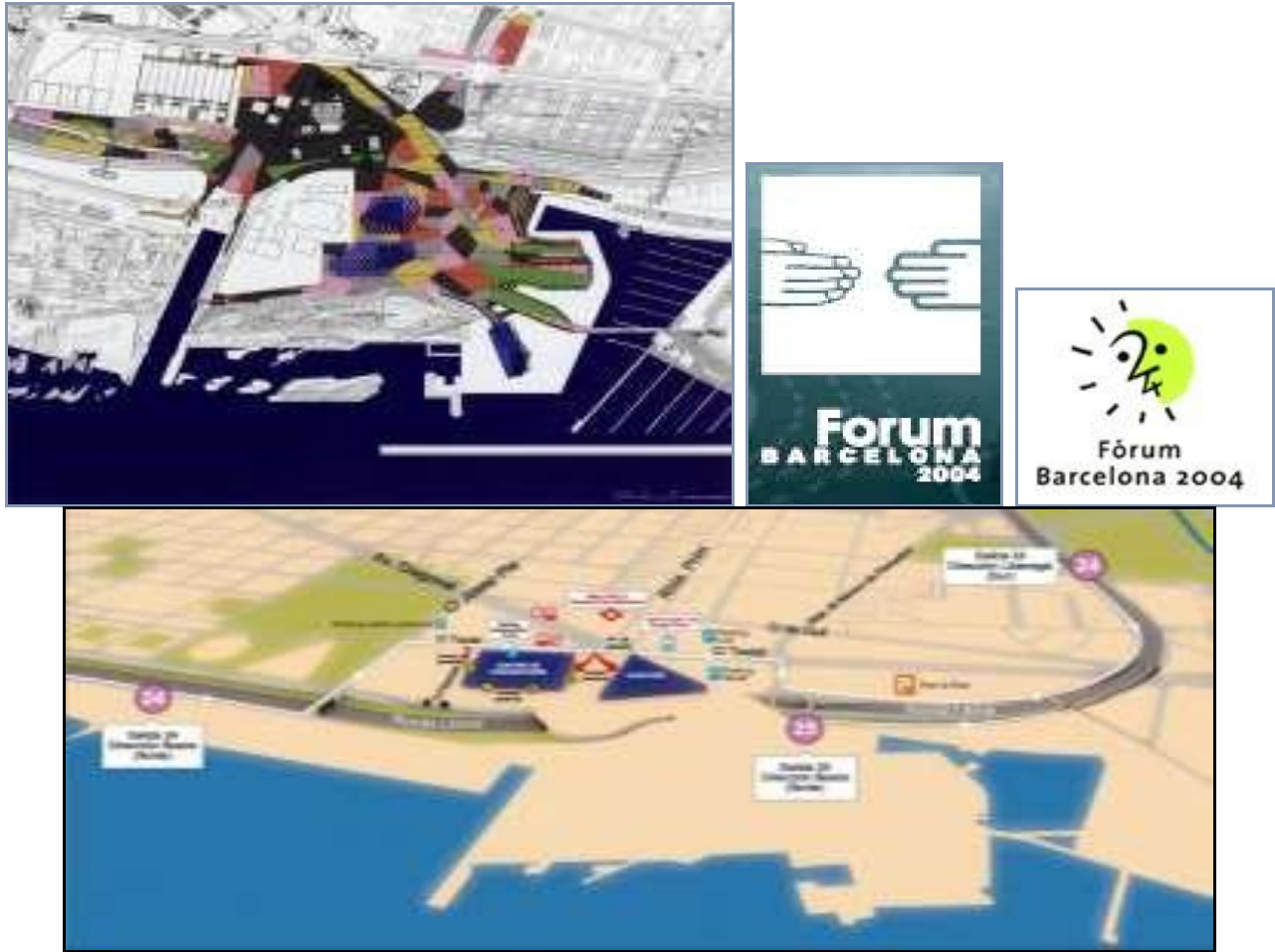
Dalle du Forum, emblème de la fête mondiale, premier logo de l'opération. Publicité de localisation du Centre de convention, le Triangle Forum épouse les formes et crée par lui-même un espace hybride.