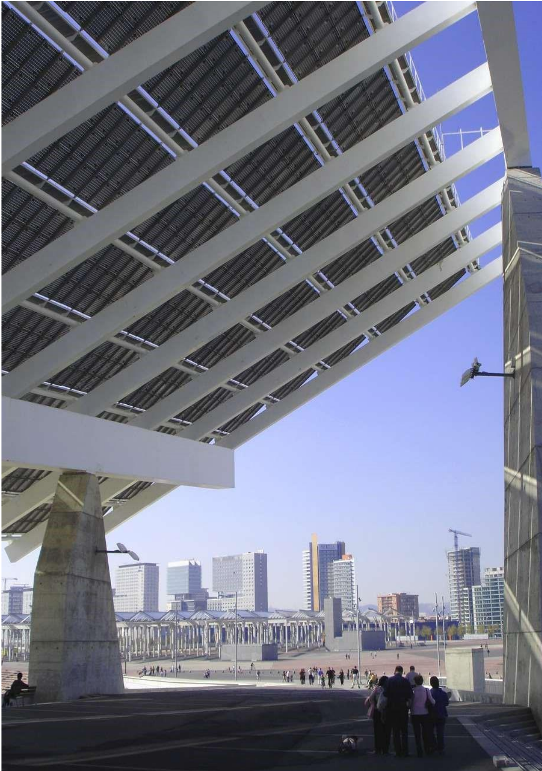
Le « grand paysage » est Force. l'exemple du panneau photovoltaïque de l'espace Forum guidant les regards à Barcelone, 2008. Patrice Ballester. Enquête de terrain.