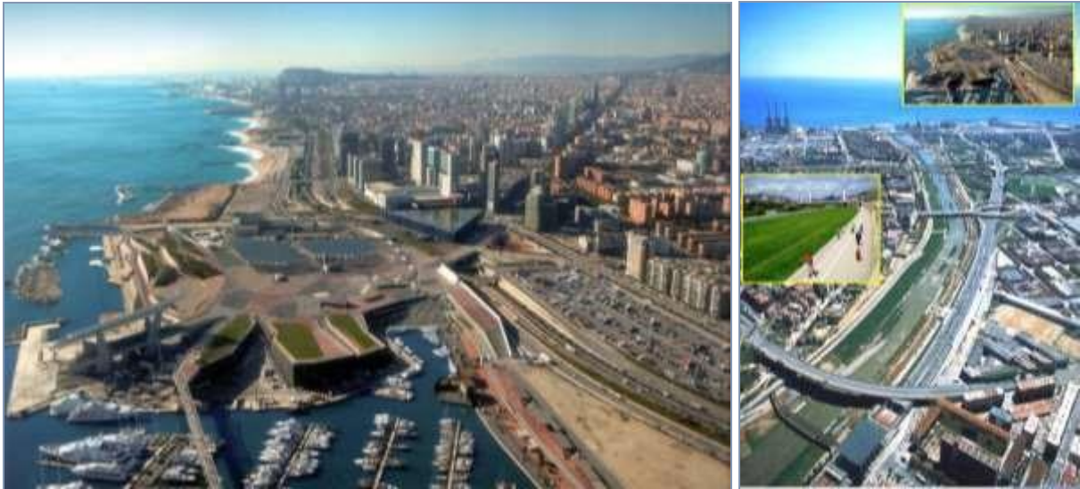
Planche n°2 : Un nouveau paysage urbain symbolique par une architecture de paysage et un urbanisme dit durable.