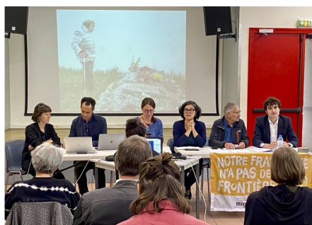
Conférence de presse pour annoncer la demande de réouverture de l'enquête à la justice française, 30.05.2022.