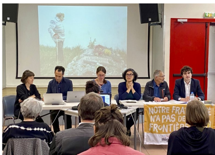
Conférence de presse pour annoncer la demande de réouverture de l'enquête à la justice française, 30.05.2022.