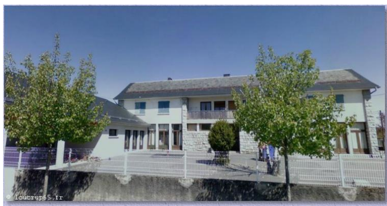
Figures 1. Vue d'ensemble de l'école

La classe investiguée est située au rez-de-chaussée, avec de grandes fenêtres côté cour. Les tables sont disposées en escargot, certains enfants sont ainsi face au TNI, d'autres perpendiculaires mais tous les élèves ont visuellement accès au TNI. Un tableau noir est situé sur le mur perpendiculaire au TNI, sur lequel le programme des activités de la journée. Le bureau de la maîtresse se trouve au fond de la classe, et est équipé d'un poste informatique portable. L'enseignante dispose d'un espace sous la mezzanine avec son matériel pédagogique. L'espace en mezzanine permet le stockage du matériel artistique.