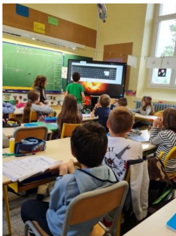
Figure 5. Utilisation du clavier pour répondre à l'exercice

L'enseignante fait un temps de réflexion avec les élèves sur ce qui leur a permis de faire cet exercice (exemples : réactiver les connaissances, autoévaluation, etc ...).