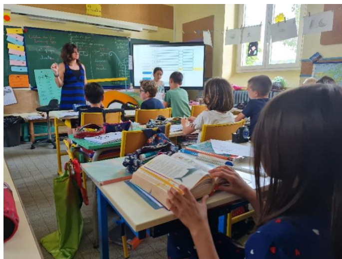
Figure 4. Utilisation du numérique et vérification de l'orthographe sur le dictionnaire papier

Un autre exercice consiste à classer les verbes dans les différents groupes. La liste de mots est inscrite au tableau et l'élève qui fait l'exercice au TNI recopie les mots et les classe.