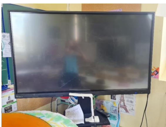
Figure 2. Dispositif TNI et caméra

L'enseignante utilise quotidiennement le TNI. L'ensemble des fonctionnalités du TNI sont exploitées. Les séances et exercices sont préparés à l'avance. L'enseignante ayant déjà une assez longue expérience du numérique dans sa carrière, elle possède une base de leçons et d'exercices sur Learning Apps, One, qu'elle alimente régulièrement avec de nouveaux contenus. Différents supports sont utilisés, vidéo, carte mentale, exercices, etc. Chaque début de classe commence par l'organisation des activités de la journée, inscrites sur le tableau noir.