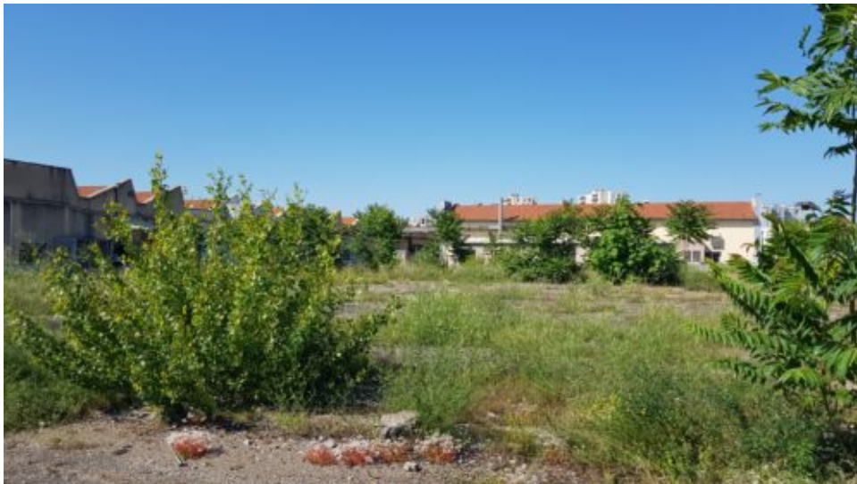
Ateliers Briand, 5 juin 2022

Le co- et le re- : de nouvelles ressources