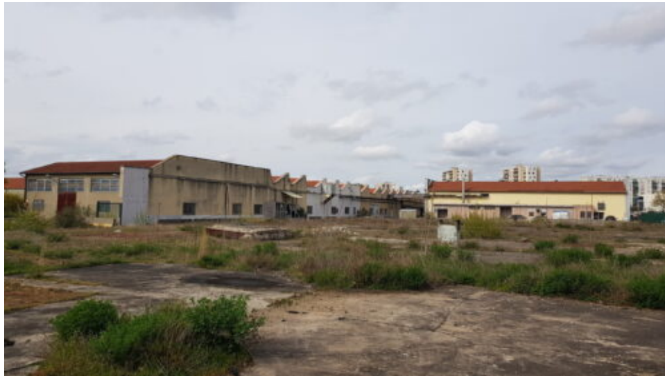
Ateliers Briand, 3 Avril 2023

La vacance que j'explore, c'est celle d'un désordre, d'un ordinaire en déséquilibre ou d'un déséquilibre de l'ordinaire , cognitif et sensoriel. Des espaces de friction qui induisent un trouble de l'expérience (matériel, esthétique, opérationnel), l'état de tension – ressenti et vécu – dont parle Dewey. Il ne s'agit pas ici d'épouser la perspective pragmatiste stricto sensu consistant à tout faire pour réduire à néant cette tension, se traduisant dans notre cas par l'occupation systématique d'espaces vacants, la destruction, l'anonymisation, et à terme la re-construction. Je porte plutôt l'hypothèse qu'il existerait plusieurs mécanismes d'ajustement possibles, de natures multiples pour tenter de cohabiter, de coexister avec ce qui est là, au quotidien, par un effort continu d'adaptation. Une manière de réduire la tension non pas pour la résorber mais pour faire avec , dans une idée de cohabiter avec elle plus que de la corriger, engageant de fait un rapport existentiel aux lieux abandonnés.