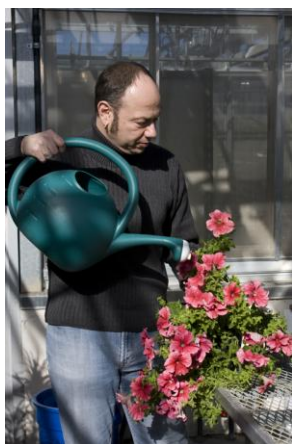
III. 5 Eduardo Kac, Histoire Naturelle de l'Énigme (août 2003-2008)