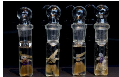
III. 2 Oron Catts, Ionat Zurr, Guy Ben Ary (TC&A) Les poupées du souci , cellules tissulaires en croissance sur polymère biodégradable www.goethe.de/ins/tr/lp/prj/art/med/str/en11565421.html