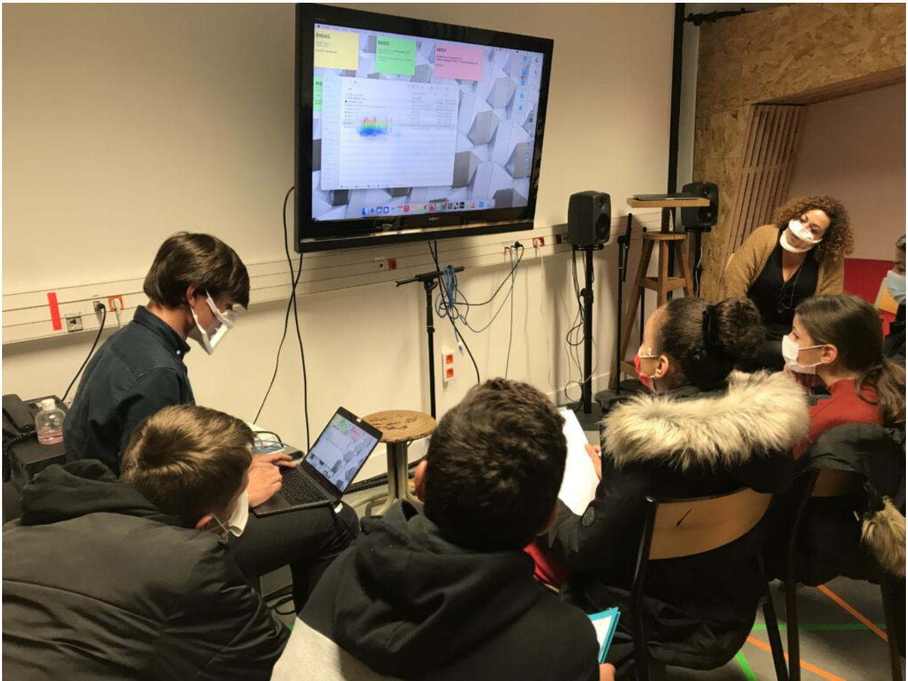
Projet Squ@rt, Service communication ENSAG, AAU-CRESSON, 2021

cherchez des idées pour améliorer la société?"; "Est-ce vrai que les chercheurs font des expériences?".