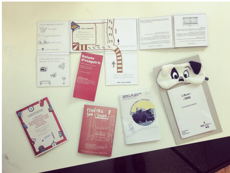
Projet Squ@rt, Service communication ENSAG, AAU-CRESSON, 2021