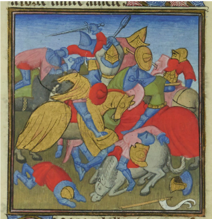
Fig. 5. Maître des Batailles confuses , Dernier combat d'Hector, Histoire ancienne, vers 1400, Paris, Bibliothèque nationale de France, ms. fr 301, fol. 97r: du brésil a été employé pour les roses et les rouges des tuniques des soldats et des caparaçons des chevaux (Villela-Petit, « Palettes comparées... », op. cit. , p. 385)