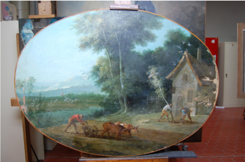
Fig. 2a et b. Printemps (châteaux de Versailles et du Trianon). a) Vue d'ensemble. b) détail des feuillages

bleus que pour les gradations de vert. Enfin, la présence combinée de grains de carbonate de calcium et de grains marron riches en matière organique, a été mise en évidence dans les strates vertes des coupes et suggérerait l'emploi de colorants instables 40 . Il pourrait en effet s'agir de laques jaunes dégradées. Une