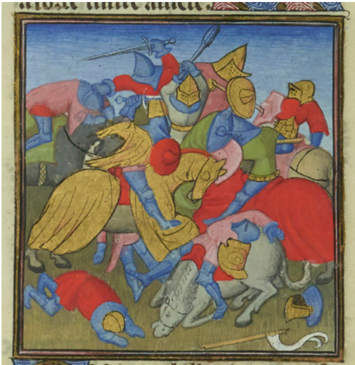
Fig. 5. Maître des Batailles confuses , Dernier combat d'Hector, Histoire ancienne, vers 1400, Paris, Bibliothèque nationale de France, ms. fr 301, fol. 97r: du brésil a été employé pour les roses et les rouges des tuniques des soldats et des caparaçons des chevaux (Villela-Petit, « Palettes comparées... », op. cit. , p. 385)