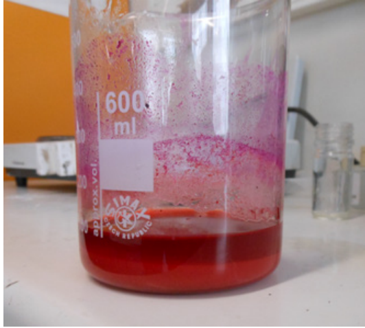
Fig. 4. Précipité de laque de brésil, reconstitution de la recette donnée par Cennino Cennini, Libro dell'arte , chap. CLXI