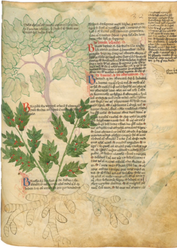
Fig. 6. Anon., Liber de herbis et plantis , début XIV e siècle, Paris, BnF, ms. lat. 6823, fol. 32r: l'arbre à brésil (« Braçillum ») est figuré ici en haut à gauche du folio

nouveau matériau colorant s'explique très vraisemblablement par un transfert technologique soit depuis le Proche-Orient, soit depuis la Sicile ou l'Espagne arabo-musulmane, régions où le brésil est alors un matériau bien connu de la civilisation islamique, comme en attestent les ouvrages des botanistes, géographes et voyageurs arabes, et où il circule amplement, comme le montrent les archives juives de la Guéniza du Caire. Si au Moyen Âge, les Occidentaux savent reconnaître un bois de brésil de qualité et en identifier la partie la plus colorante (le bois de cœur), ils méconnaissent en revanche jusqu'à la fin du XIII e siècle les régions d'origine de ce matériau et ignorent tout de la morphologie de l'arbre (fig. 6). Le brésil provient en effet des régions très éloignées que sont l'archipel indonésien, les péninsules malaise et indochinoise, Ceylan et le sud de l'Inde et Ceylan. Après avoir suivi la route de la soie via l'Asie centrale ou la route des épices via l'océan Indien, puis le golfe Persique ou la mer Rouge, il