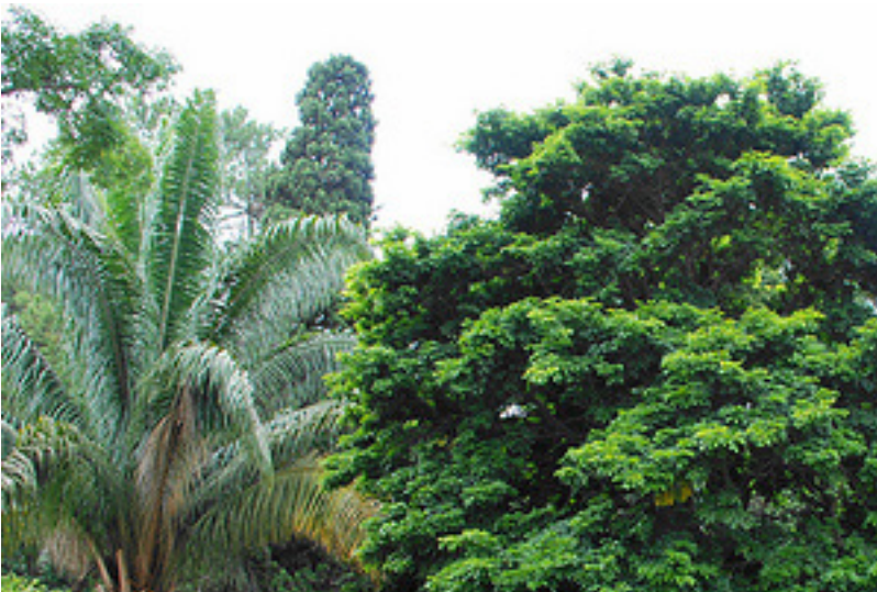
Fig. 3. Caesalpinia echinata Lam., Jardin botanique, São Paulo, Brésil (CC).

Le bois de brésil est un bois tinctorial rouge produit par différentes espèces d'arbres tropicaux poussant soit en Asie du sud et du sud-est ( Caesalpinia sappan L.) 44 , soit en Amérique latine, notamment au Brésil ( Caesalpinia echinata Lam.) 45 , pays qui tient d'ailleurs son nom de cet arbre ( fig. 3 ) 46 . Ce matériau a été abondamment utilisé non seulement par les teinturiers, mais aussi par les peintres des périodes médiévale et moderne : en plongeant le bois de brésil râpé dans un liquide, le colorant est extrait puis précipité par l'ajout d'alun ( fig. 4 ). Cela permet d'obtenir des pigments-laques de la gamme des rouges et des roses qui, le plus souvent, ont été utilisés en enluminure ( fig. 5 ), en raison de leur fragilité à la lumière 47 .