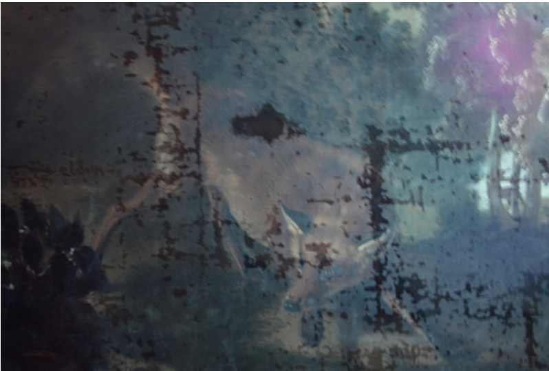
Fig. 1a et b. Détail Renard et deux perdreaux (mCN). a) sous lumière blanche. b) sous lumière ultra-violette faisant apparaître en noir les zones de repeints.

les traces des évolutions de goût et des effets des conditions climatiques instables caractéristiques des demeures historiques. Quant aux peintures conservées dans les musées, elles ont longtemps pâti d'un relatif désintérêt, les compositions champêtres ou animalières étant jugées trop insignifiantes. PictOu tire parti de la documentation élaborée par les restaurateurs depuis deux siècles, et en partie conservée au C2RMF. C'est à ce titre que le projet a d'abord fédéré l'équipe de recherche HiCSA de l'université Paris 1 Panthéon-Sorbonne et le département de restauration des Petites Écuries de Versailles. Cette documentation se révèle en effet doublement précieuse. D'une part, les restaurateurs y rendent compte des