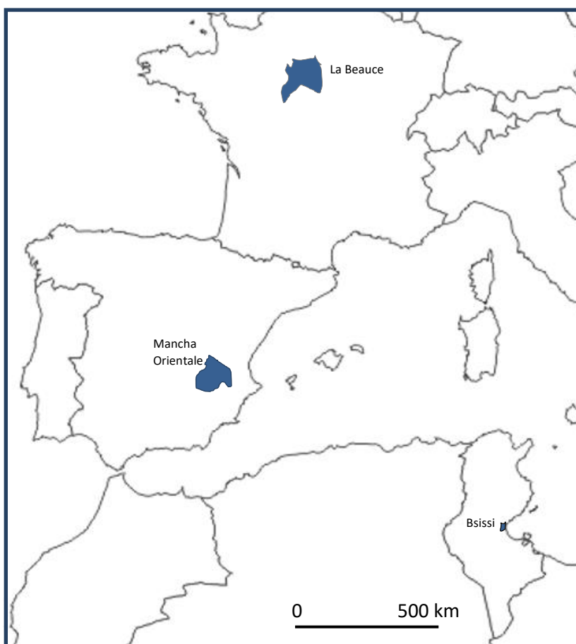
Figure 1. Localisation des trois expériences de gestion des eaux souterraines présentées

mobilisés : pour le cas de Bsissi (Chrii et al., 2023 ; Frija et al., 2016), pour le cas de la Mancha Orientale (Esteban et Albiac, 2012), et pour le cas de la Beauce (Verley, 2020 ; Bouarfa et al., 2011). Les auteurs du présent article ont eu aussi l'occasion de faire des entretiens avec les acteurs de l'eau et des observations dans chacun des trois cas.