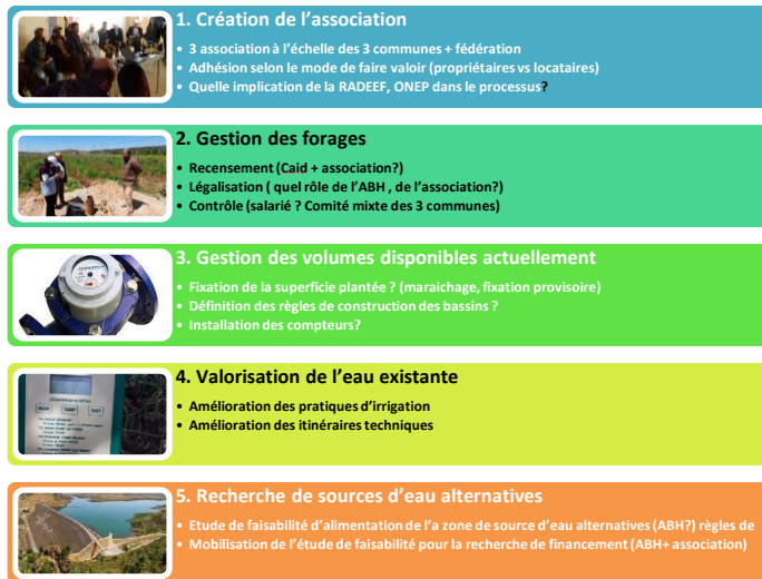
Figure 4. Scénario de gestion conçu lors d'un atelier au Maroc en mars 2023, dans le cadre du projet eGroundwater