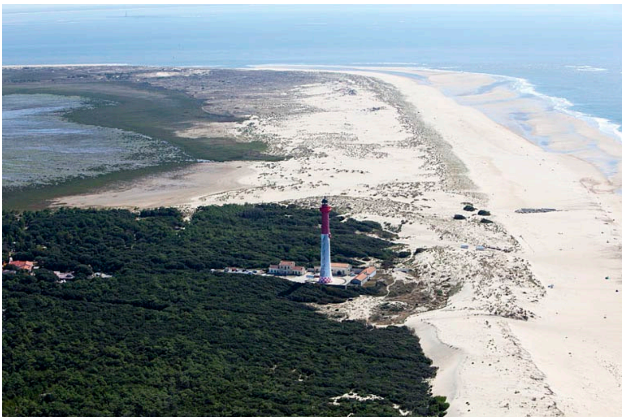
Vue aérienne du phare de La Coubre