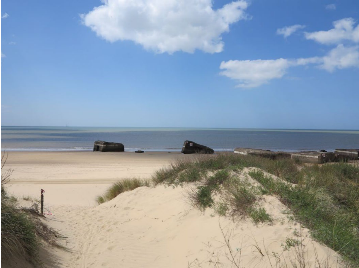
Les blockhaus sur la plage de la Grande Côte, vus depuis la dune, à Saint-Palais-sur-Mer