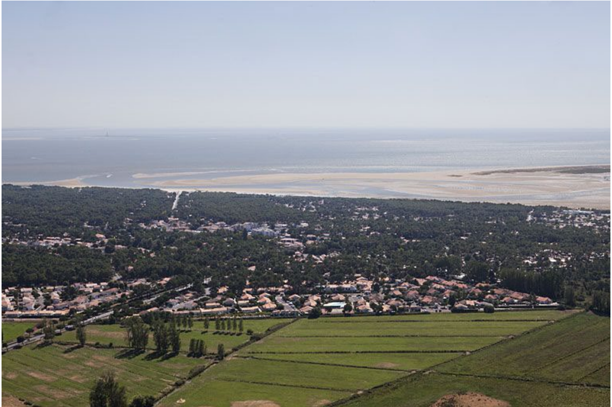
Vue aérienne de la forêt de La Palmyre (c) Région Nouvelle-Aquitaine, Inventaire général du patrimoine culturel, G. Beauvarlet, 2012.