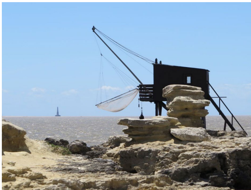
Carrelet à Saint-Palais-sur-Mer, (c) Région Nouvelle-Aquitaine, Inventaire général du patrimoine culturel, Y. Suire, 2015.

On ne peut terminer ce tour d'horizon des paysages de l'embouchure de la Gironde sans mentionner les carrelets : le développement relativement récent - essentiellement dans la seconde moitié du XX e siècle - et l'architecture fragile de ces cabanes de pêche perchées sur pilotis ne semblent pas pouvoir rivaliser avec l'histoire séculaire et l'architecture savante du prestigieux phare de Cordouan : pourtant, eux aussi sont emblématiques de l'estuaire et révèlent l'adaptation de l'homme à son environnement.