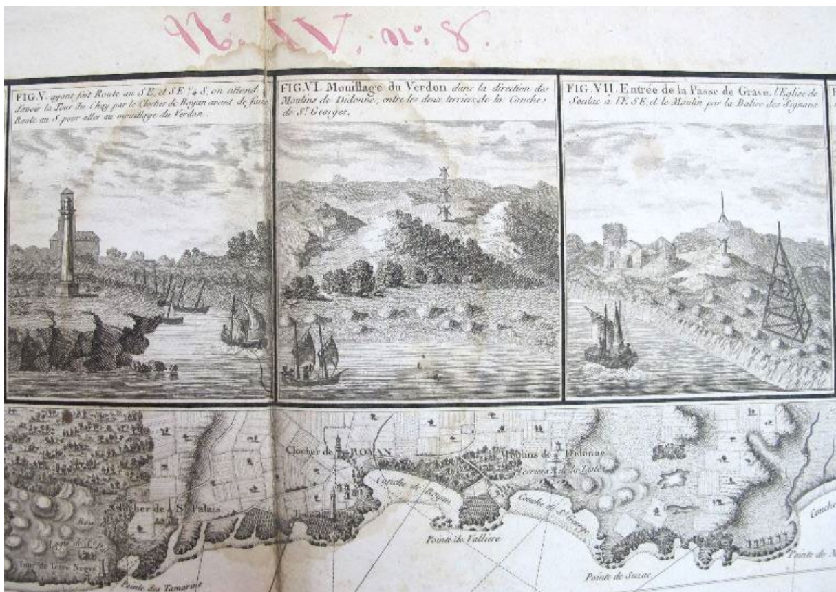
Extrait de la Carte de l'Entrée de la rivière de Bordeaux, 1776-1799 : détail des amers de Soulac

Puis d'autres phares construits sur les rives sont venus compléter le dispositif de signalisation de l'embouchure. Etablis à des emplacements particulièrement exposés à l'érosion et aux tempêtes, ils ont été déplacés, détruits puis reconstruits, en bois, en métal ou en béton. Ils témoignent des progrès techniques réalisés pour garantir une meilleure visibilité aux navigateurs. La silhouette en trompette rouge et blanche du phare de La Coubre, reconstruit en 1905 à 64 mètres de hauteur, répond à la tour carrée noire et blanche, bien plus modeste avec ses 28 mètres de hauteur, du phare de Grave établi en 1859. Ces formes - que l'on retrouve aussi à Terre Nègre ou encore à Vallières - se dressent ainsi dans le paysage bas des bords d'estuaire.