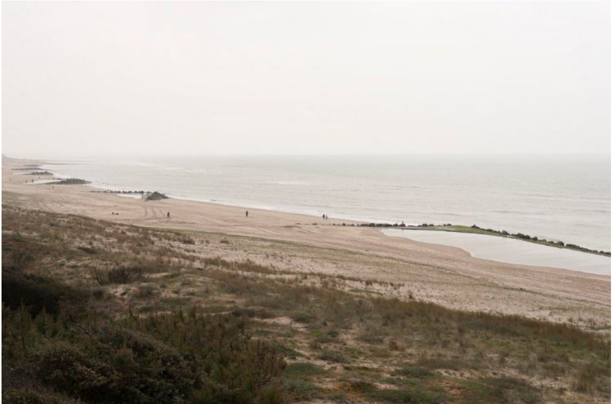
Les brise-mers sur la plage des Arros (Le Verdon), (c) Région Nouvelle-Aquitaine, Inventaire général du patrimoine culturel, A. Barroche, 2013.