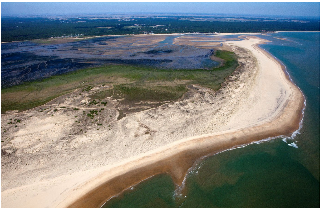
Vue aérienne de la baie de Bonne Anse