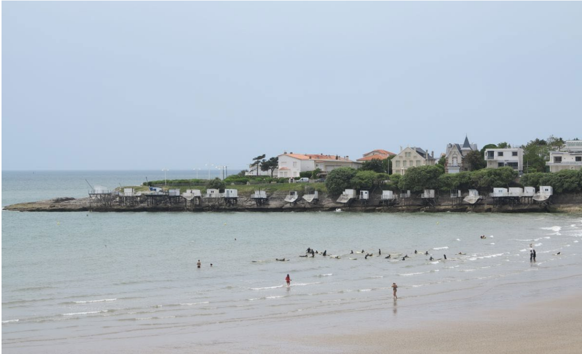
La conche de Pontailac

On ne peut terminer ce tour d'horizon des paysages de l'embouchure de la Gironde sans mentionner les carrelets : le développement relativement récent - essentiellement dans la seconde moitié du XX e siècle - et l'architecture fragile de ces cabanes de pêche perchées sur pilotis ne semblent pas pouvoir rivaliser avec l'histoire séculaire et l'architecture savante du prestigieux phare de Cordouan : pourtant, eux aussi sont emblématiques de l'estuaire et révèlent l'adaptation de l'homme à son environnement.