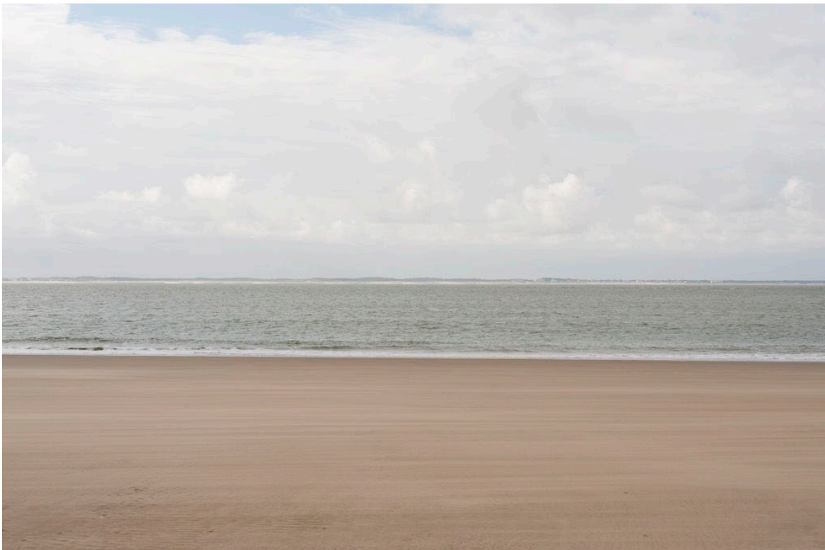
La côte du Verdon et de Soulac vue depuis le banc de sable de Cordouan

« Du sommet du phare, l'horizon est immense, mais il faut se tourner vers la pleine mer pour rêver à l'aise, car, du côté de la terre, l'entrée de la Gironde apparaît effroyablement triste, offrant un chaos de sables, de rocs, de marais, de landes... ». C'est ainsi, qu'en 1890, l'ouvrage consacré au Littoral de la France engage à tourner le dos à l'estuaire pour embrasser le large. Il est vrai que les côtes, distantes d'une dizaine de kilomètres du rocher de Cordouan, se résument à une ligne d'horizon à peine dessinée, entre le ciel et les eaux. Mais ce paysage imperceptible de l'embouchure intrigue : que dissimule ce linéaire lointain, que révèle-t-il du territoire et de son évolution ?