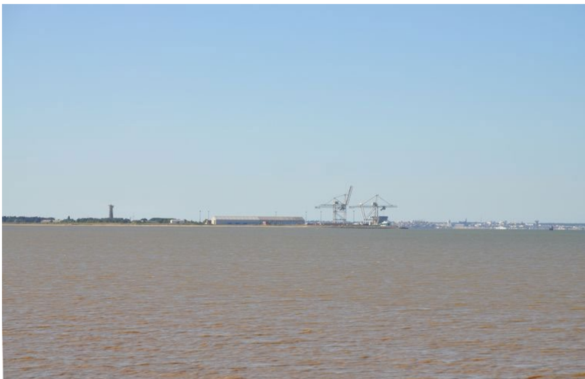
Les grues du port du Verdon et la côte royannaise à l'arrière-plan