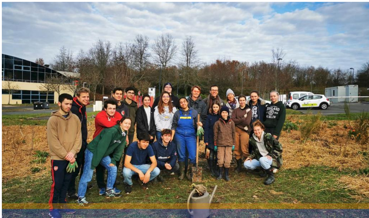
Chantier participatif de plantation de la micro-forêt - Décembre 2021