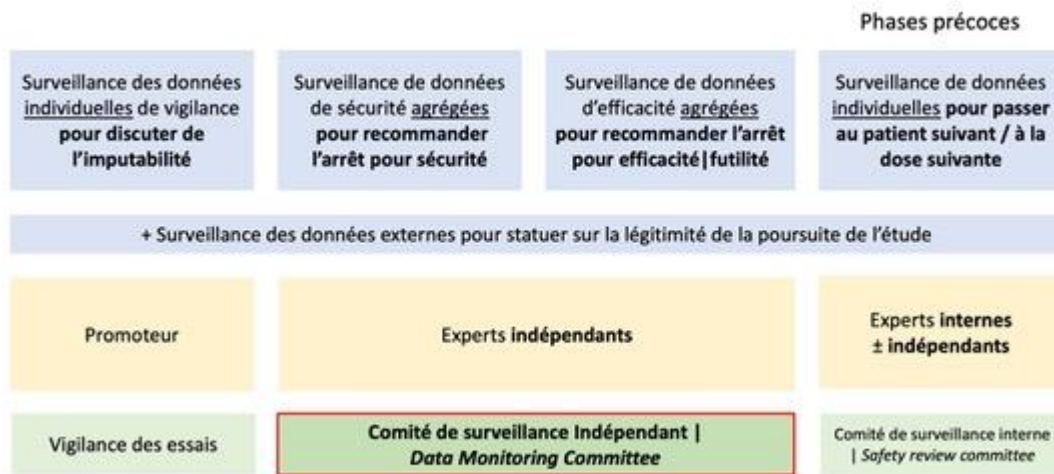
Figure 1. Dispositifs de surveillance assurant la protection des personnes en cours d'étude.