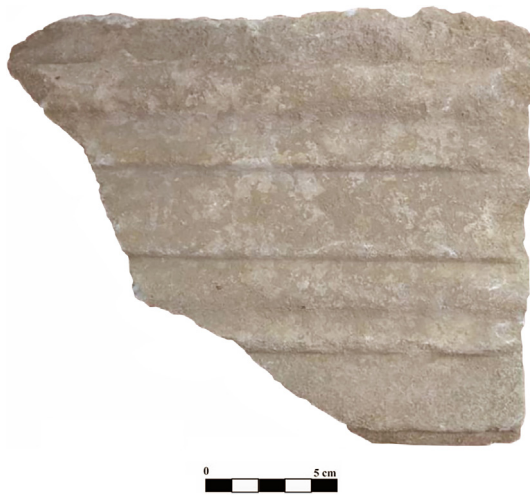
Fig. 3 - Cara B con molduras.