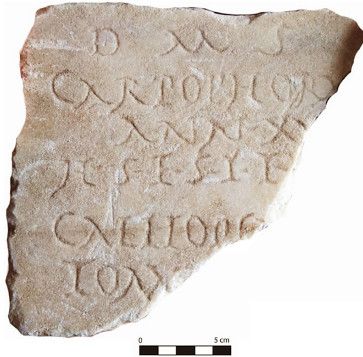
Fig. 2 - Cara A con texto epigráfico