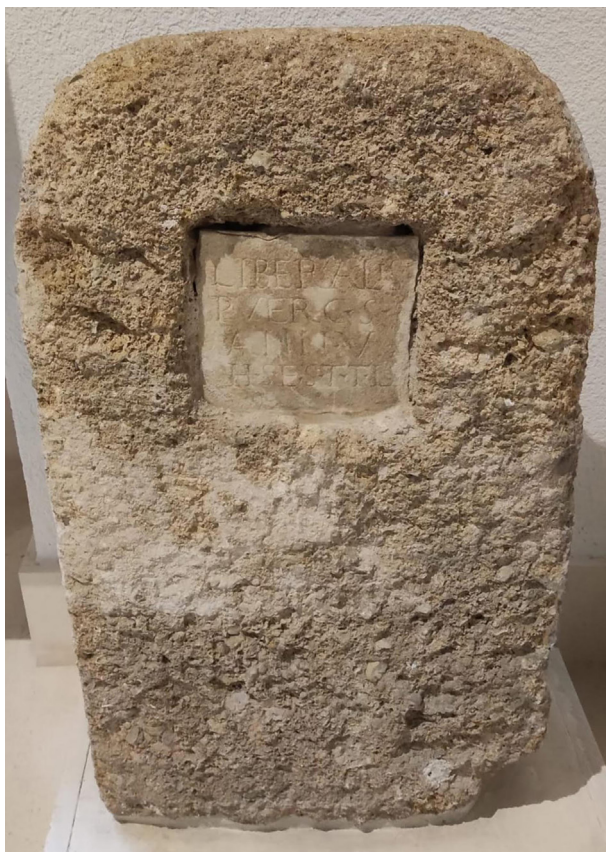
Fig. 4 - Monumento funerario de Cádiz