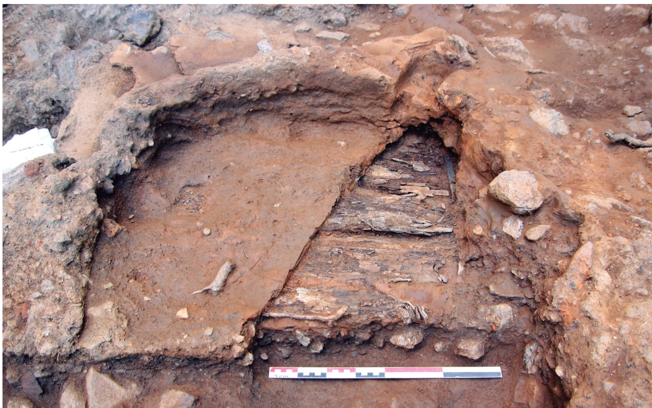
Fig. 2. Structure 1090. Le fond montre une partie du plancher sous-jacent au tapissage argilo-sableux. La partie antérieure n'a pu être préservée.

centimètres de haut et présentant un profil vertical ondulé. Deux trous de poteaux (diamètre 12 et 19 cm) encadrent la forme circulaire, formant un segment qui passe près de son centre. Malgré un aspect et des teneurs en plomb (10 à 19 %, mesures in situ) pouvant laisser penser à un dispositif de chauffe du minerai (grillage par exemple), le soubassement en bois et des essais de thermomagnétisme ont clairement infirmé cette hypothèse 7 . Seule l'hypothèse d'un traitement humide au tamis vient alors à l'esprit, même si elle peine à convaincre, car l'argile de fond de structure ne présente pas de litage régulier, et le niveau de concentration en plomb (au-delà de 10 %) n'est connu que pour des vestiges liés à des activités métallurgiques. De plus, un tamisage ne peut constituer une étape finale dans le cadre de cet atelier minéralurgique.