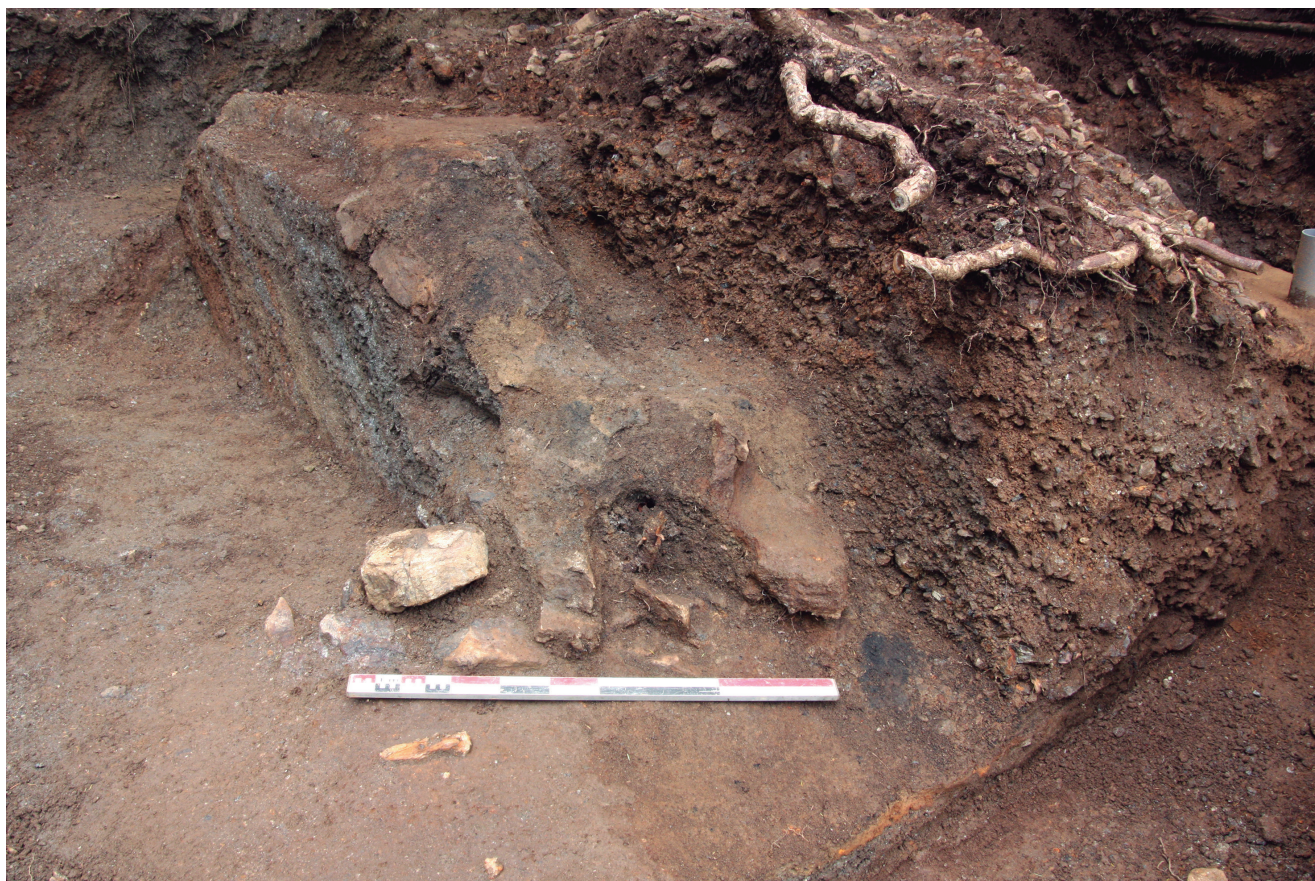
Fig. 4. Vue du sol de concassage (sur lequel est posée la mire), recouvert par des matériaux de halde. La fosse sus-jacente est visible à droite : un tube de carottage en PVC perce son comblement, en cours de fouille (le remplissage atteignait le haut de la photo).

réaménagement volontaire. En dehors de cette intervention, ces comblements ne sont perturbés que par des racines et il est manifeste que ces fosses n'ont jamais été curées. Les matériaux ont donc été volontairement recueillis sans qu'ils semblent avoir pu être utiles à quoi que ce soit. Cette démarche peut s'expliquer par le besoin de retenir des boues qui sans cela auraient coulé sur les entrées de mines situées en contrebas immédiat du carreau.