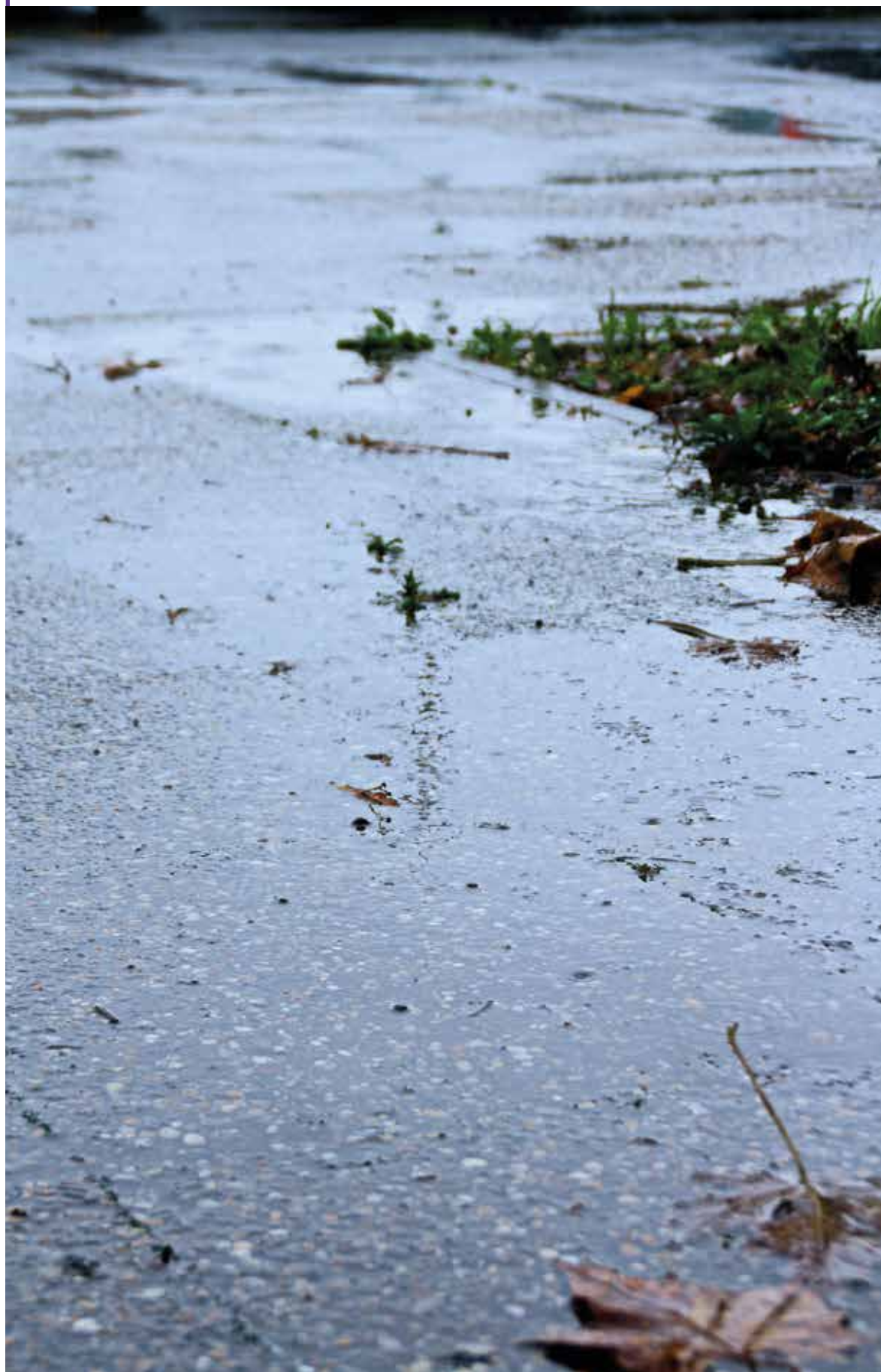
Photo 1 : Ruissellement eaux pluviales sur sol imperméable.