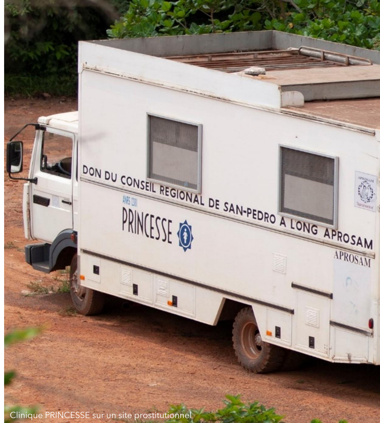
Clinique PRINCESSE sur un site prostitutionnel