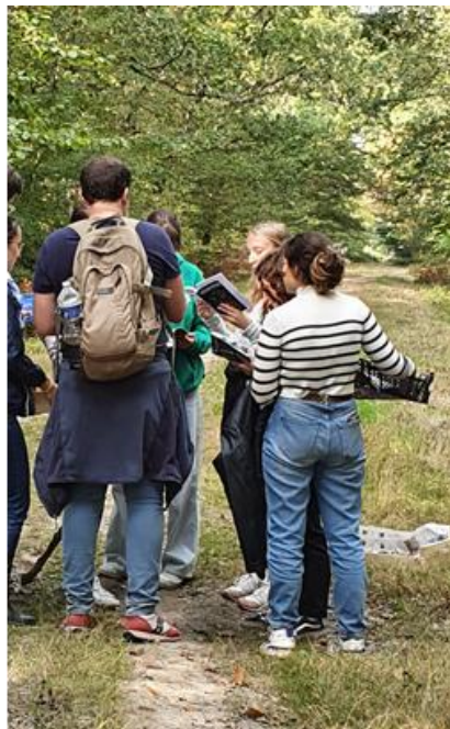
Figure 2 : Récolte au cours de sorties en forêt et identification avec l'équipe enseignante

Ces sorties sont indispensables pour compléter les acquis théoriques et pratiques dispensés à la faculté et permettent de replacer les champignons dans leur biotope et de sensibiliser les étudiants à la place des champignons dans le monde vivant. Lors de ces sorties les étudiants sont répartis en petits groupes sous la responsabilité d'un enseignant. Au fur à mesure de la cueillette ils tentent d'en faire l'identification, accompagnés et aidés par l'enseignant (figure 2).