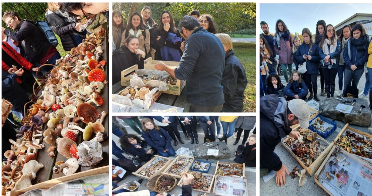
Figure 3 : Mise en commun des récoltes et tri des espèces par catégorie de champignons

La mycologie est une des premières matières enseignées aux étudiants de deuxième année, il s'agissait donc aussi de mettre en confiance les étudiants pour leurs premiers examens de ce long cursus. Un tutorat, animé par des étudiants de 3 e année, a été ajouté au dispositif suite aux premiers retours des étudiants pour les accompagner dans leurs apprentissages, en collaboration avec l'équipe pédagogique.