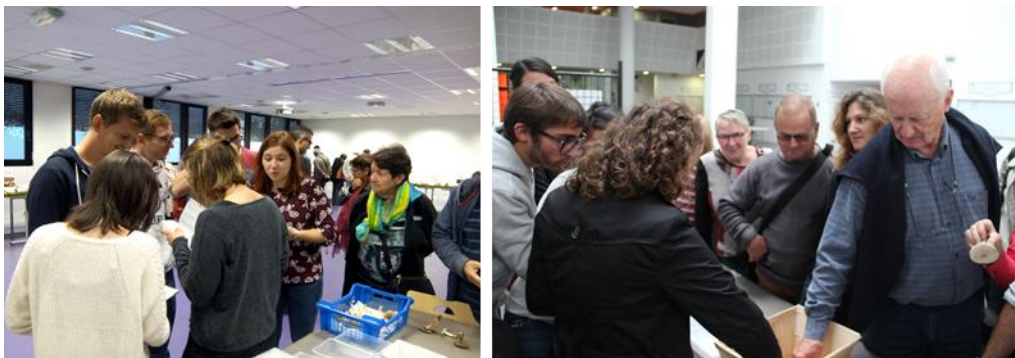
Figure 6 : Tri de paniers apportés par des visiteurs de l'exposition

Tout au long de cette manifestation, ouverte aux étudiants et au grand public, les visiteurs peuvent apporter leur cueillette pour faire déterminer les champignons. Les étudiants, sous la supervision de l'équipe pédagogique, vont ainsi s'entraîner à l'exercice du tri de panier et prodiguer les conseils de prévention (figure 6).