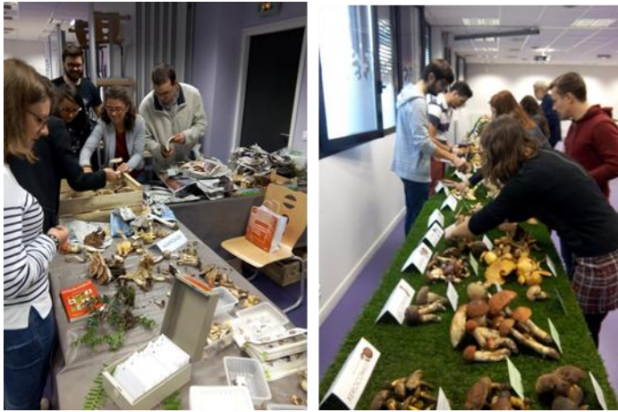
Figure 4 : Mise en place de l'exposition

l'animation (figure 5) de l'exposition de champignons annuelle proposée par l'UFR des Sciences Pharmaceutiques et Biologiques de Nantes Université.