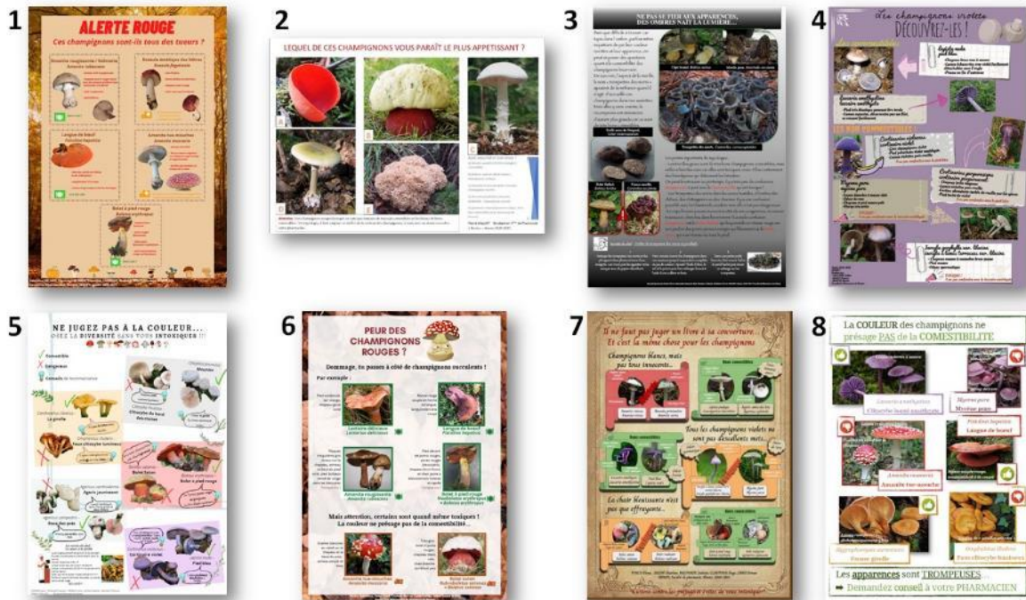
Figure 7 : Exemples d'affiches informatives réalisées par les étudiants dans le cadre de l'exposition mycologique

Cet événement est un outil pédagogique supplémentaire proposé à l'étudiant qui va lui permettre de s'investir dans une mission de prévention totalement en lien avec sa future pratique officinale. Dans le cadre de cette manifestation, les étudiants vont compléter leur compétence d'éducation du grand public en santé publique par la réalisation d'affiches informatives en lien avec la cueillette et la consommation des champignons (figure 7).