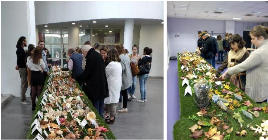
Figure 5 : Animation de l'exposition par les étudiants

Tout au long de cette manifestation, ouverte aux étudiants et au grand public, les visiteurs peuvent apporter leur cueillette pour faire déterminer les champignons. Les étudiants, sous la supervision de l'équipe pédagogique, vont ainsi s'entraîner à l'exercice du tri de panier et prodiguer les conseils de prévention (figure 6).