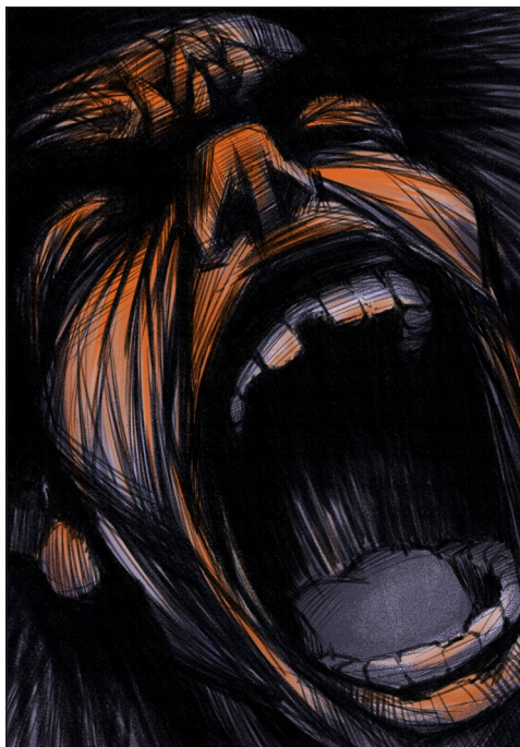
Fig. 3 — Œuvre de Wooh (nom d'artiste Oo), Émotion, le cri .

dans les œuvres des artistes, mais pas seulement. L'émotion traverse l'ensemble des témoignages recueillis. Par contraste avec les enquêtes effectuées jusqu'alors en Birmanie, dans les villages des hautes terres comme parmi les travailleurs de l'exil entassés dans les enclaves de Bangkok, les entretiens auprès de la « Génération Z » post-coup d'État sont imprégnés d'une atmosphère pesante. Le regard se fixe, les lèvres pincées retiennent les larmes, les têtes brassent le vide. Certains se lèvent, pris d'une soudaine bougeotte, font quelques pas, allument une cigarette, trébuchent contre le seuil en sortant à l'extérieur prendre l'air ou renversent un verre d'un geste un peu trop brusque. Invariablement, le témoignage reprend, sur un trait d'humour maladroit ou en nettoyant le verre de ses lunettes pour se donner bonne contenance, ponctué de raclements de gorge et de temps morts.