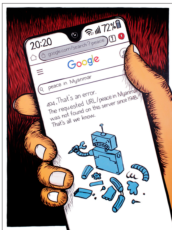
Fig. 1 — Œuvre de Ko Thoe, Guerre civile sans fin, à la recherche de la paix . Source : Ko Thoe, Yangon (2020).

intérieure et des replis identitaires contre lesquels ne cesse de buter la Birmanie depuis l'indépendance. Réalisé en 2020, et donc peu avant le coup d'État, un dessin de Ko Thoe, artiste birman réfugié en France, est à cet égard une merveille de condensé éditorial : le cadran d'un téléphone portable affiche « Erreur 404. L'URL "paix au Myanmar" n'a pu être trouvée sur ce serveur depuis 1948 » 4 (voir Fig. 1).