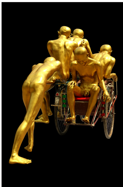
Fig. 8 — Œuvre de Aung Ko, Anaghat/Forward . [Cette figure apparaît en couleur dans le numéro en ligne.]