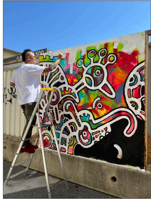
Fig. 10 — Œuvre de Kyar Pauk, Unfinished but Done . [Cette figure apparaît en couleur dans le numéro en ligne.]