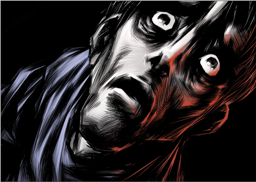
Fig. 5 — Œuvre de Wooh (nom d'artiste Oo), Catharsis .

[Cette figure apparaît en couleur dans le numéro en ligne.]