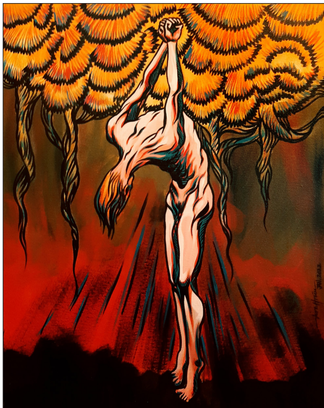
Fig. 2 — Œuvre de Ko Thoe, Survivre sous la torture .

soir dans les rues, lorsque les manifestations spontanées étaient encore possibles. Une génération convaincue de la nécessité d'une ère nouvelle à bâtir, et, avec elle, de quelques frontières à transgresser.