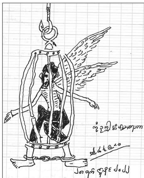
Fig. 7 — Œuvre sans titre de Aung Ko.

dont l'accès au public est impossible. Le flou qui se dégage de la juxtaposition d'images passées et actuelles a pour objet, explique la photographe, de « défiger » ces architectures et de traduire, dans le même temps, cette longue ère d'incertitude que n'en finissent pas de traverser le pays et ses habitants. L'espace-temps est aussi l'un des moteurs créatifs de Aung Ko. Lors d'un entretien à Lyon en 2022, il dessine sur mon cahier de notes une cage suspendue à un croc de boucher dans laquelle se trouve un homme-oiseau, chevilles entravées et ailes prisonnières des barreaux (voir Fig. 7). Son discours porte sur la notion d'un temps suspendu après le récent coup d'État. C'est en particulier ce que symbolise une de ses œuvres : un calendrier sur lequel le dernier jour imprimé est celui du 1 er février 2021. Une variante — également exposée en 2022 au Musée d'Art contemporain du Val-de-Marne (MAC VAL) — dresse le décompte des jours post-coup d'État par des successions de cinq traits, l'un barrant les quatre autres, à la manière des jours écoulés gravés sur les murs d'une prison.