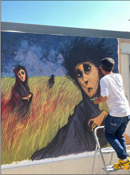
Fig. 9 — Œuvre de Wooh (nom d'artiste Oo), Those who Escaped Quietly from the Killing Field . [Cette figure apparaît en couleur dans le numéro en ligne.]