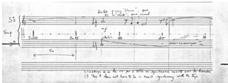
Figure 4. Passage vers 5'18'' de Inharmonique .

V.T. Dans Inharmonique , il y a plusieurs passages (notamment à 5'18'') où la voix sort de la résonance d'une cloche, comme si c'était une augmentation de sons électroniques (Figure 4). Comment concevez-vous l'interprétation de ces passages-là ?