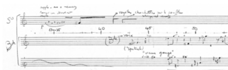
Figure 2. Passage vers 13'35'' de Inharmonique .

I.J. Inharmonique a été faite surtout à Marseille, mais par exemple le passage à 13'18'' a été enregistré à l'Ircam (Figure 2). Alors, c'était sa façon à lui de ramasser des pierres, de ramasser des séquences qu'il utilisait après, et de les travailler comme il avait envie. Entre l'Ircam et Marseille, il n'y a que lui, je crois, qui pourrait dire le nombre d'heures qu'il a passé dans un endroit ou l'autre.