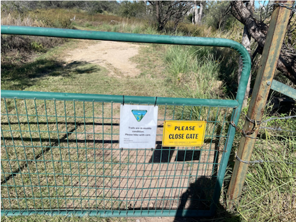
Fig. 3. Barrières à la Cienega Creek.

terme, basé sur la science, de la gestion des parcours et de la végétation riparienne pour obtenir une évaluation objective sur laquelle établir les décisions de gestion des terres». Depuis lors, un programme pilote ( monitoring program ) de cinq ans, qui montre que la présence des bêtes en hiver permet d'éviter l'érosion et de maintenir la stabilité des zones ripariennes, a été mis en place et donne des résultats encourageants. Pour effectuer le monitoring , le Forest Service et le CNF Sierra Vista Ranger District ont équipé la zone en puits, conduites d'eau et barrières –les ranchers réalisent le travail d'installation. Par ailleurs, les ranchers collaborent avec l'Université d'Arizona à Tucson pour un Sustainable Ranch Land Management Program. Ils travaillent ainsi à la modification du modèle du pâturage pour implanter un monitoring program susceptible d'augmenter l'eau disponible et les enclosures sur 55 000 acres. Ce programme qui promeut de nouvelles pratiques intégrant le savoir des ranchers reçoit à la fois de l'argent d'agences fédérales et étatiques (Clean Water Act, le département de l'agriculture, l'Arizona Game and Fish Department).