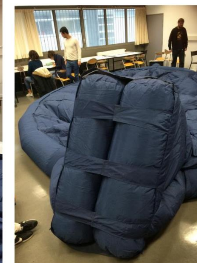
L'entrée du dôme se fait un moyen d'un sas