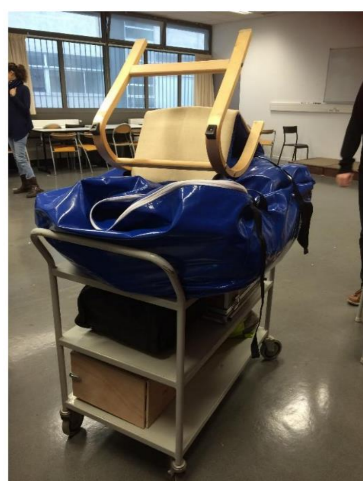
Tout le matériel tient sur le chariot