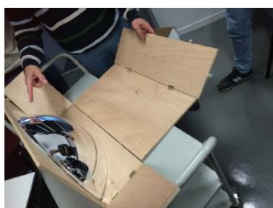
Ouverture de la mallette contenant le miroir