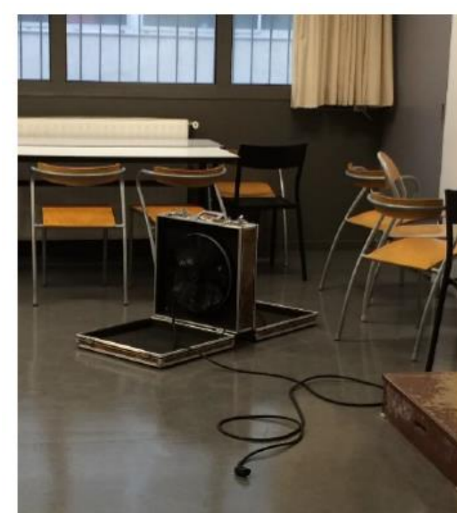
Ouverture de la boîte contenant le ventilateur