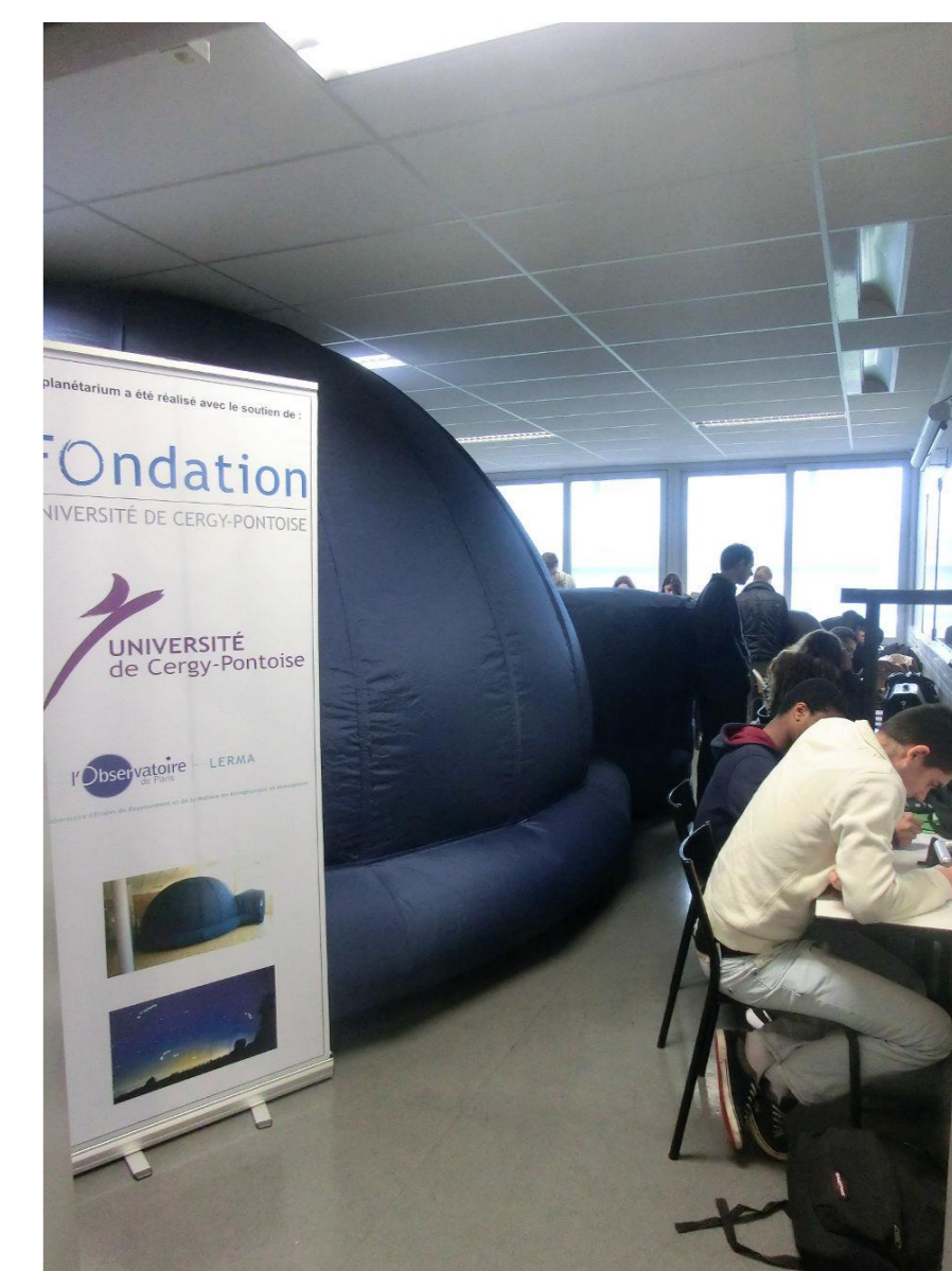
avant le dôme