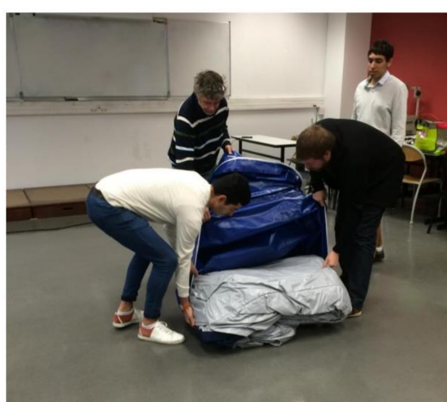
On sort la structure gonflable de son sac