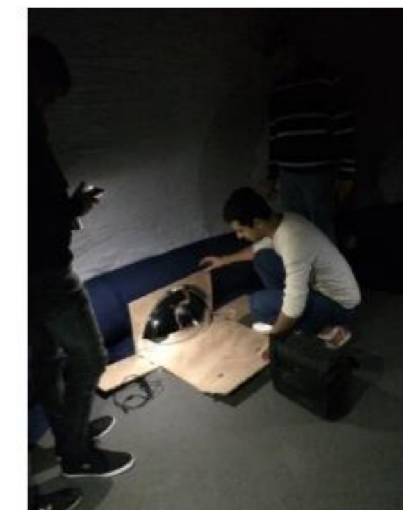
Placer le rétroprojecteur face au miroir en faisant attention de centrer l'image