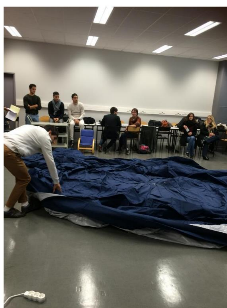
Déplier la structure en plaçant l'ouverture à l'opposé du ventilateur