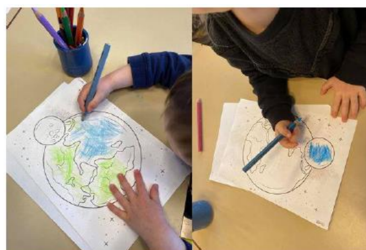
Après le dôme