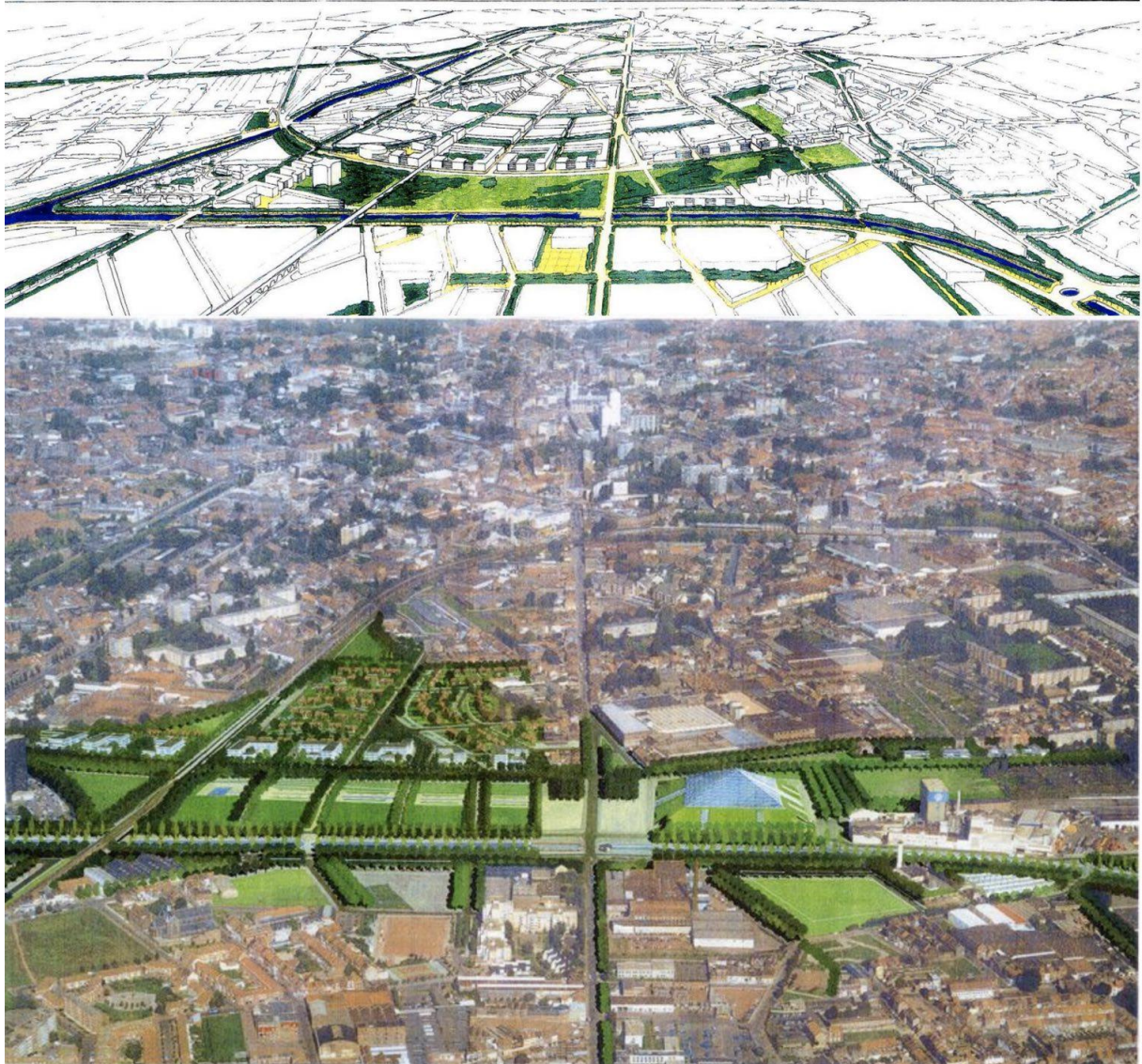
2. Extraits des études de l'agence Devillers pour l'Union. On y voit l'articulation du plan autour du grand parc central, l'apparition d'un équipement métropolitain et quelques préfigurations des formes urbaines autour du parc (Haut : Étude de 1994, Christian Devillers et AMAVI. Bas : Étude de l'Union Olympique 1996, Christian Devillers, Marchiaro et D'Albas).