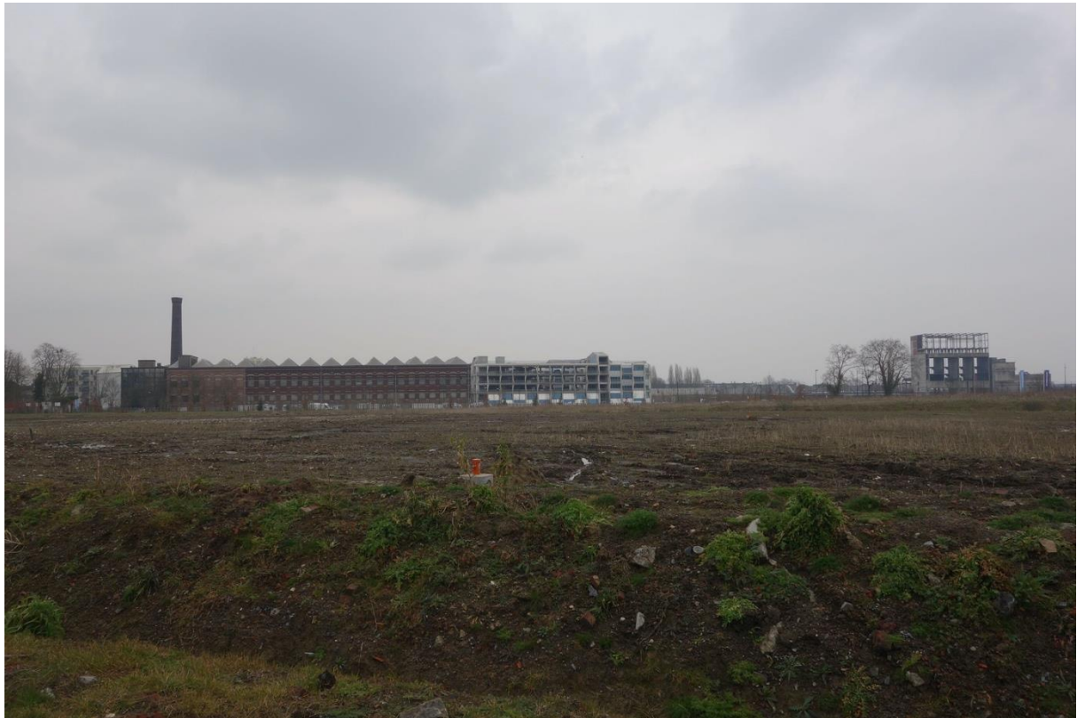
1. Terrains en attente d'opérations sur le secteur central de L'Union, témoignant de la difficulté de commercialisation du projet (Jenny Reuillard pour le groupement Obras, Ateliergeorges, 2018)