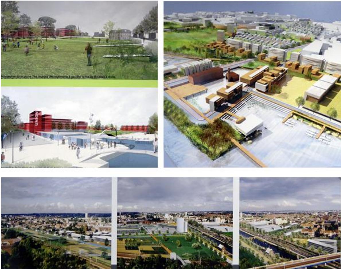
4. Extraits des rendus de la 4 ème phase de marché de définition du site de l'Union (2004). Associés aux plans précédents, ces vues renseignent sur les relations entre les espaces ouverts et les constructions, sur la nature des constructions elles-mêmes, sur les ambiances des espaces ouverts... (haut gauche : Équipe Reichen et Robert ; haut droit : Larue Escudier Dancoine ; bas : équipe P.Chemetoff ).