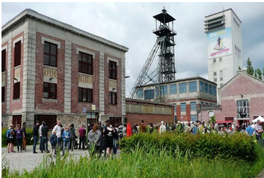
Figure 2 : Culture Commune sur le site du 11/19 à Loos-en-Gohelle (62)

Réalisation : T. Guy. Conception : C. Mortelette