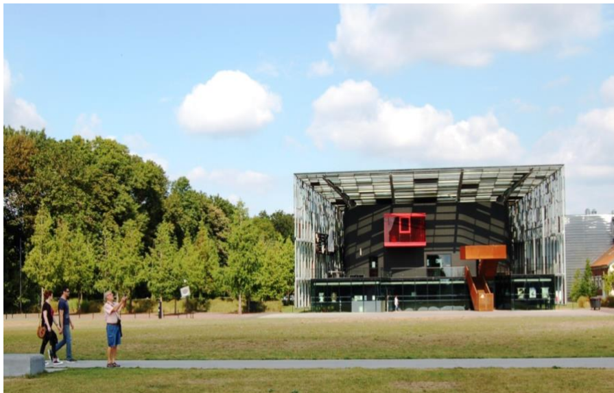
Figure 3 : Le Métaphone sur le site du 9/9bis à Oignies (62)