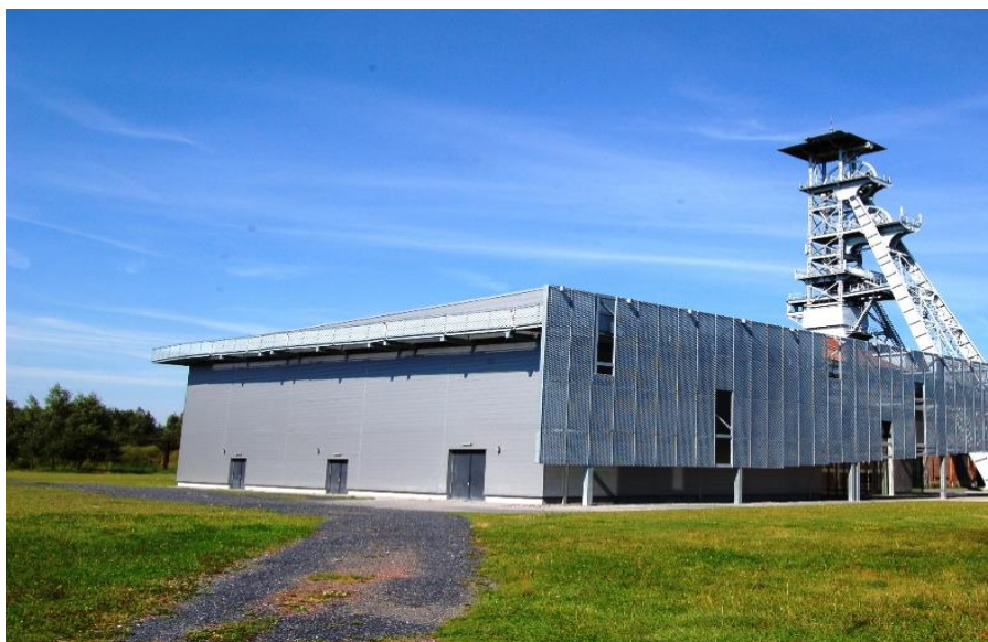
Figure 4 : Creative mine sur la fosse d'Arenberg à Wallers (59)