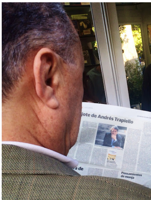
Fig. 3 : photographie associée aux lignes écrites le 13/06/2015 (« Nadie más cortejado ni mimado »)

qui n'est autre que sa recension du Don Quichotte de Trapiello, publiée dans le journal, puis sur son autre blog.