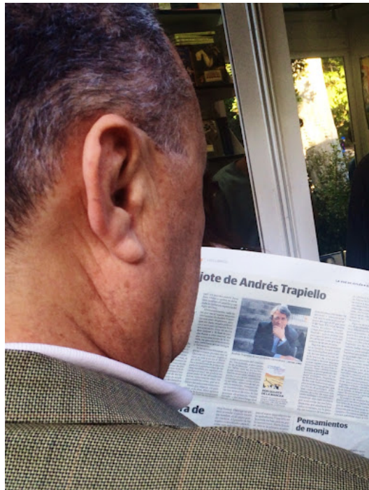
Fig. 3 : photographie associée aux lignes écrites le 13/06/2015 (« Nadie más cortejado ni mimado »)

qui n'est autre que sa recension du Don Quichotte de Trapiello, publiée dans le journal, puis sur son autre blog.